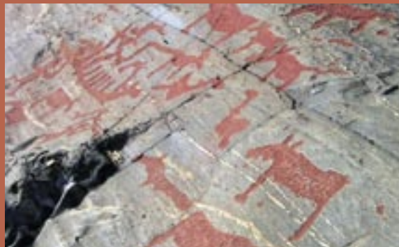
Bilder av älgar och båtar vid Nämforsen.