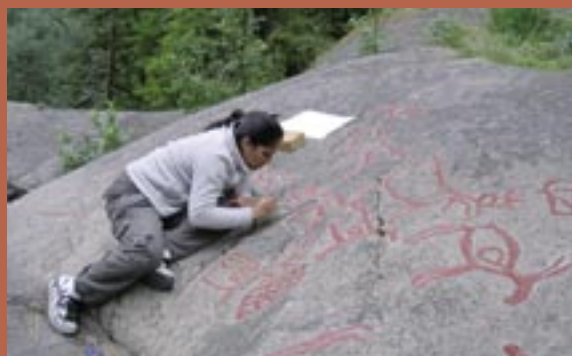
Hällristningarna i Glösa dokumenteras.

De vanligaste motiven på hällristningarna i Norrland är älgar. Vid Nämforsen finns också många bilder av båtar samt några som föreställer fiskar, fåglar och människor.