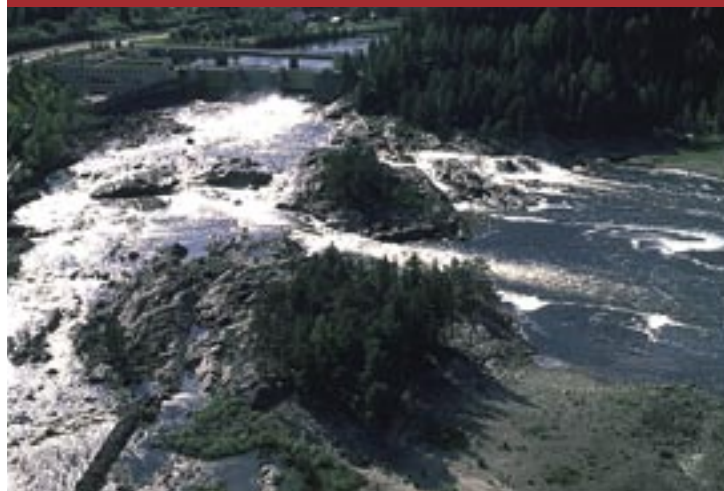
Flygbild över Nämforsen.