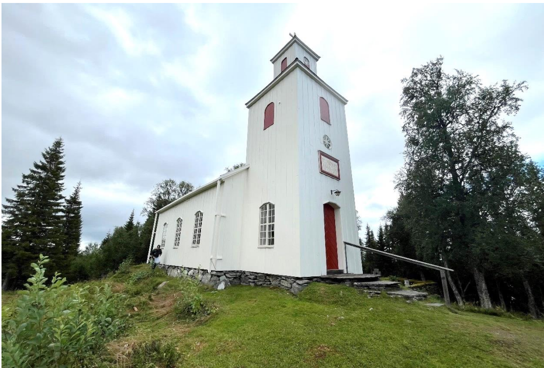
Figur 23 Kolåsens kapell efter åtgärd.