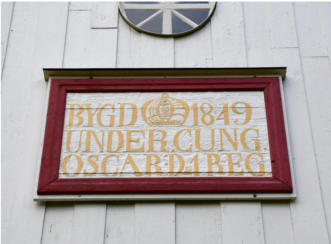
Figur 17 Inskriptionstavla efter åtgärd.