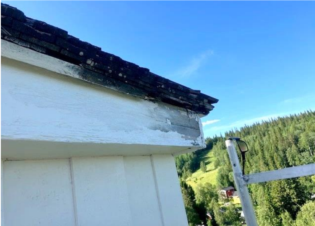
Figur 11 På torntaket hade den nedre brädan av rotet rötskador.