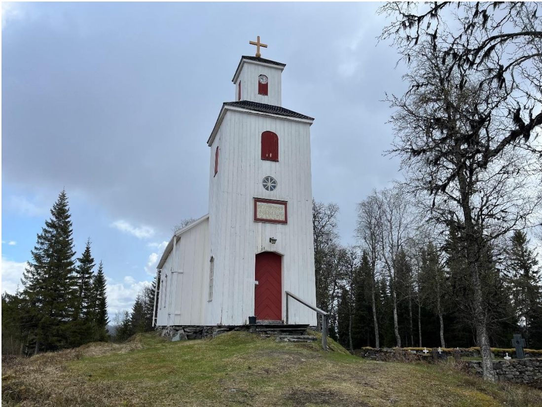
Figur 3 Kolåsens kapell före åtgärd.