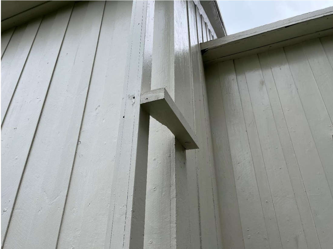
Figur 22 Tre stuprörsfästen i trä har bytts ut.