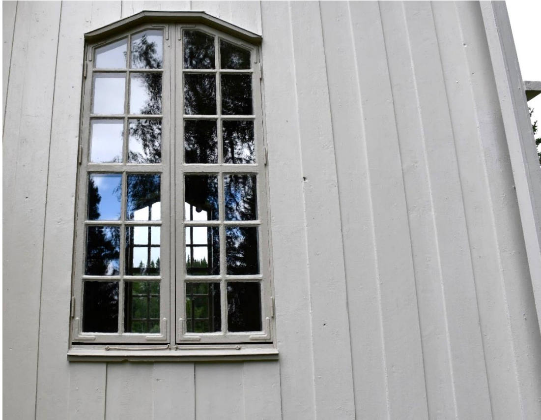
Figur 18 Fönster efter åtgärd.