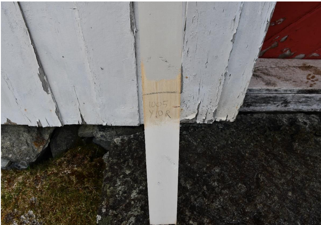
Figur 13a och 13b uppstrykningsprov på fasad, fönster och dörrkulör.