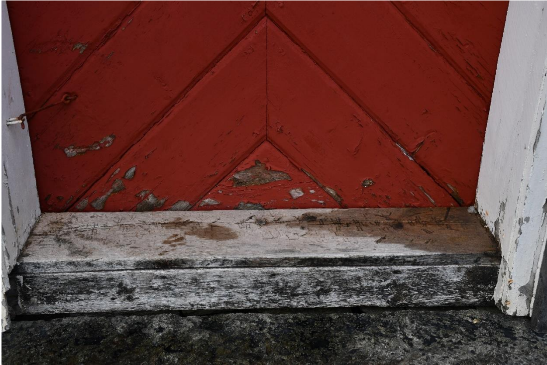
Figur 7 Dörrens målningsskikt var före åtgärd slitet och blekt.