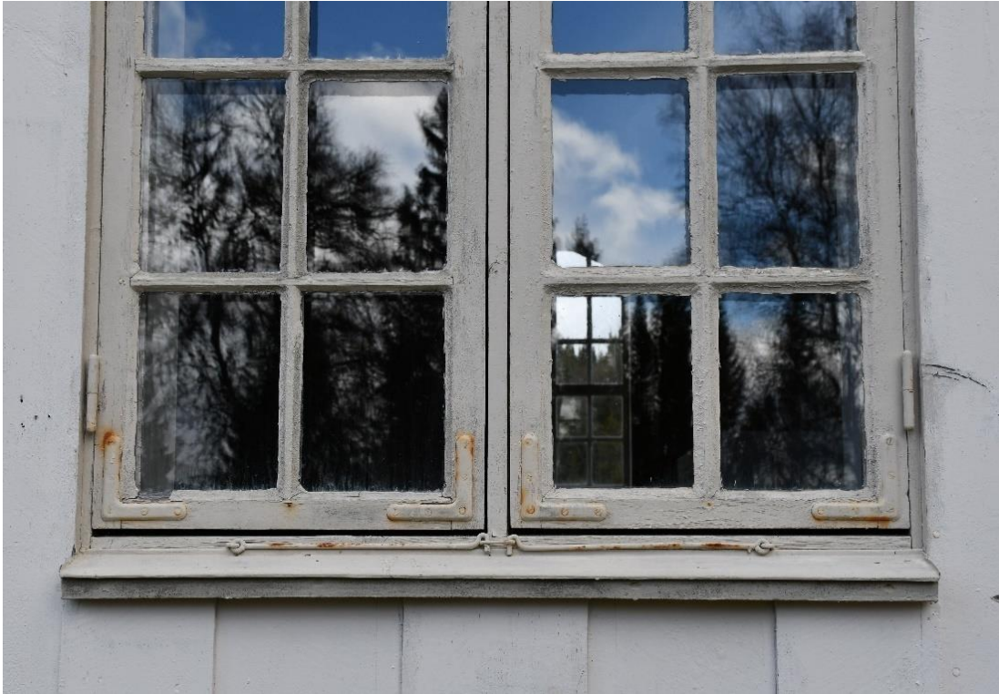
Figur 9 Fönstren var i behov av åtgärd. Kittet släppte på sina ställen och hörnbeslagen hade rostgenomslag.