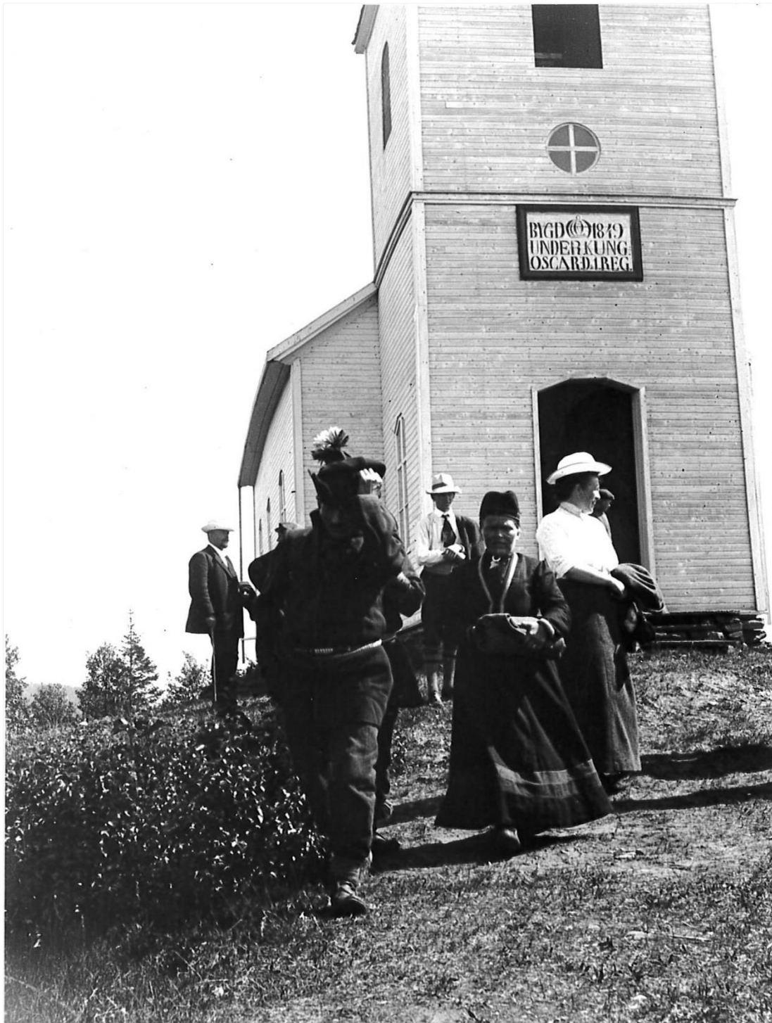
Figur 2 Kolåsens kapell 1914.