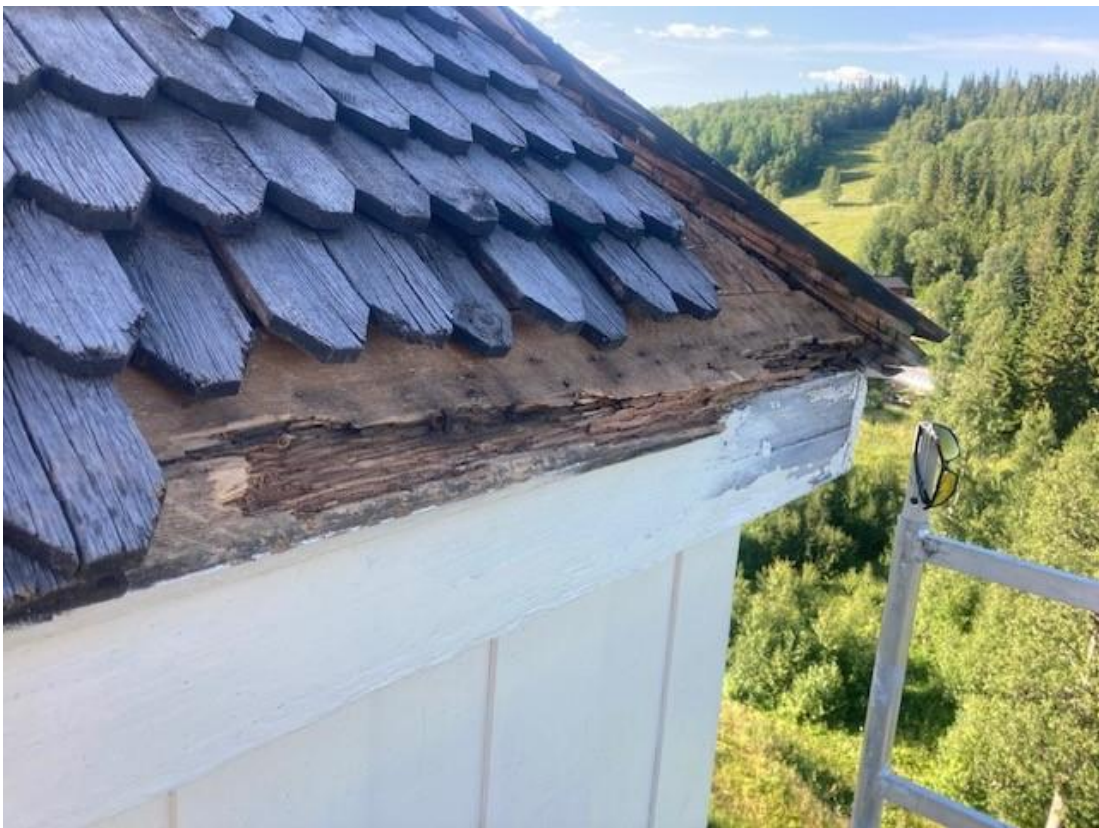
Figur 12 samma område efter att spånen plockats bort.