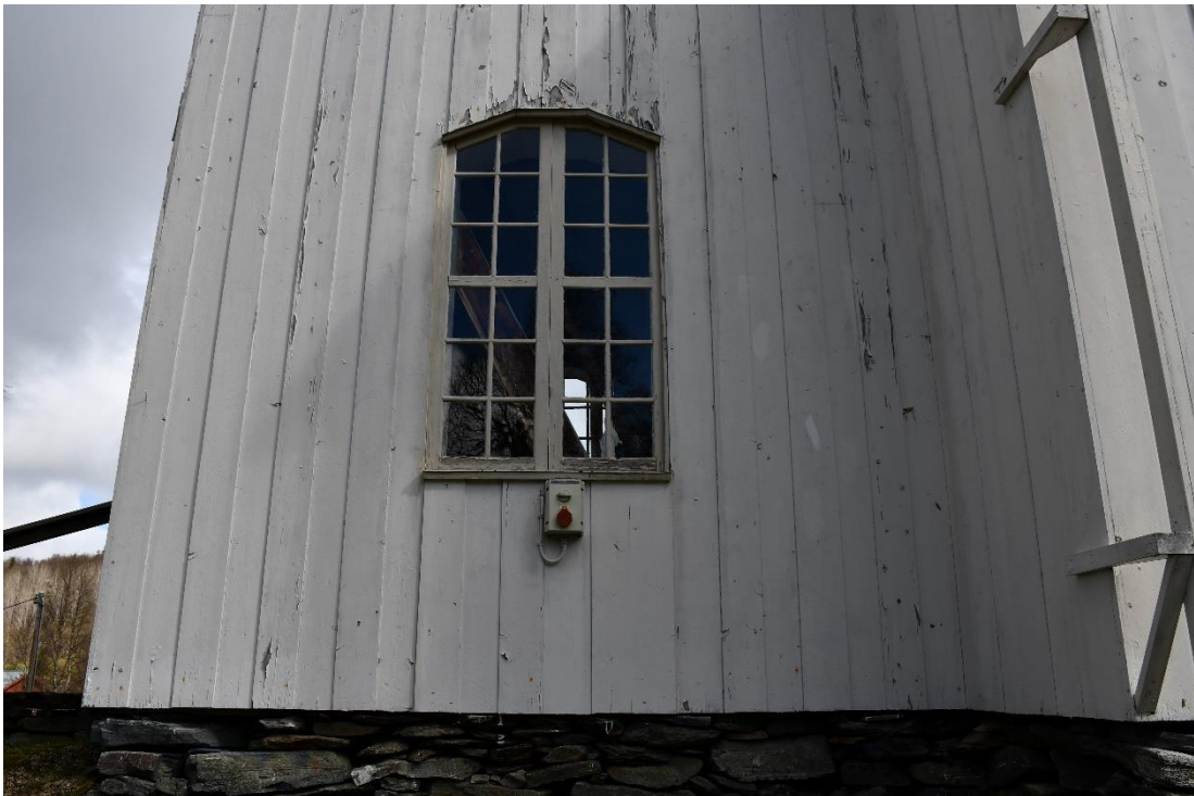
Figur 4 Den vita fasadfärnen flagade.