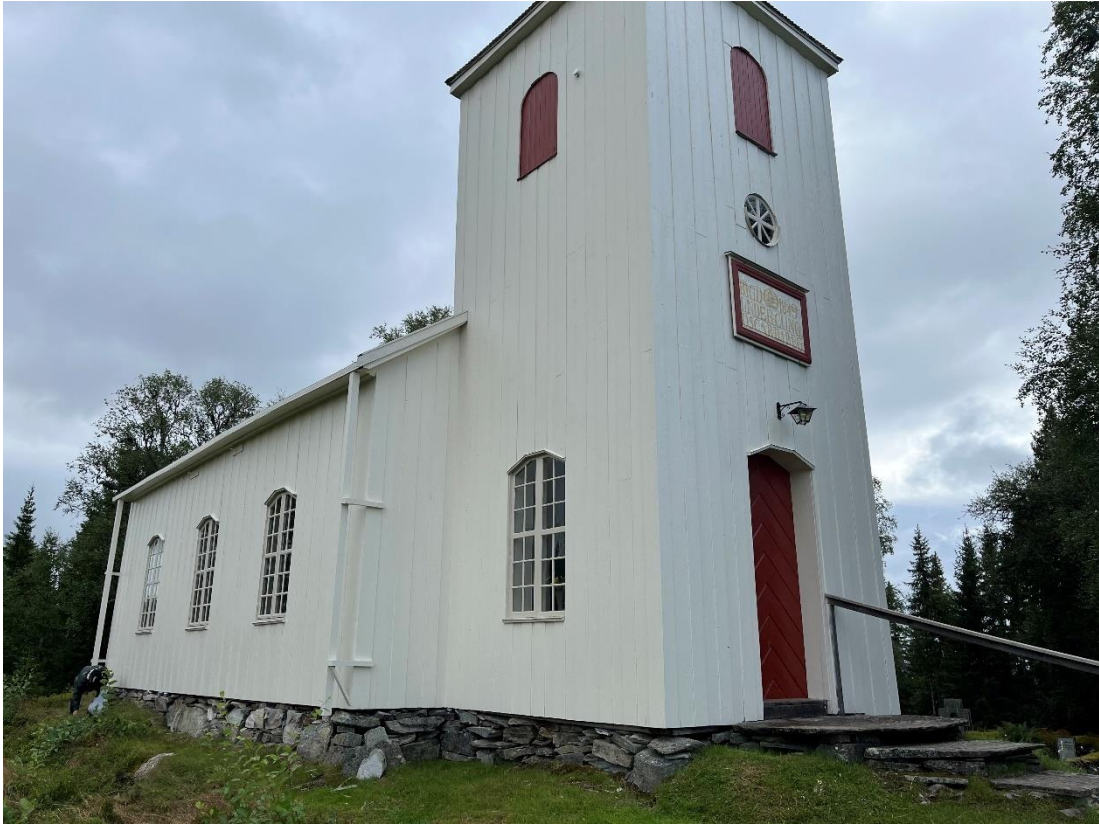
Figur 14 Kolåsens kapell efter åtgärd.