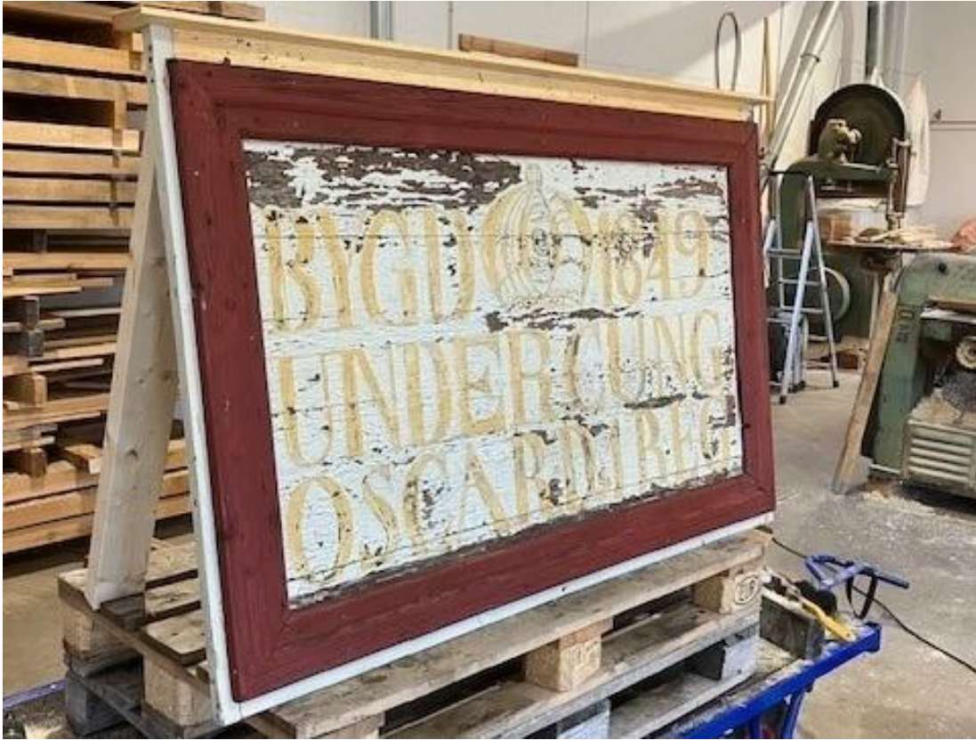
Figur 16 Täckbräda och övre del av ram var rötskadade och kom att bytas ut.