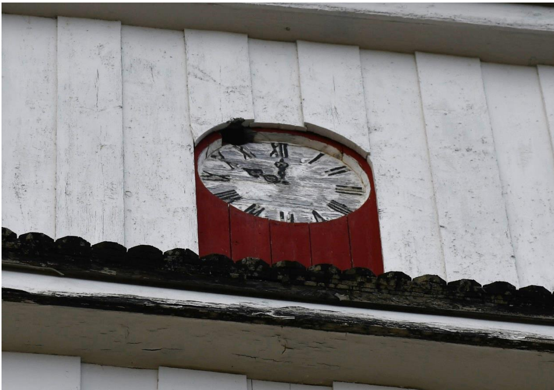
Figur 6 På västra sidan av tornet fanns en skada upptill på urtavlan.