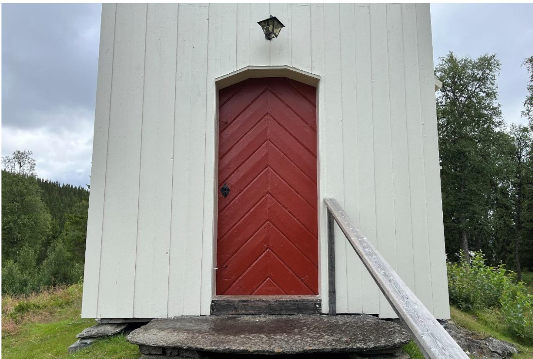
Figur 15 Entré efter åtgärd.