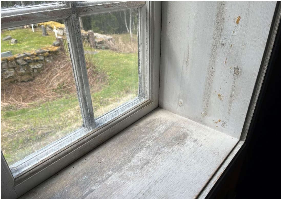
Figur 10 Mellan inner och ytterbåge var endast spröda rester kvar efter målningsbehandling. Invändigt hade fönsterbänkar och fönsternischer färgbortfall.