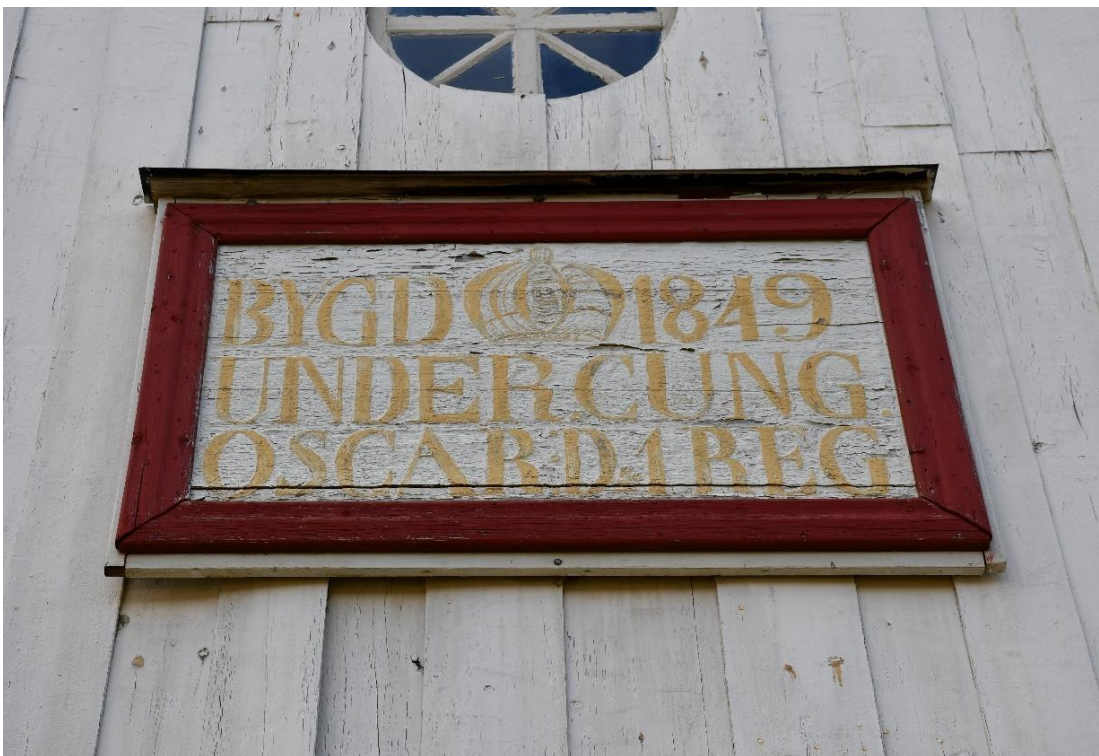
Figur 8 Inskriptionstavlan före åtgärd.