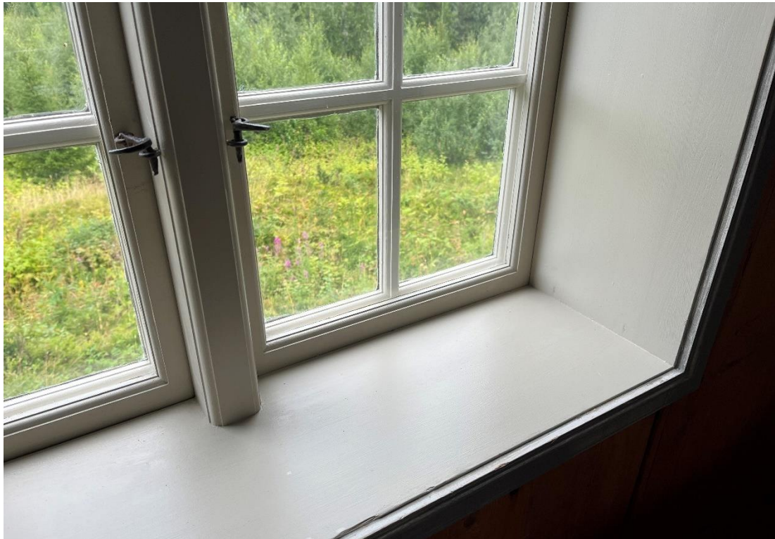
Figur 19 Fönster och fönsternischer har målningsbehandlats med linoljefärg i grå kulör.