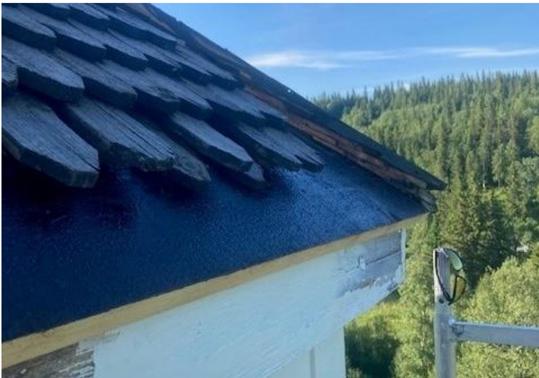
Figur 21 Den nedre brädan av rotet på tornet har ersatts med ny. Bild tagen innan spåntäckningen kompletterats (Foto: Per Malmsten).