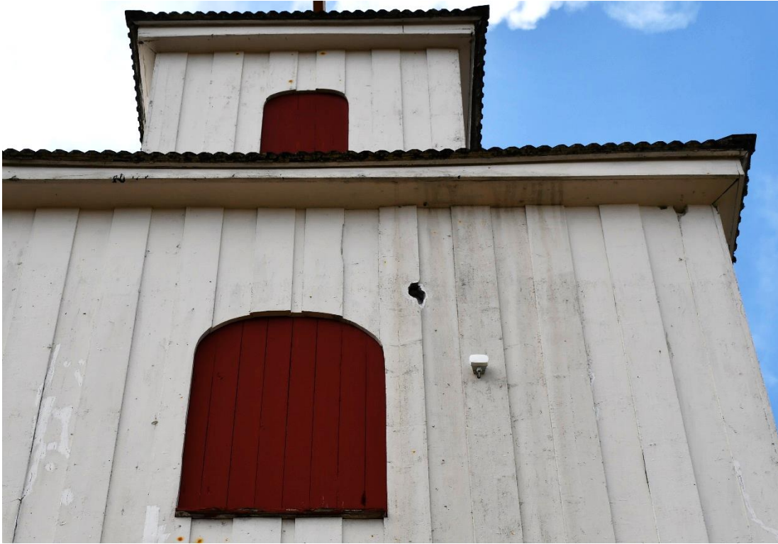
Figur 5 Upptill på tornet fanns flera skador efter hackspett. På norra sidan av tornet fanns dels en mindre skada längst upp mot taket nära nordvästra hörnet, dels ett större hål strax ovanför ljudluckan.