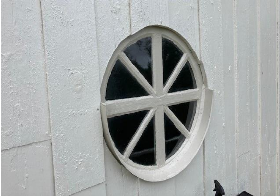
Figur 20 Rundfönstret på tornet har försetts med plåtbleck (Foto: Per Malmsten).