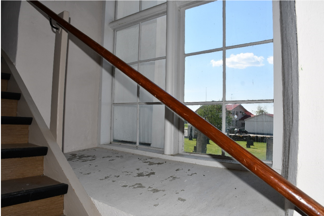
Figur 6 Fönster i vapenhus före åtgärd.