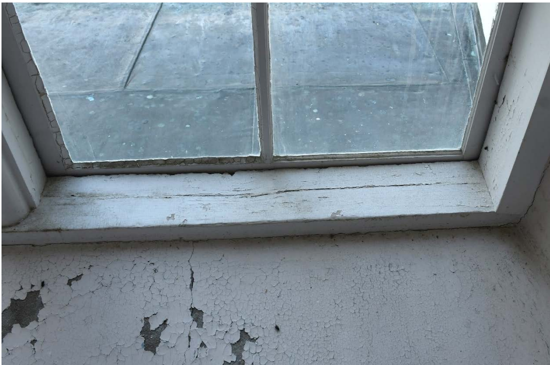
Figur 3 Insida tornfönster före åtgärd.