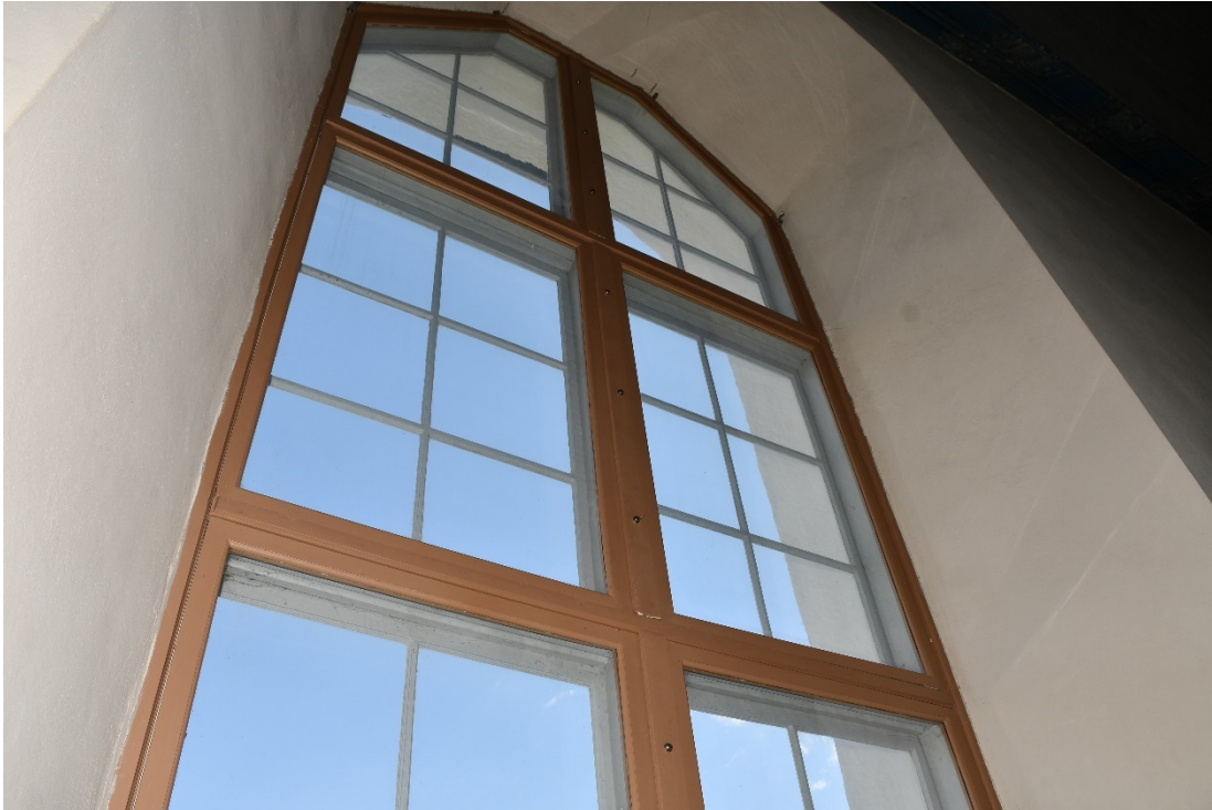
Figur 4 Befintligt innanfönster i kyrkorummet.