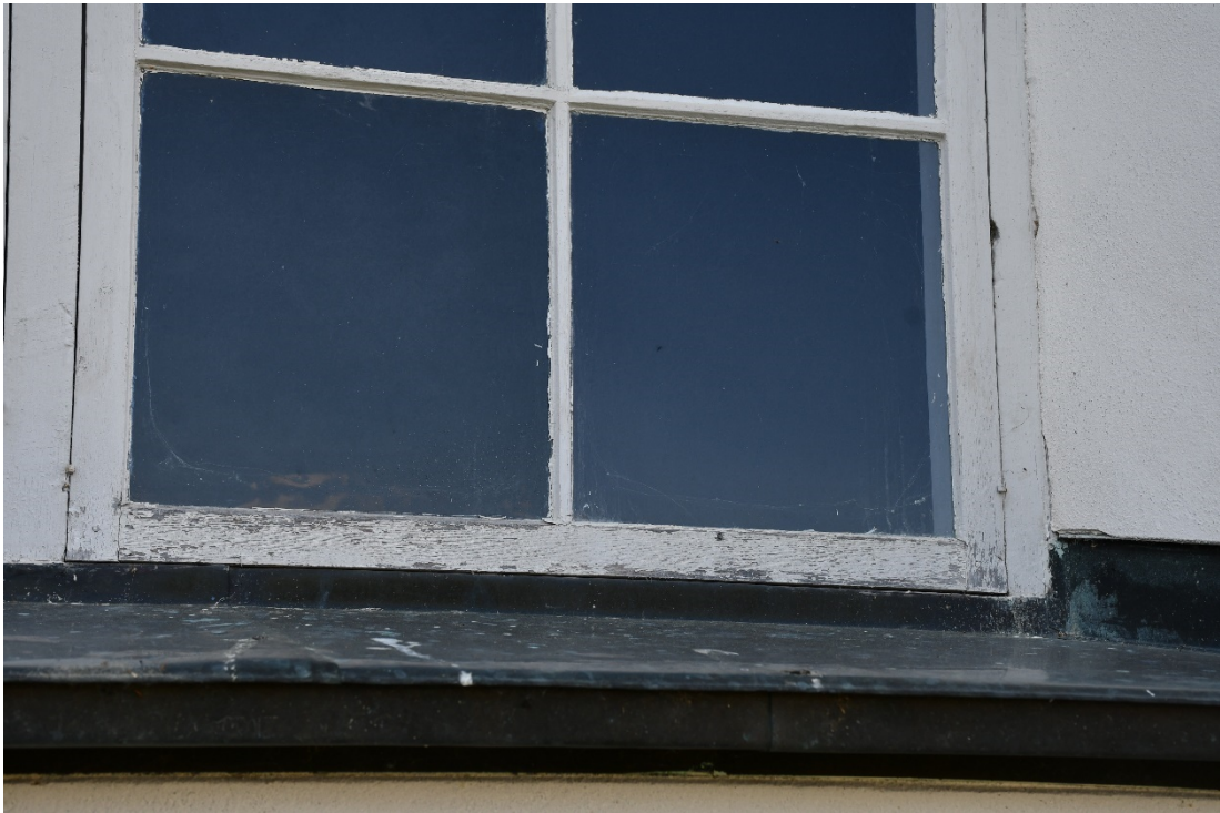
Figur 2 Utsida tornfönster före åtgärd. Färgen flagade och nedtill på bågarna var färgen nästan helt borta på sina ställen.