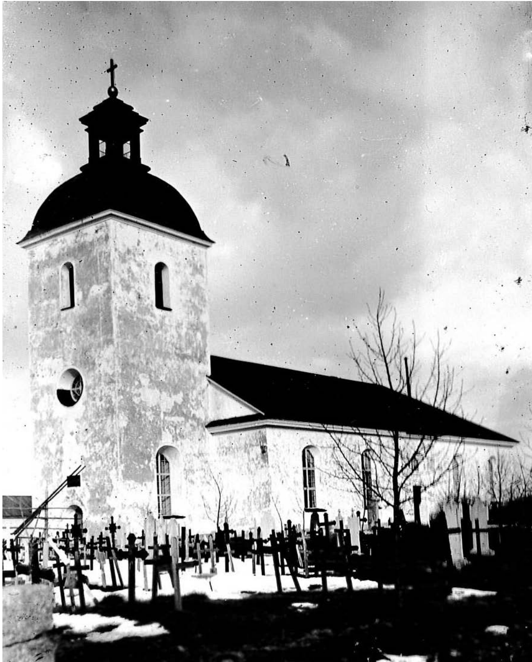
Figur 1 Hammerdals kyrka före ombyggnaden 1923.

Hammerdals socken hade egen kyrka redan under medeltiden. Den nuvarande kyrkan stod klar år 1782. Tornet tillkom 1817–1818. Vid 1780-talets nybyggnad fick långhuset ett brutet tak. I samband med en genomgripande restaurering av kyrkan 1858–59 ändrades taket till dagens valmade sadeltak. Samtidigt ersattes de tidigare blyinfattade fönstren med nya träspröjsade. Vid en exteriör- och interiör restaurering 1923 försågs fönstren med innerbågar.