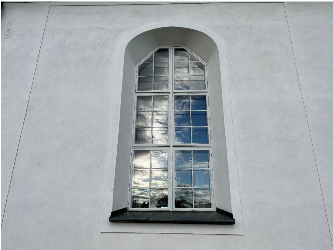
Figur 9 Fönster efter åtgärd.