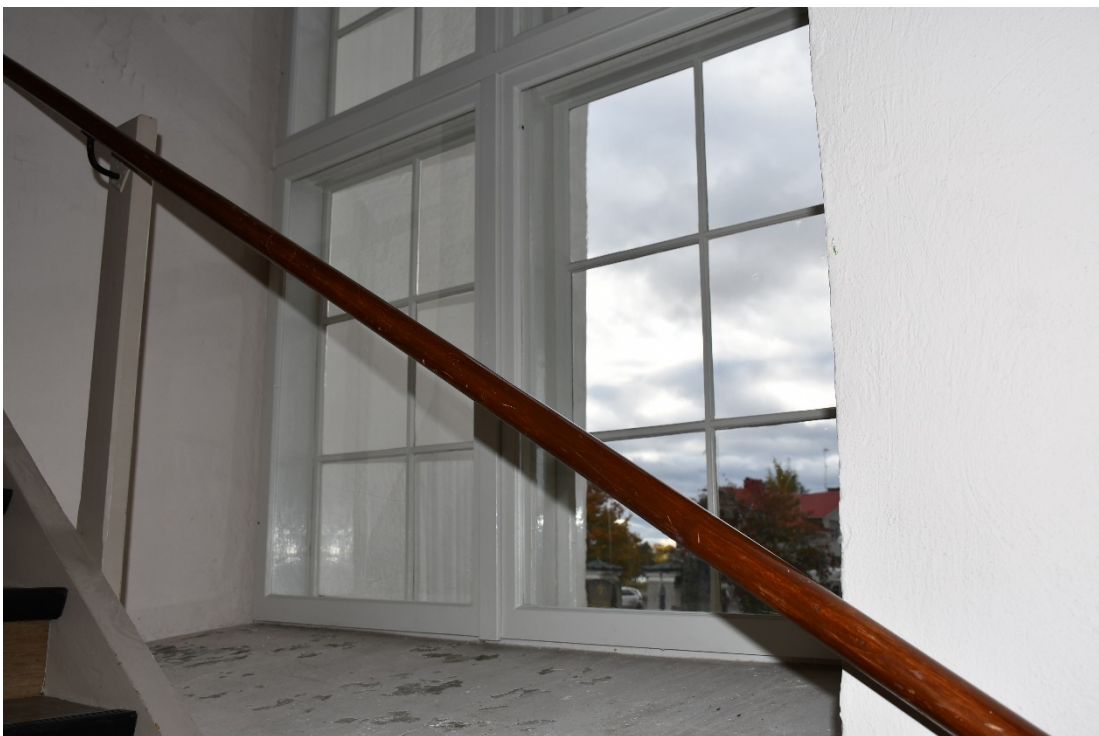
Figur 7 Fönster i vapenhus efter att fönstret försetts med innanfönster.