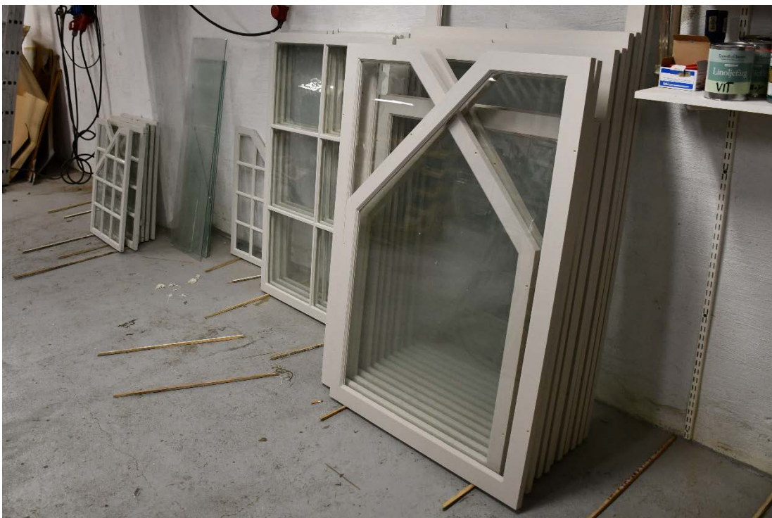
Figur 5 De nya innerbågarna till vapenhuset (närmast i bild).