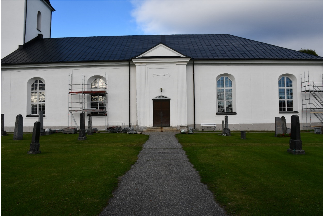
Figur 8 Långhus mot söder under pågående arbete.