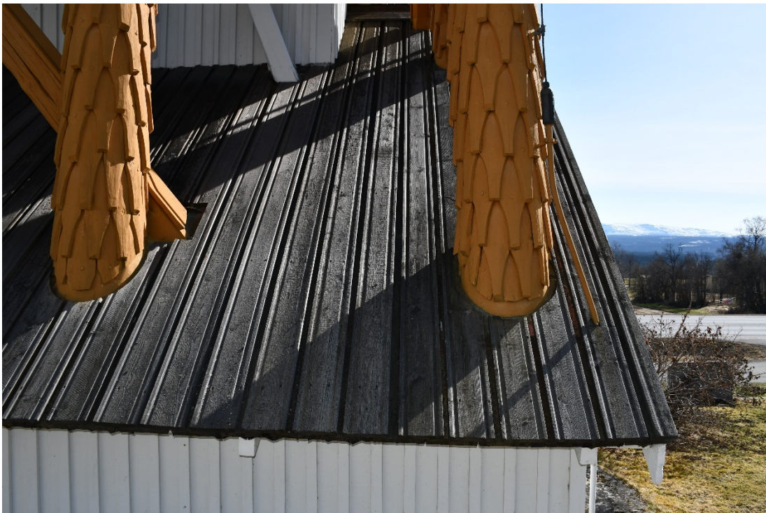
Figur 8 Falttak på klockboden före åtgärd.