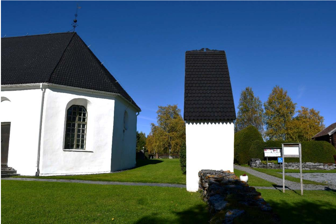
Figur 3 Del av kyrka och stigport efter åtgärd.