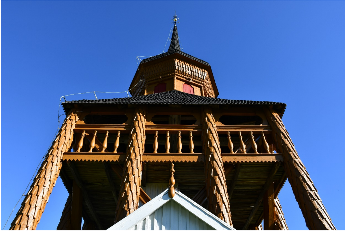
Figur 13 Övre delen av klockstapeln efter åtgärd.