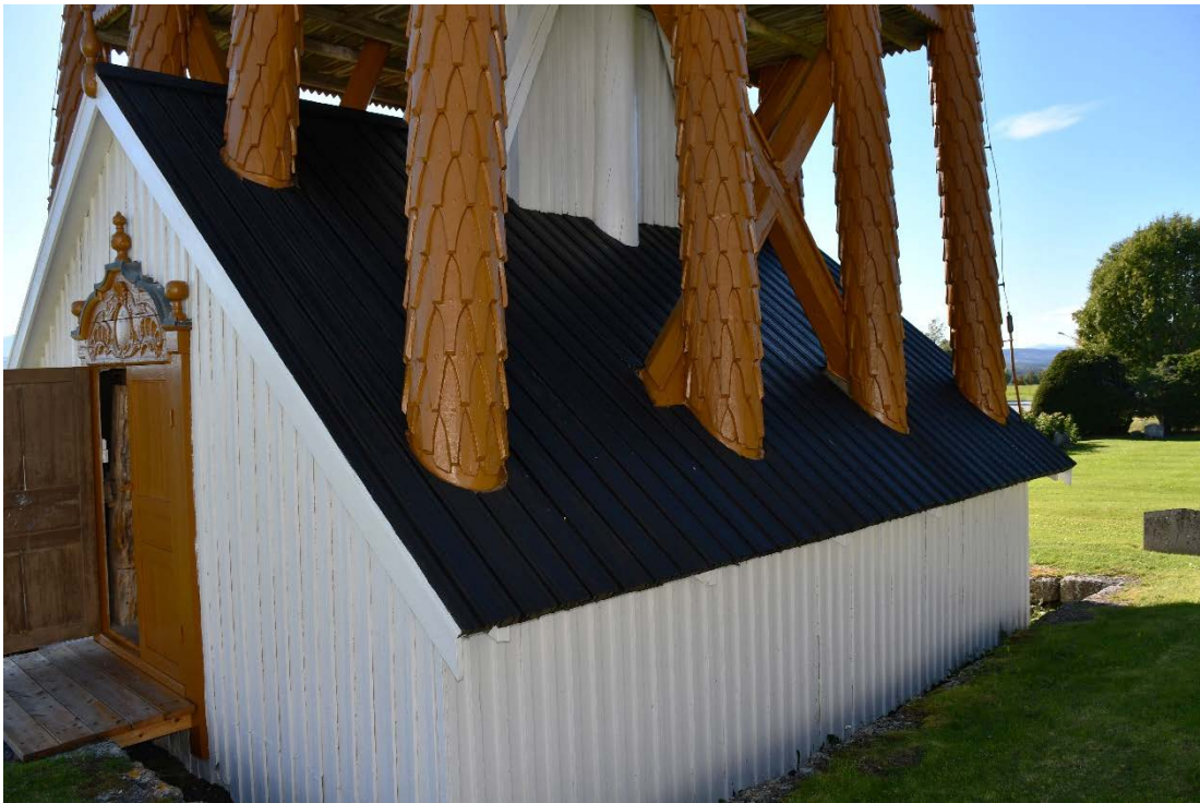
Figur 12 Klockbod efter åtgärd.