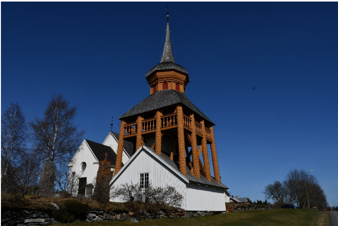
Figur 4 Klockstapel före åtgärd.