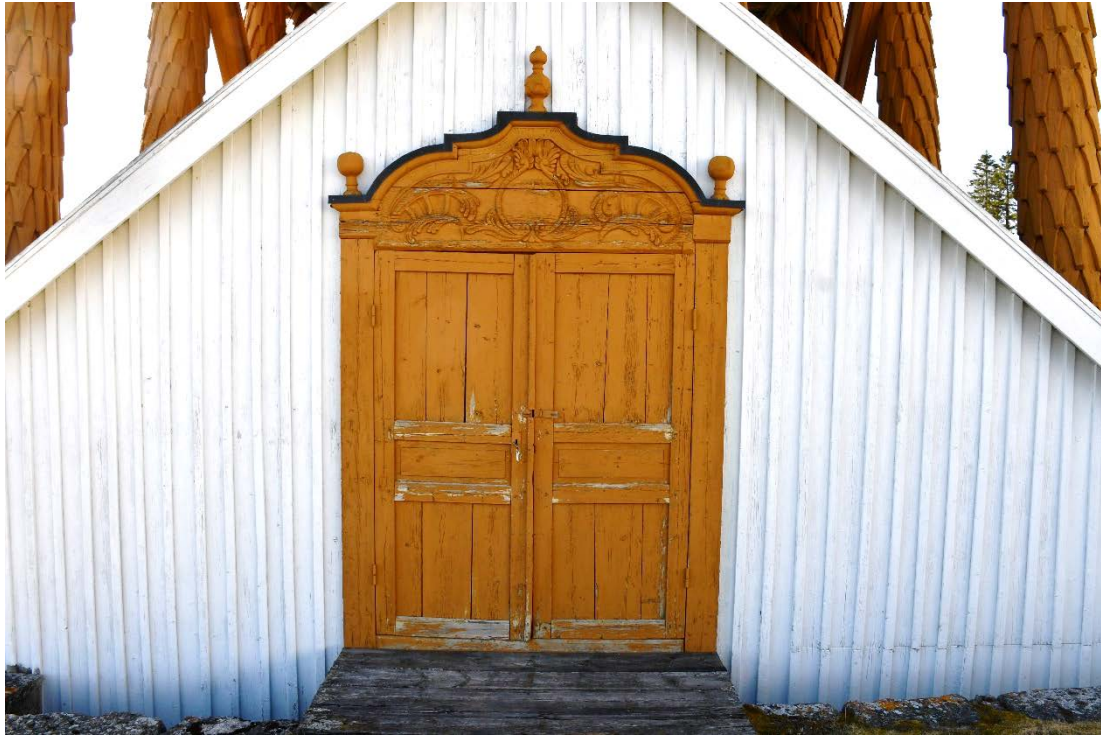
Figur 5 Dörromfattning på klockstapel före åtgärd. Notera den flagande färgen på dörrblad och överstycke.