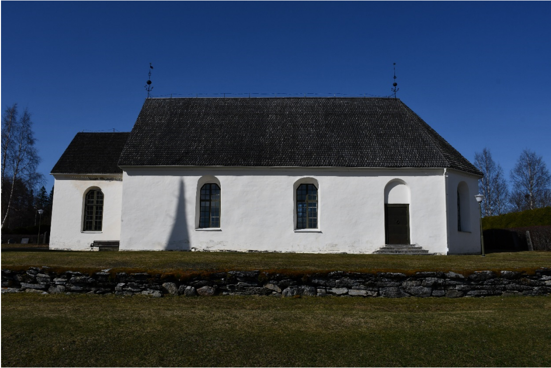
Figur 1 Södra långsidan innan tjärning.