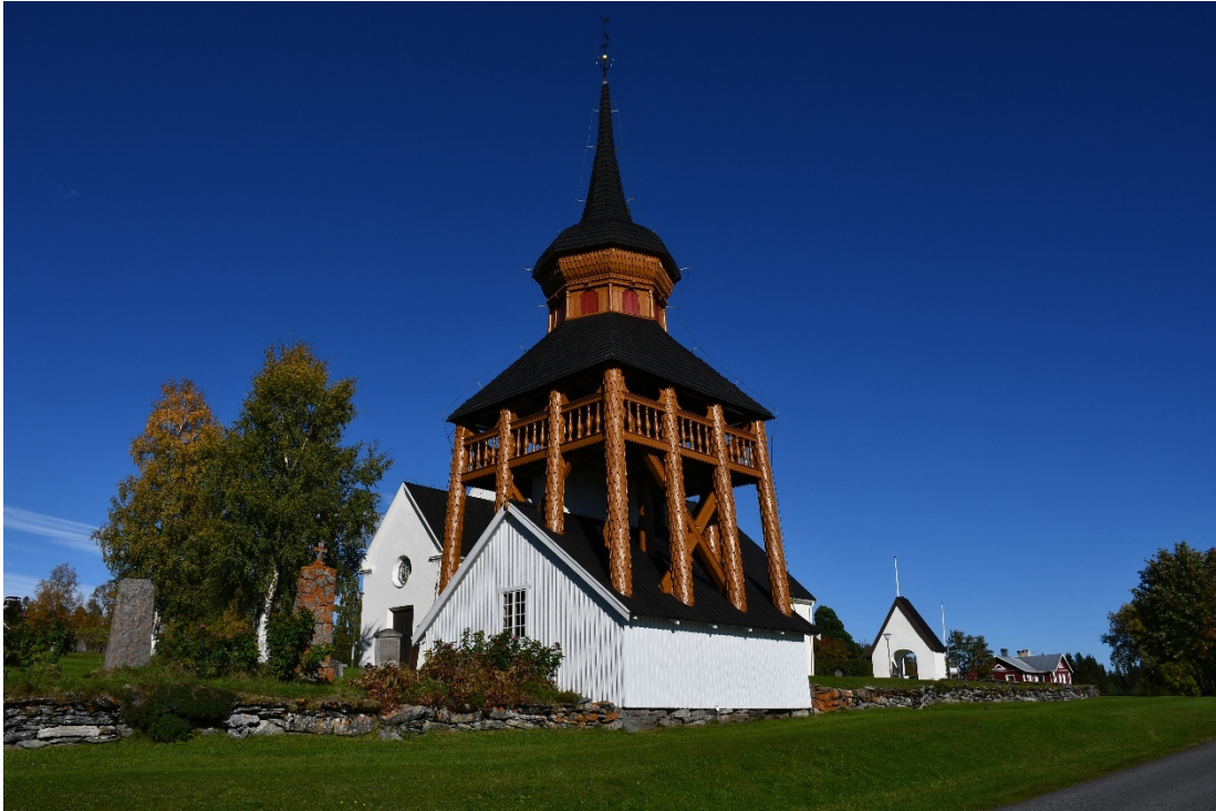
Figur 9 Klockstapel efter åtgärd.