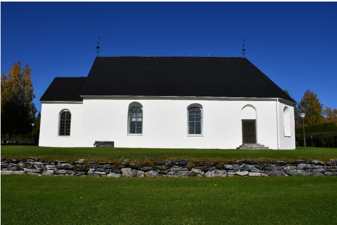
Figur 2 Södra långsidan efter åtgärd.