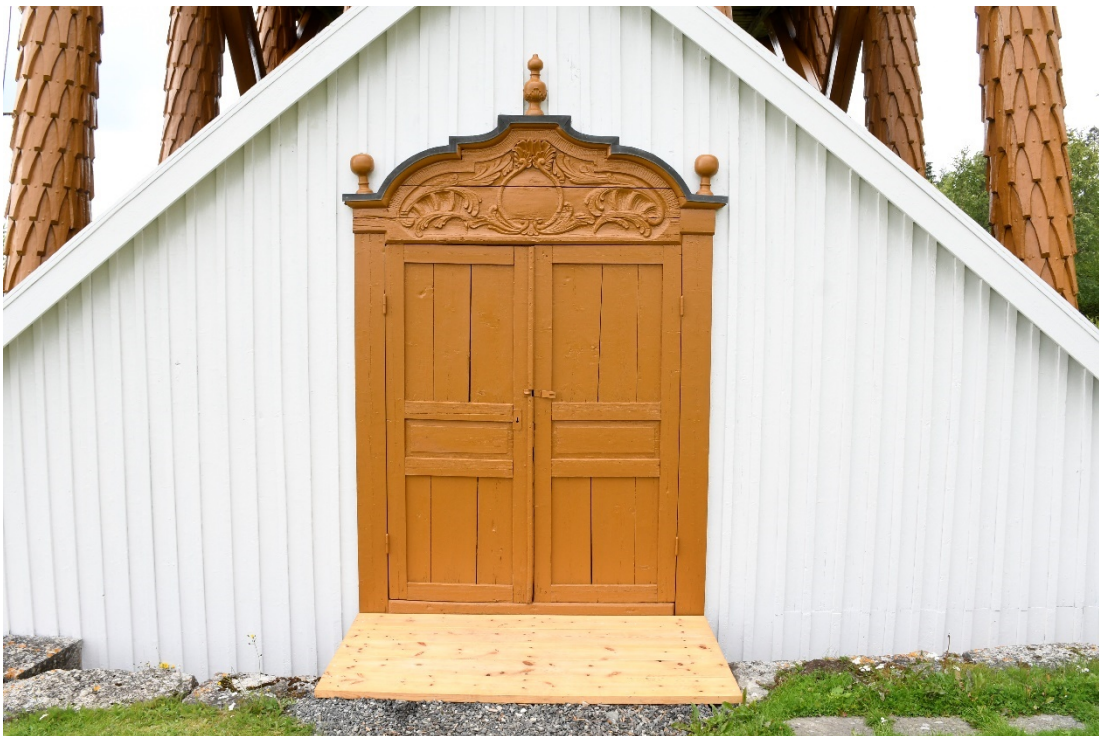
Figur 10 Dörrömfattning på klockstapel efter åtgärd.