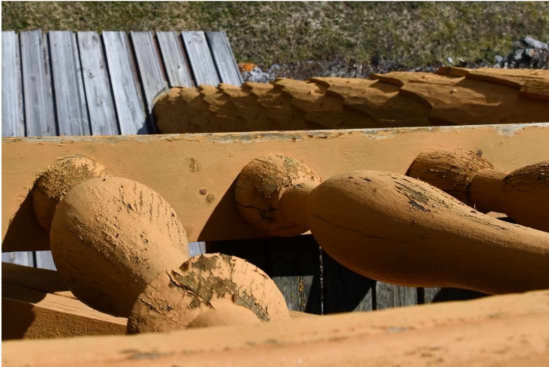
Figur 7 Del av balustrad före åtgärd. Färgen flagade delvis och begynnande röta förekom på flera av balusterdockorna.