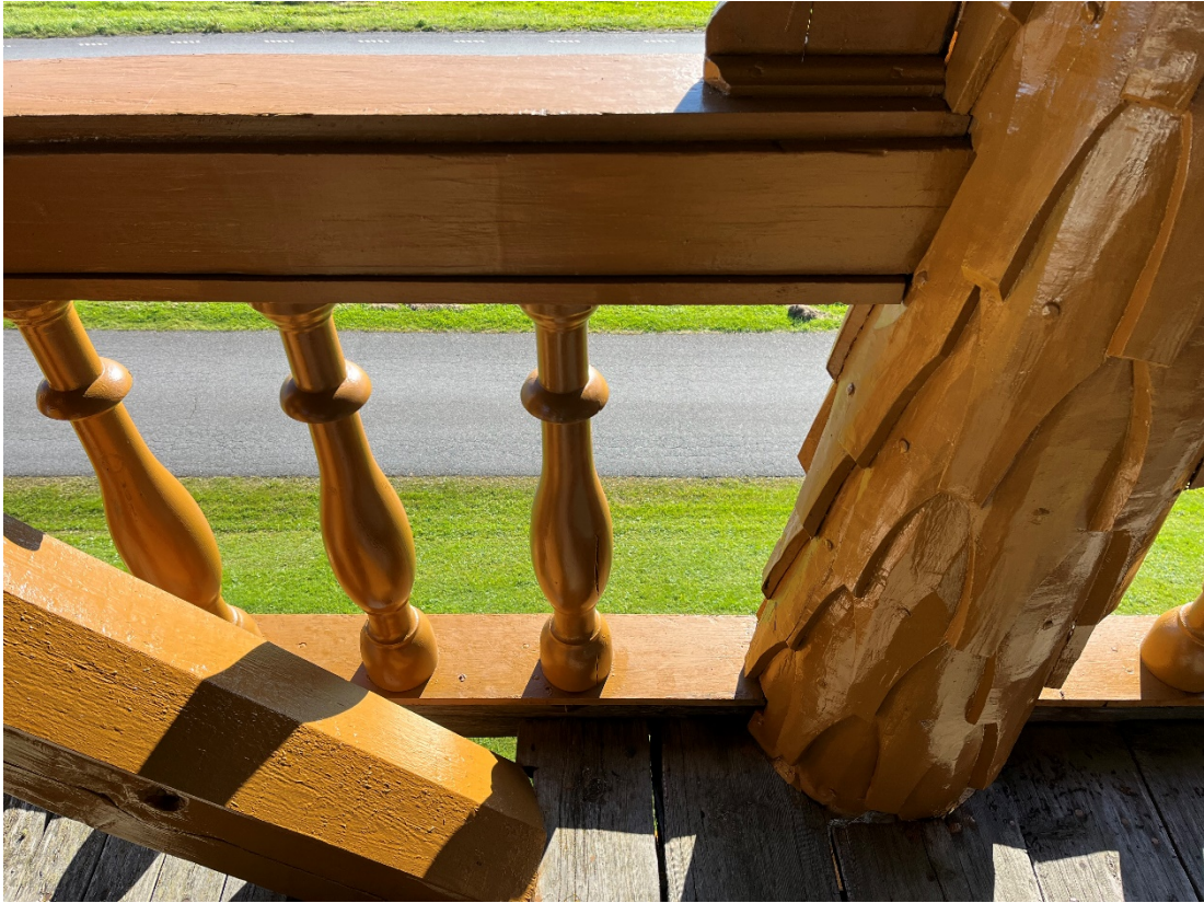
Figur 11 Balustrad efter åtgärd.