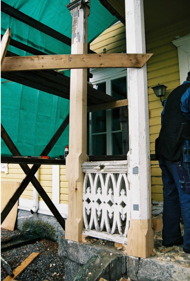
Bild 10. Stolpe 2 och 3 ilagades halvt i halvt och bultades (neg nr 07M004/

Stolpe 3 har ilagats med bladskarv ca 80 cm från golvnivå.