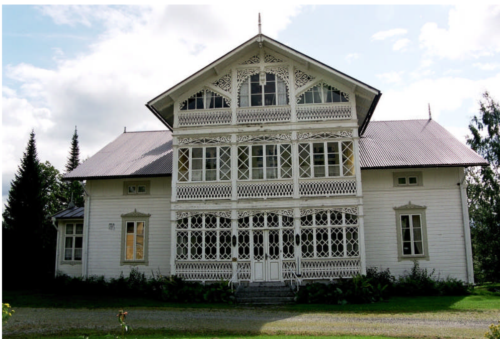
Bild 2. Gårdsfasaden på boningshus I år 2003 när åtgärdsförslaget gjordes (neg nr 03M115/34).