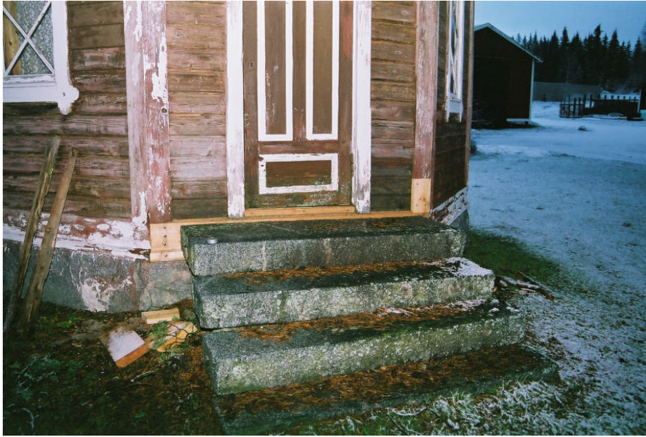
Bild 13. Lagningar av sockelbrädan och knutbrädan vid dassets A-vägg (neg nr 07M004/25).