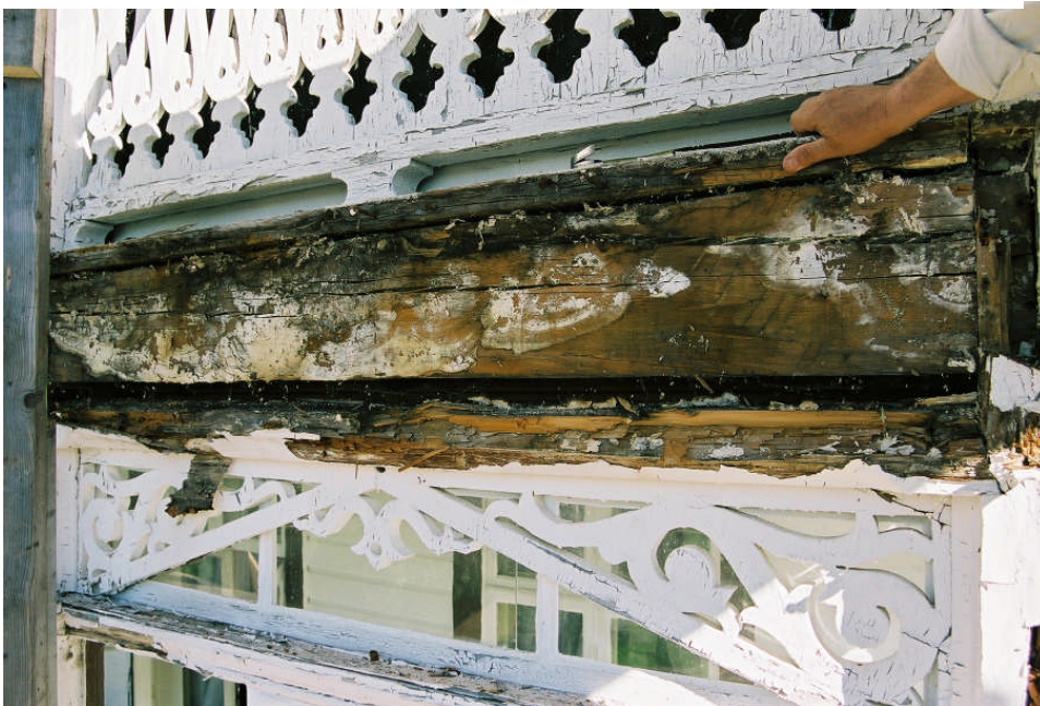
Bild 8. Den bärande yttre bjälken i mellanbjälklaget efter att dekorbrädan avlägsnats mellan stolpe 1 och 2. Bjälken var mycket rötskadad och måste bytas.