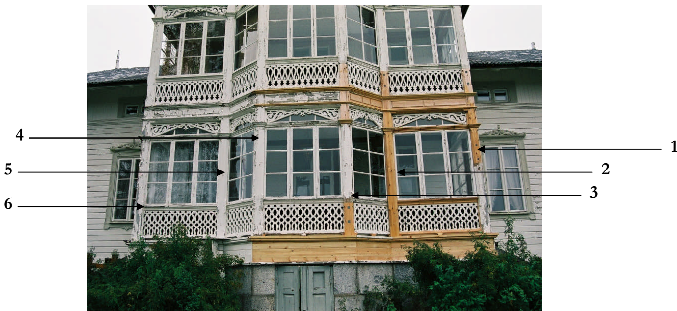
Bild 4. Ilagningar i verandan på C-väggen med stolparna numrerade (neg nr 06M072/11).

C-vägg Sex fristående stolpar bär upp C-väggens veranda. De står i bottenvåningen på ett yttre ramverk av trä som är kvar från den ursprungliga konstruktionen. Innanför träramen är golvet gjutet.