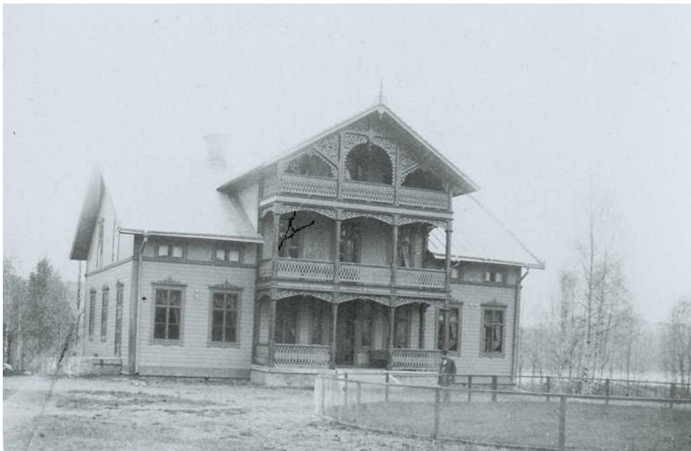
Bild 1. Fotografi av huvudbyggnaden, boningshus I, år 1891 innan verandorna glasades in och köksentrén byggdes. De två fönsteraxlarna på båda sidor om verandan byggdes även om till en.