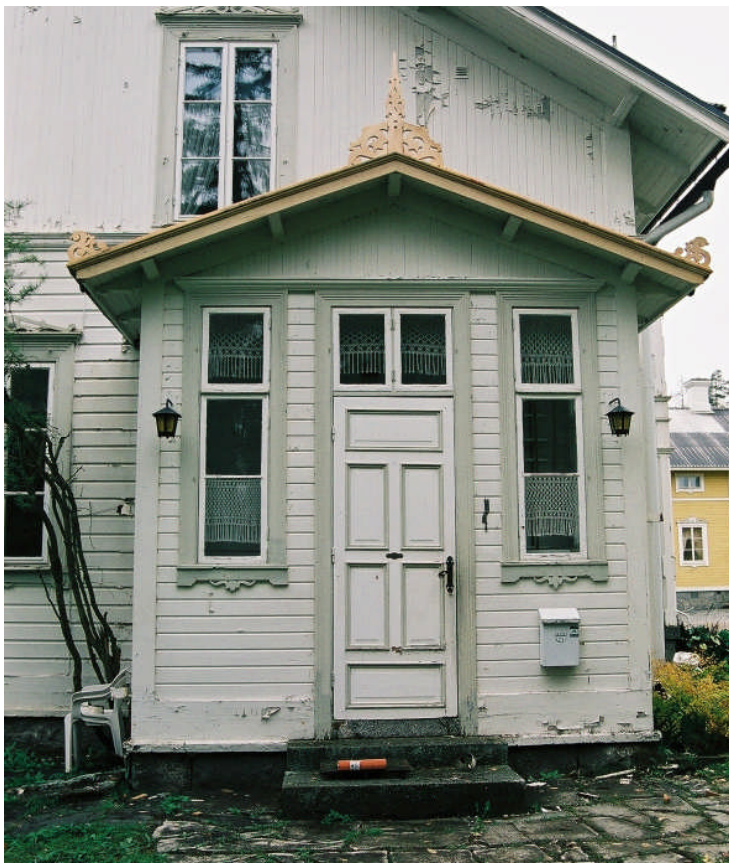
Bild 3. Köksingången på B-väggen med nytillverkat lövsågeri, vindskivor, överliggare och hålkäl (neg nr 06M072/25, något beskuren). Stuprören är ännu inte monterade.

B-vägg De tre lövsågerier som kröner köksingångens tak har nytillverkats och vindskivor, överliggare och hålkäl är utbytta vid takfoten. Nya stuprör har tillverkats med de gamla som förlaga.