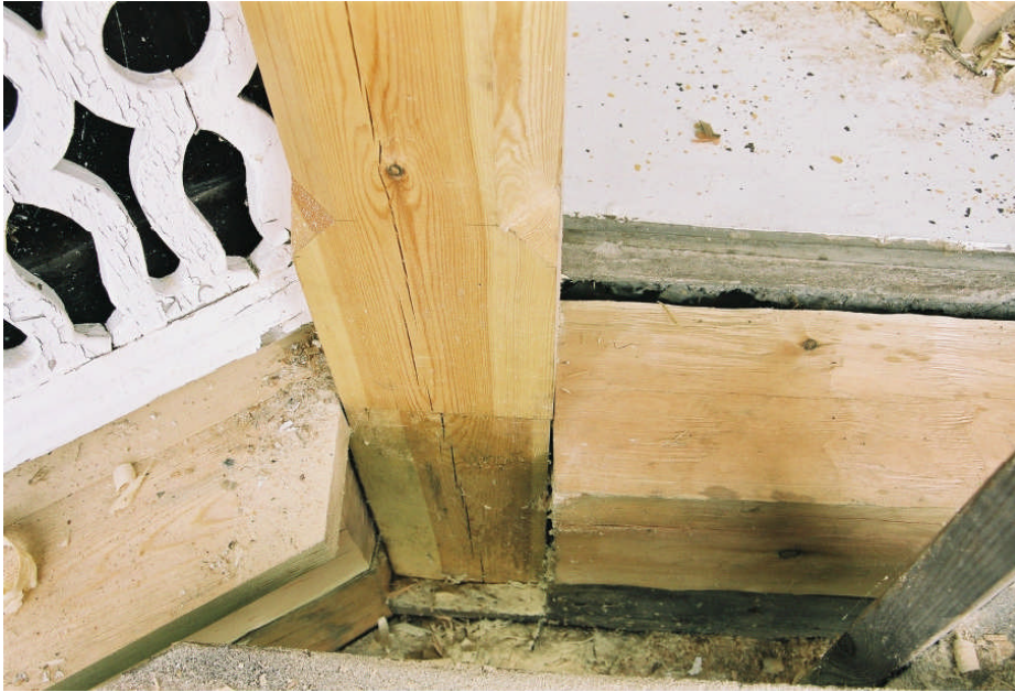
Bild 5. Stolpe 2 ilagades och kubben som stolpen står på byttes ut. Till höger om stolpe 2 syns den utbytta bjälken som ligger ovanpå den nedre syllen. Mellan stolpe 2 och 3 fick både syllen och bottenbjälken bytas eftersom båda var kraftigt rötskadade. Innanför syns det gjutna golvet.

I bottenbjälklaget har den övre bottenbjälken bytts ut mellan stolpe 1 och 2. Mellan stolpe 2 och 3 har både bottenbjälken och den undre syllen bytts eftersom den var delvis borttrötad (se bild 5 nedan).