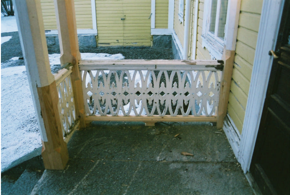
Bild 11. Ilagningar på verandan vid A-väggen. Stolpe 1 är spikad mot A-väggen. Räckesunderliggaren mellan stolpe 1 och 2 är utbytt liksom klossen under räckesunderliggaren (neg nr 07M004/20).

2 st golvplankor i den yttre frisen på verandans andra våning mellan stolpe 1 och 2 och listen i underkant är utbytt (bild 11).