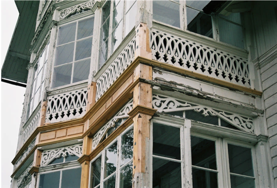
Bild 9. Här syns bl.a. bladskavningen av stolpe 1 och listen ovanför dekorbrädan som byttes mellan ytterväggen och stolpe 1.

Likasa byttes listen ovanfor dekorbradan pa andra vanningen mellan yttervaggan och stolpe 1 liksom mellan stolpe 6 och yttervaggan (se bild 8).