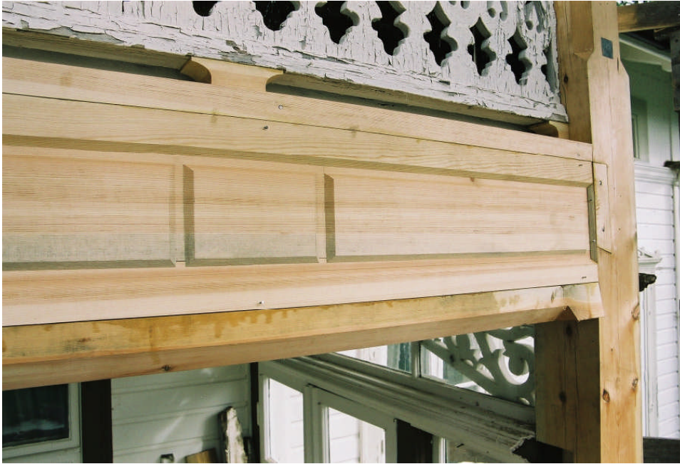
Bild 7. I mellanbjälklaget täcktes de bärande bjälkarna av dekorbrädor. Detta är dekorbrädan mellan stolpe 1 och 2. Den övre och under listen har inte monterats ännu.