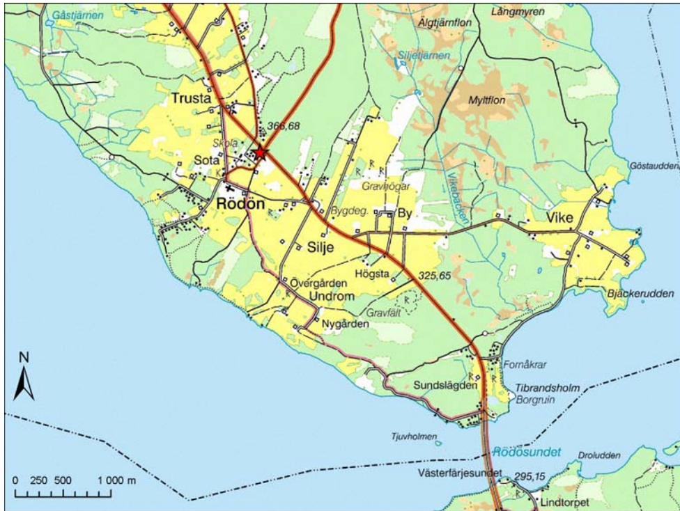
Figur 2. Karta över Rödön. Platsen för utredningen är markerad med en stjärna.