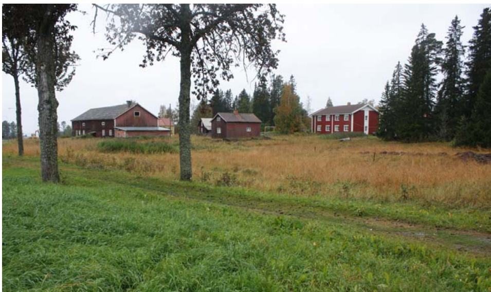
Figur 1. Den norra delen av utredningsområdet, fotograferat mot SV.

Inledningsvis gjordes en genomgång av äldre kartmaterial för att kartlägga områdets markanvändning under historisk tid. I fält avsåg man att undersöka ytan genom schaktgrävning på de planare delarna av utredningsområdets ängsmark. Schakten mättes in med GPS (figur 4). De syftade till att ta bort matjordslagret för att exponera äldre markytor som inte har påverkats av modern markanvändning. Ett mindre skogsområde är relativt kuperat och bedömdes därför som mindre lämpligt för äldre bosättning. Skogsområdet avsåg man att undersöka med okulär besiktning med jordsond.