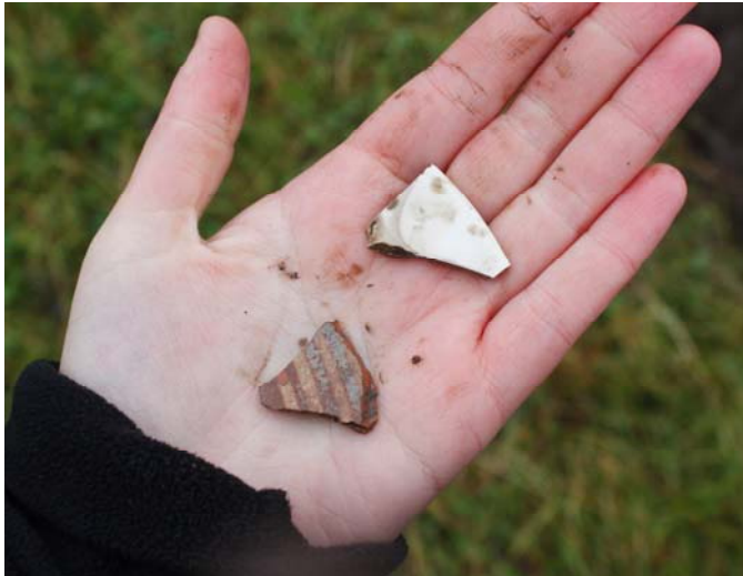
Figur 7. Skärvor av porslin och keramik från den södra delen av utredningsområdet.