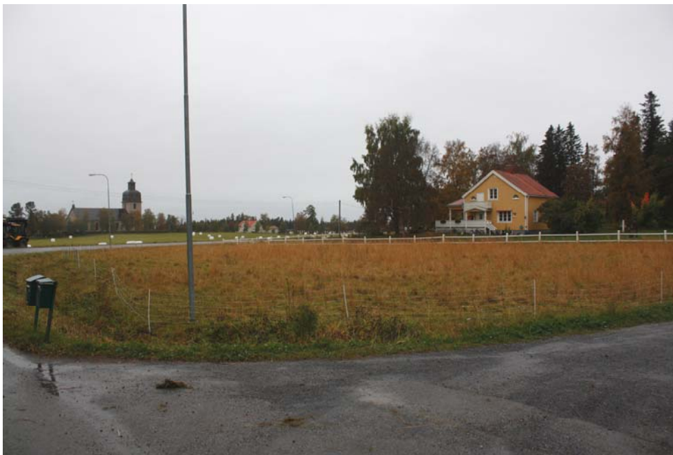
Figur 5. Den södra delen av utredningsområdet, fotograferat mot SV. I bakgrunden syns Rödö kyrka.