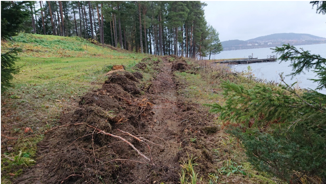
Figur 2. Det långa schaktet sett från SÖ.

Med hjälp av en mindre bobcat och en 50 cm skopa togs ett 1m brett och 37 m långt schakt upp i anslutning till slänten ner mot sjön då detta bedömdes vara den plats där det var störst sannolikhet för att återfinna en blästplats. Från huvudschaktet togs tvärgående mindre utlöpare, 1–2 m långa, upp på sex ställen. Schakten var 1–2 dm djupa och togs upp ner till opåverkad mark.