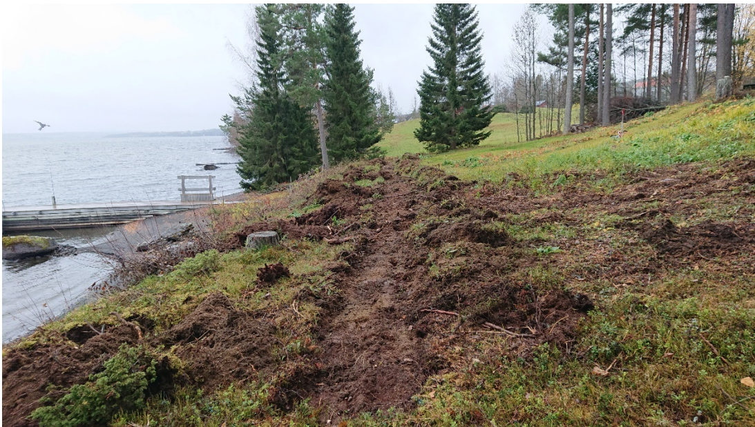
Figur 3. Det långa schaktet sett från NV.

Inga rester efter en blästplats fanns i de upptagna schakten.