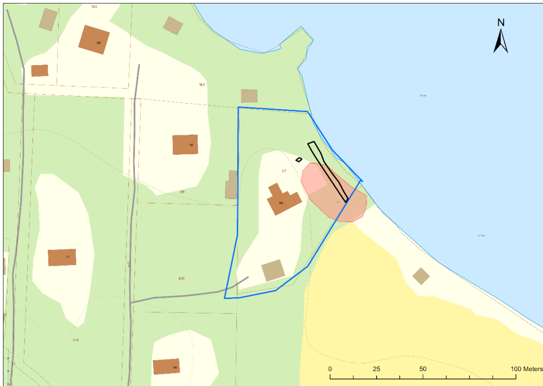
Figur 4. Översiktskarta. Utredningsområdet merkerat med blå polygon, schakten med svart polygon och registreringen i Kulturmiljöregistret med rött.