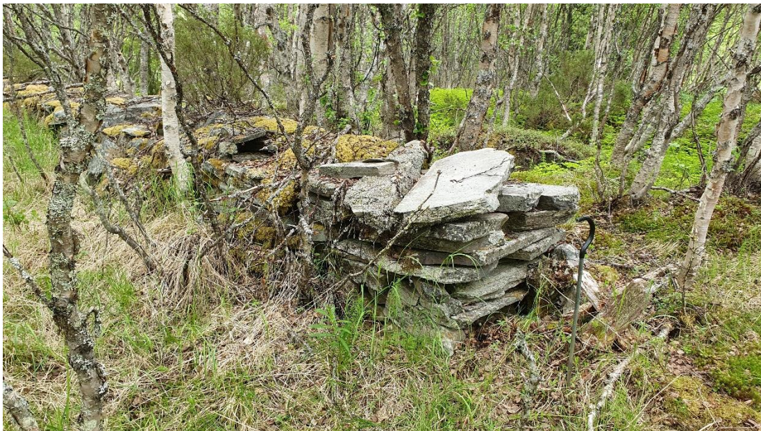
Fig. 2. Lämningensnummer: L2022:4449, hägnad.

Alla tre lämningar ligger i anslutning till byn Flon. Eftersom lämningarna nu är kända bör det gå att undvika att de skadas vid kommande markingrepp.