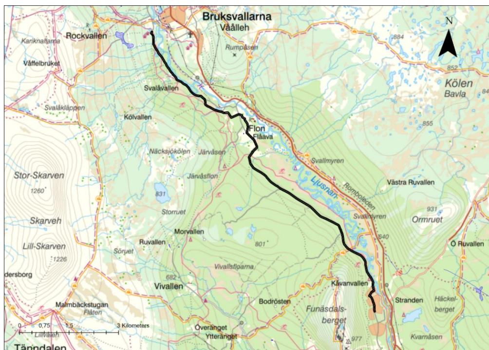
Fig. 1. Översiktskarta med utredningsområdet markerat med svart geometri.

Då utredningsområdet till stora delar ligger utefter befintlig väg eller skoterled är området relativt lättillgänglig. Delar av sträckningen går över våtmarker där det är låg sannolikhet att hitta lämningar.