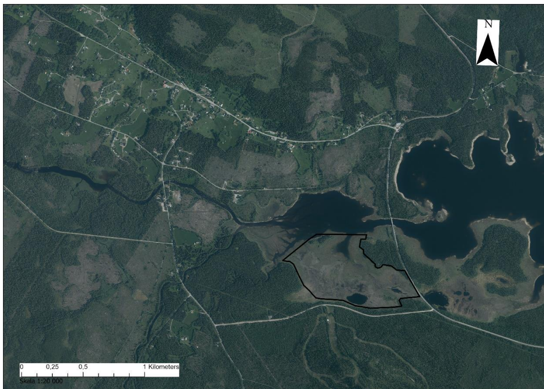
Fig. 2. Översiktskarta med utredningsområdet markerat med svart begränsningslinje. I flygbilden går det att se det överdämda området som ska omvandlas till permanent våtmark.

Utredningen genomfördes så som beskrivits i förfrågningsunderlaget och metodavsnittet förutom att det inte behövde grävas några provgroppar.