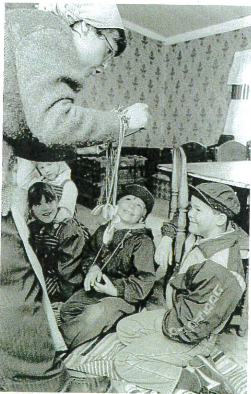
Barn och vuxna får nya namn och roller.

etablera den första nära kontakten med den grupp som vi ska tillbringa de närmaste timmarna med. Att snabbt kunna avläsa gruppen och känna av vilka behov som är viktiga för just de här barnen är ett krav som ställs på oss som leder tidsresan. Det måste få ta sin tid, alla barn måste få bli sedda och uppmärksammade på sitt eget sätt. Om man försöker stressa på för att få den