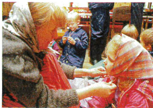
Namnbyte och påklädning måste få ta en stund – ett bra tillfälle att etablera en kontakt med barnen.

Den här delen av tidsresan kan utifrån sett verka lite kaotisk och rörig. När alla ska få sina nya leknamn och påklädningen pågår som bäst är det en sprallig och förväntansfull stämning. Eftersom de flesta barnen som kommer till oss är helt nya bekanskap är det här en viktig stund för oss att