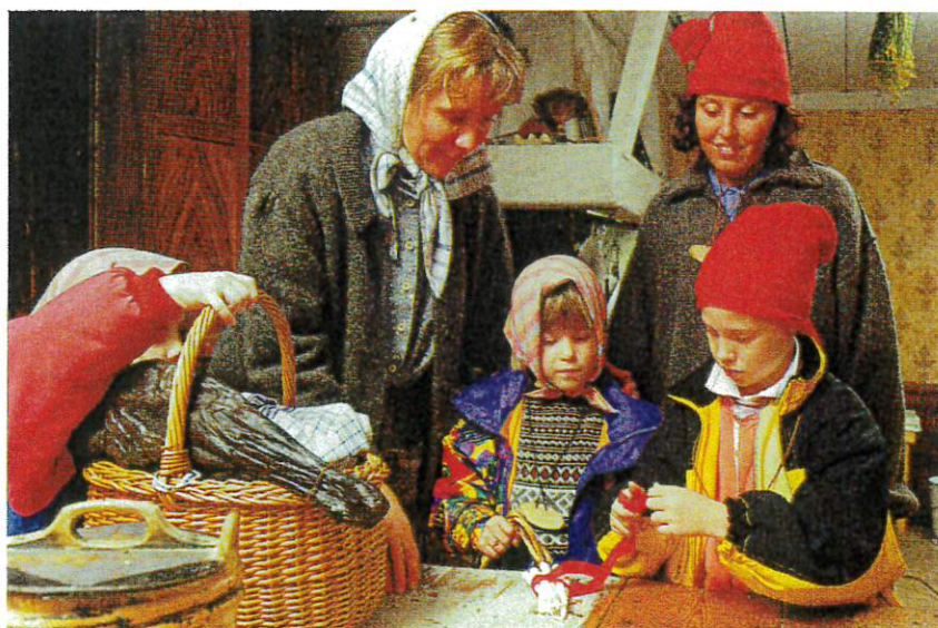
Korgen packas till Skomakar-Stina.

Barnen funderar och tillslut kommer man på