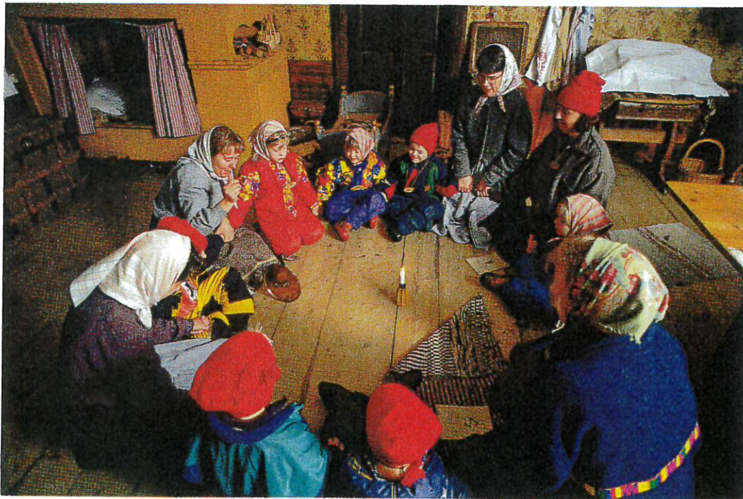
Blunda och håll varandra i händerna, nu är det dags att ställa om tiden!

Barnen nickar och blundar. Mor Sofia viskar än en gång till locket att det ska ta dem till förr i tiden. Hon sätter locket i ringens mitt och snurrar det. Barnen kniper ihop ögonen och håller