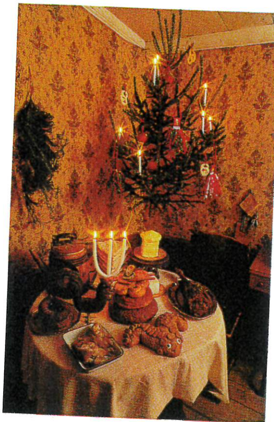
Julstämning i Hackåsgården.

Barnen bär tillsammans ut korgen till den vänande mjölksläden. Så bär det iväg till Skomakarns.