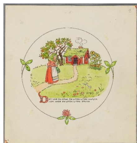
Sagan om den lilla, lilla gumman , illustration 1, 1950, Akvarell, blyerts, bläck, 32x31 cm, Nationalmuseum