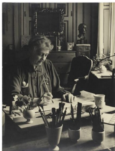
Elsa Beskow.

Elsa Beskow var både författare och illustratör – hon målade bilder till sina berättelser och sagor. Hon föddes 1874 i Stockholm. Att barn mådde bra, hade roligt och lärde sig mycket av hennes böcker var viktigt för Elsa. Många läser hennes böcker än idag trots att de skrevs och ritades för över 100 år sedan. Elsa Beskow dog 1953.