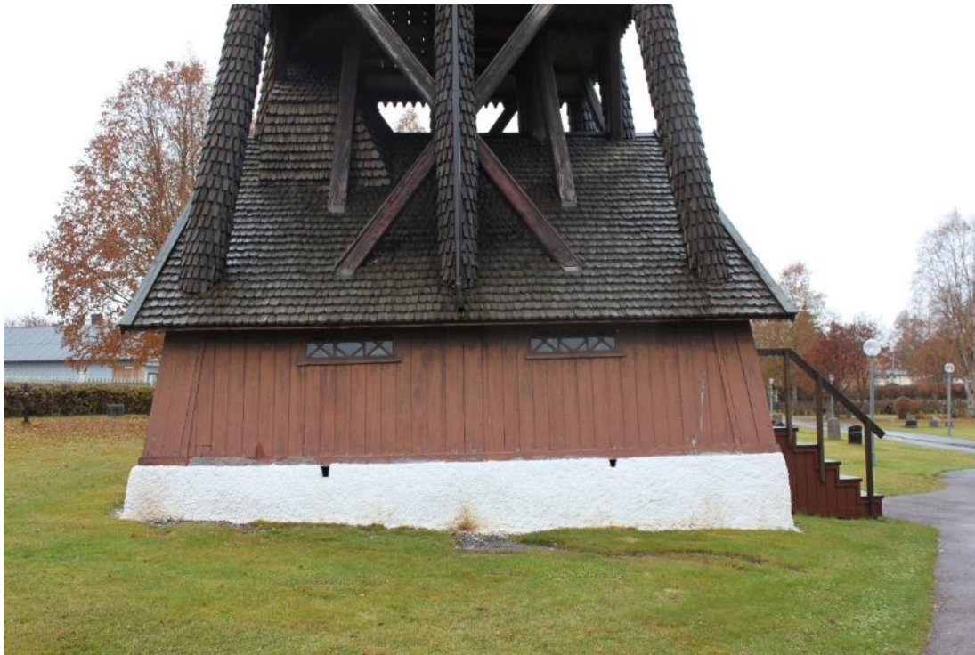
Figur 8 V ägg B före åtg ärd.