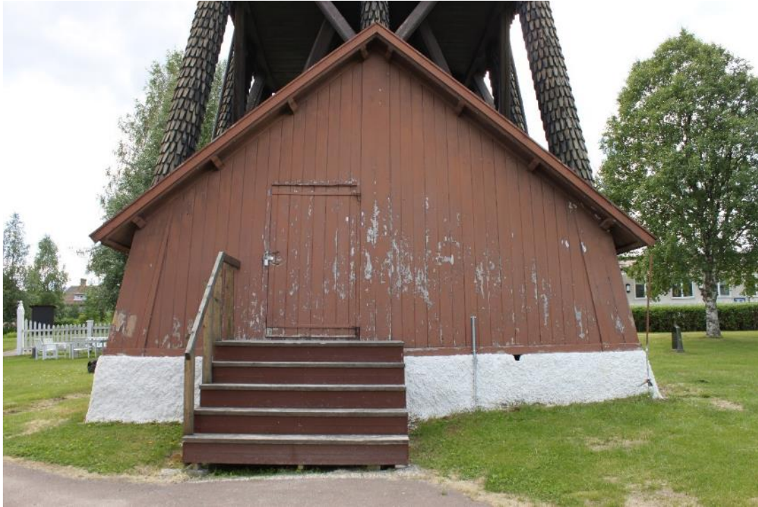
Figur 6 V ägg A före åtg ärd.