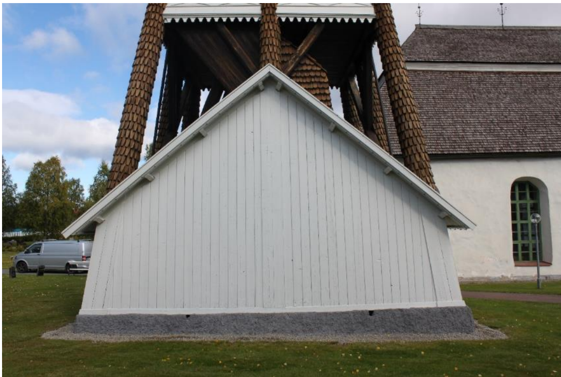
Figur 11 Vägg C efter åtgärd 2020.