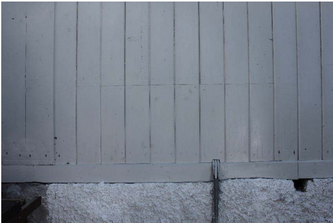
Figur 17 A-vägg efter åtgärd.