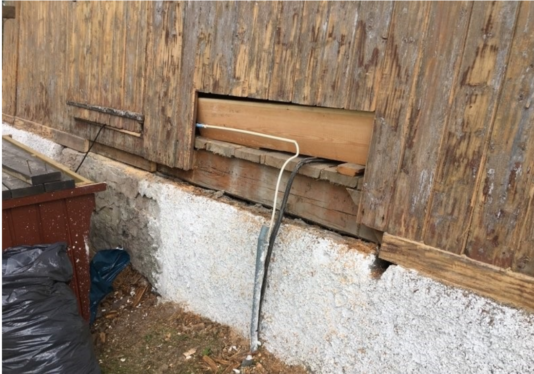
Figur 16 På A-väggen har den nedre delen av åtta panelbrädor kapats och förnyats.