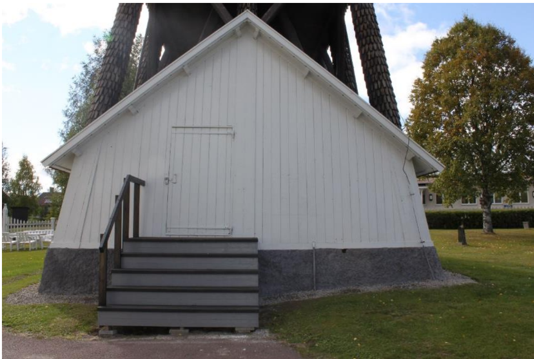
Figur 7 V ägg A efter åtg ärd 2020.