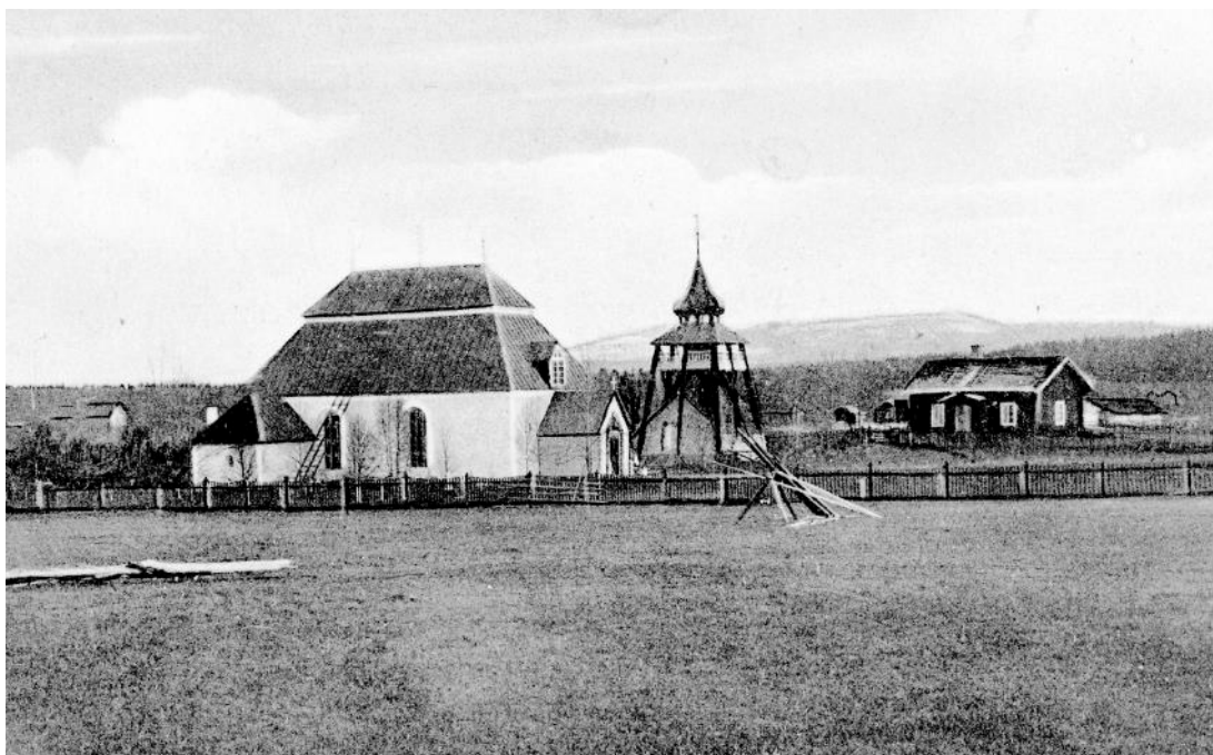
Figur 2 Hede kyrka efter 1890-talets ombyggnad av klockstapeln. Bilden är beskuren (JLM Ejneg 11986)

År 1933 finns kyrkoräkenskaperna kostnader för reparation av klockstapeln och 1934 för utvändig målning av kyrka och stapel. Plåttaken på kyrkan och klockstapeln målades då med svart färg i stället för den mönjeröda färg som de hade tidigare. År 1941 återfinns en kostnad för underhåll av klockstapel och 1952 för målning av kyrktaket och stapeln. År 1954 tog arkitekt Lennart Haking fram ett restaureringsförslag för kyrka och klockstapel. Enligt detta tänktes plåtavtäckningen på lökkupolen ersättas med spån och tak över klockboden med lockpanel. Även bodens väggar skulle täckas med spån. Man tänkte också ersätta det vitmålade träskranket med ett nytt skydds-räcke av smidda järntenar. Restaureringsarbetena på Hede klockstapel kom att genomföras först i början på 1970-talet. Då efter ett restaureringsförslag av arkitekt Hans Jäderberg, K-konsult. Både kyrkan och klockstapelns tak var fram till sommaren 1970 belagda med målad plåt. Kyrktaket och övre delen av klockstapeln och stolparna kom 1970-71 att täckas med spån. Hängrännor och stuprör av koppar monterades på stapeln. Luckorna under kupolen beslogs först med galvplåt men kom sedan att ersättas med nya luckor i stället.