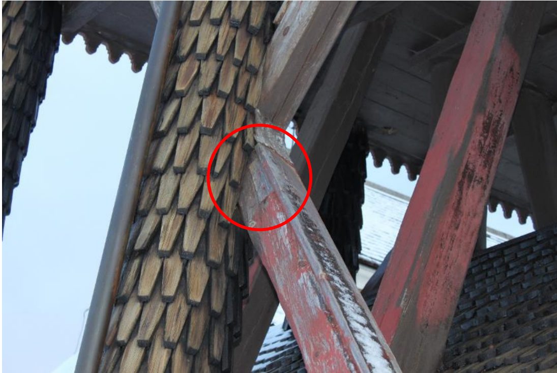
Figur 20 Krysstagen hade före åtgärd spår av röd färg som flagnat. På D-väggen fanns en gammal lagning på krysstaget.