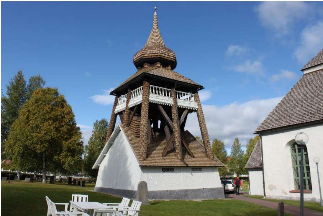
Figur 5 Hede klockstapel efter åtgärd 2020.