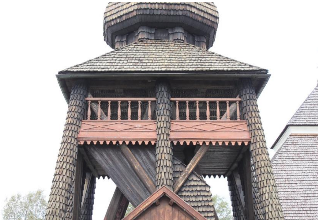
Figur 14 Balustrad före åtgärd.