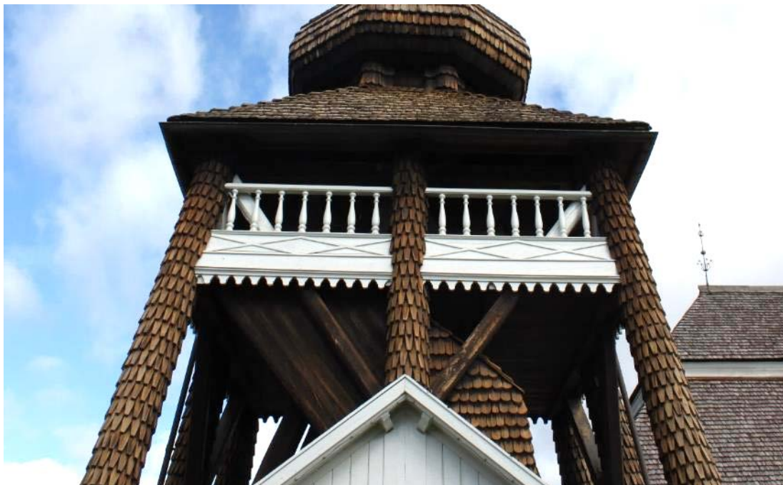
Figur 15 Balustrad efter åtgärd 2020.