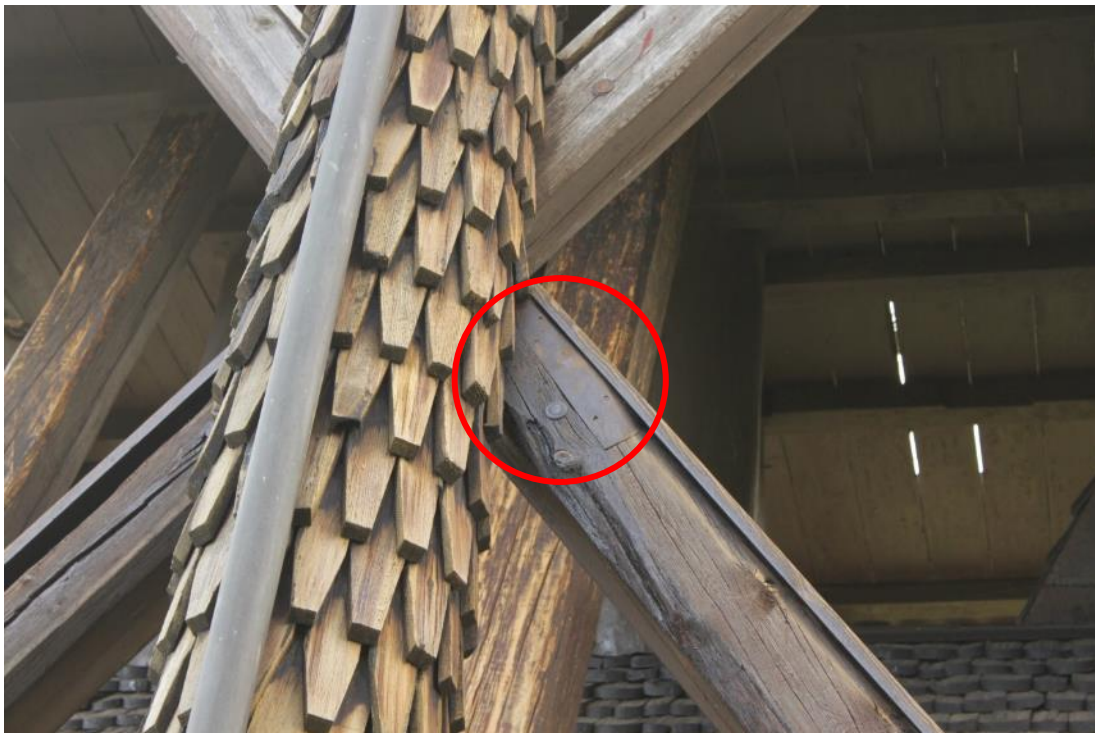
Figur 21 Den gamla lagningen på krysstag har åtgärdats.