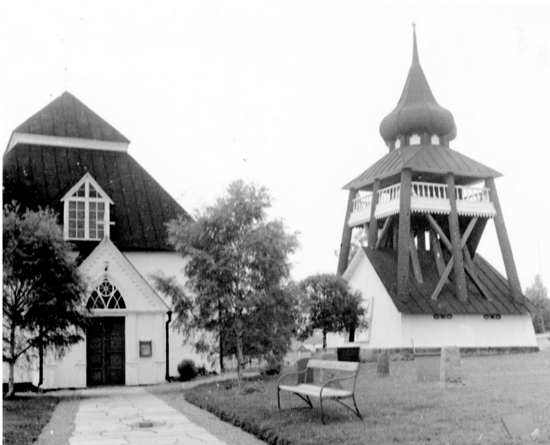
Figur 3 Kyrka och klockstapel innan 1970-talets restaurering.

År 2019 åtgärdades grunden och klockstapel tjärades. Tanken var att klockbod och övriga ej tjärade delar av stapeln samtidigt skulle målas i kulör lika befintlig. Då det från församlingen framkom önskemål om att återgå till en tidigare färgsättning av klockstapeln, kom målning av bod och klockdäckets balustrad att skjutas fram.