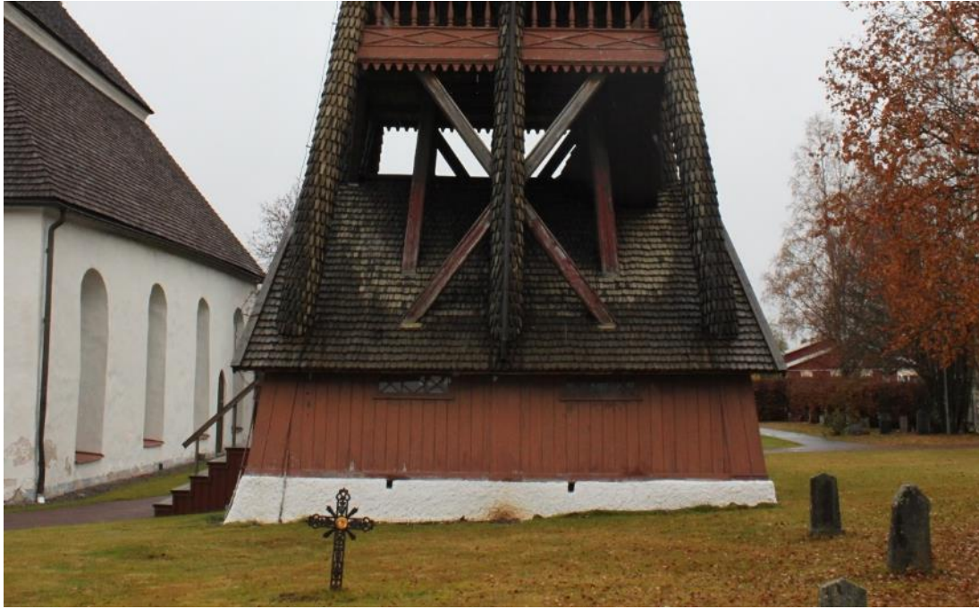
Figur 12 Vägg D före åtgärd.