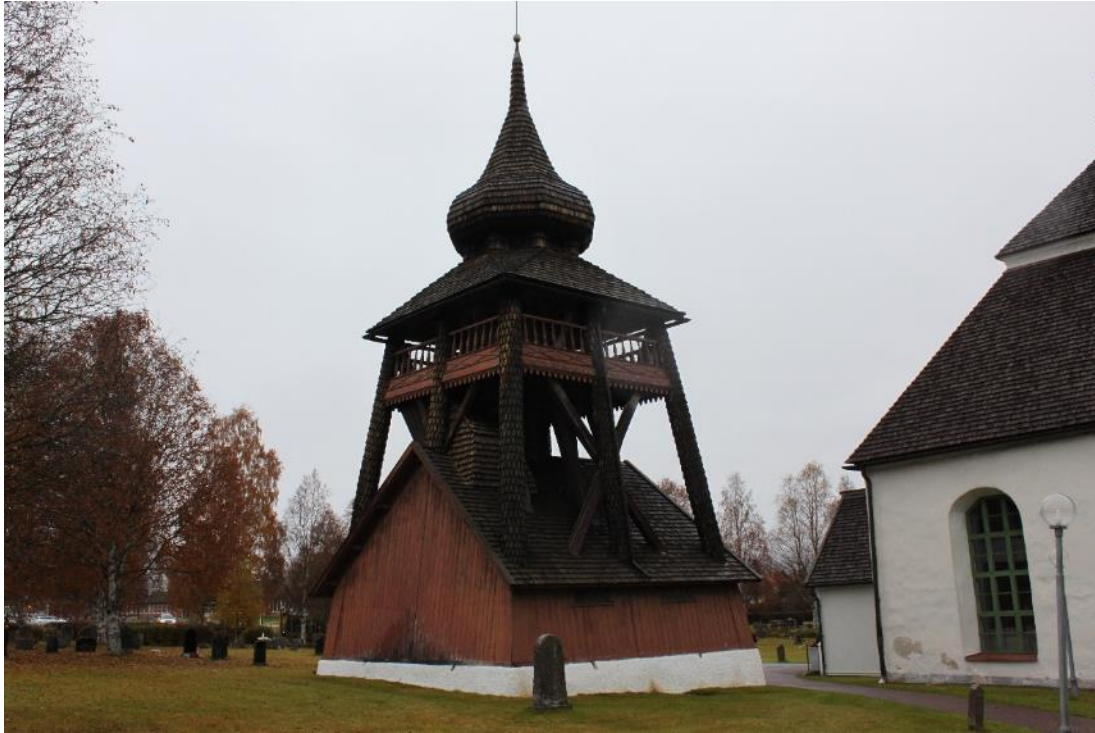
Figur 4 Hede klockstapel före åtgärd.