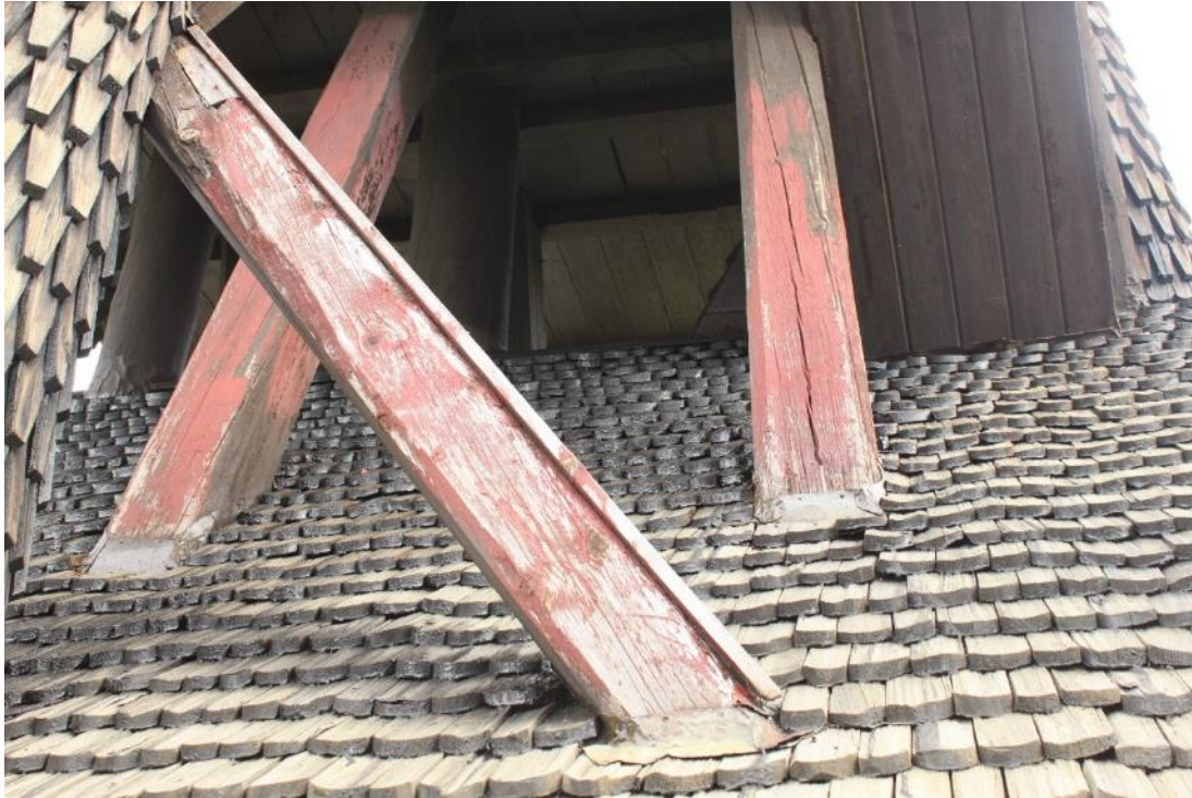
Figur 22 Genomföringen av krysstagen genom klockbodens tak var före åtgärd tätad med blyplåt. Det förekom läckage runt genomföringarna särskilt vintertid då snö lägger sig på krysstagens översida.