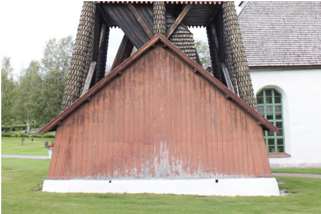
Figur 10 Vägg C före åtgärd.