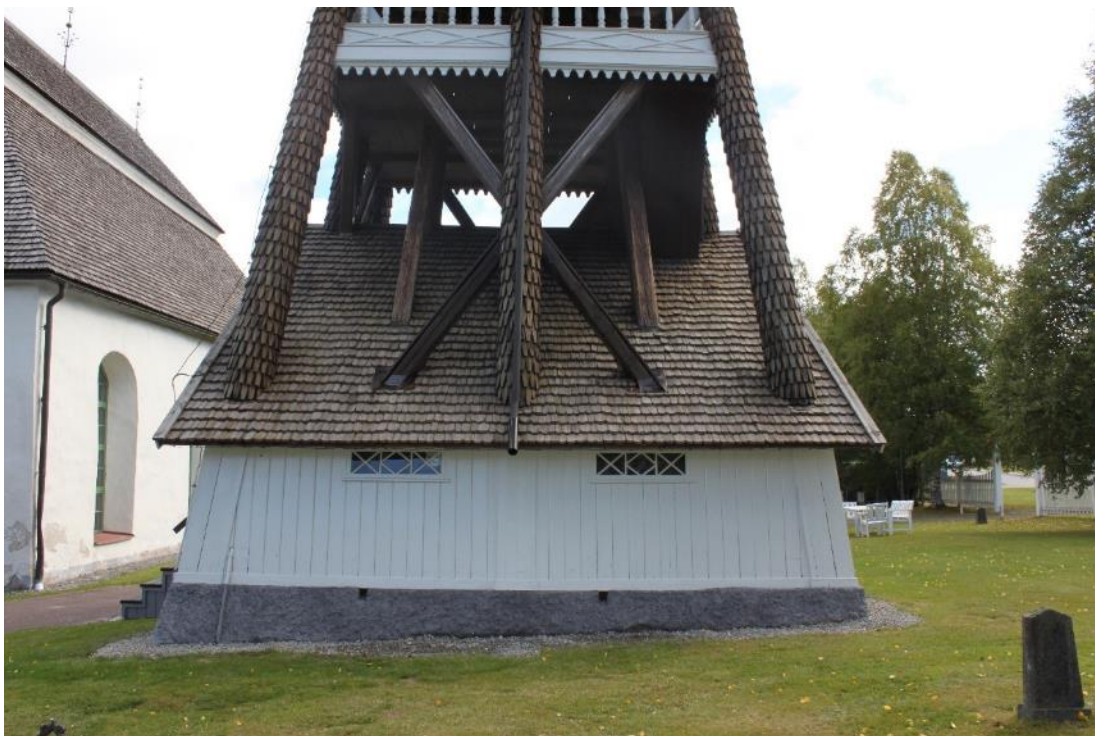
Figur 13 Vägg D efter åtgärd 2020.