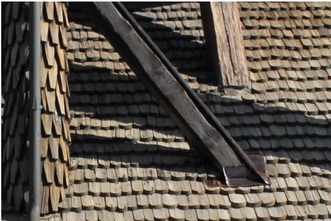
Figur 23 Avteckningen av genomföringar på krysstag har kompletterats med kopparplåt.