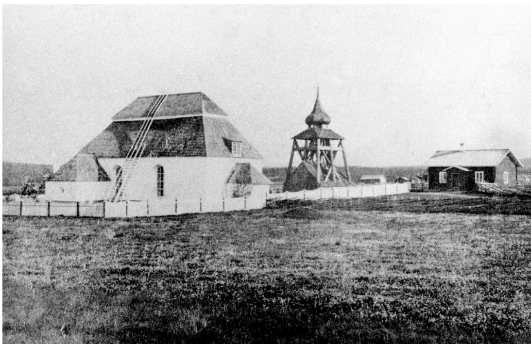
Figur 1 Hede kyrka och klockstapel innan 1890-talets restaurering.

På ett foto taget innan kyrka och klockstapel täckts med plåt, får man en bild över hur stapeln då såg ut (Figur 1). Boden var täckt med ett brädtak. Klockdäck saknade balustrad. Stapelns lökkupol och tak var, liksom taket på kyrkan, täckt med spån. På italianen framträdde luckorna i vitt mot den i övrigt mörka kupolen.