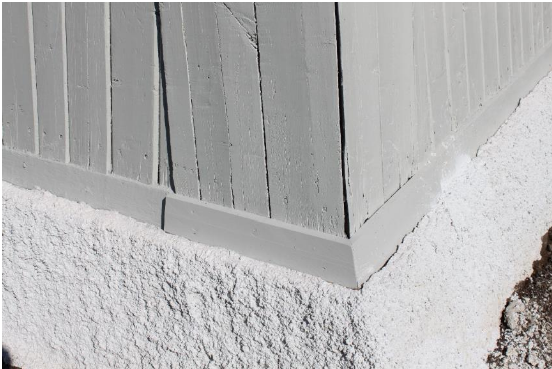
Figur 19 BC-hörn efter åtgärd (innan sockeln avfärgades).