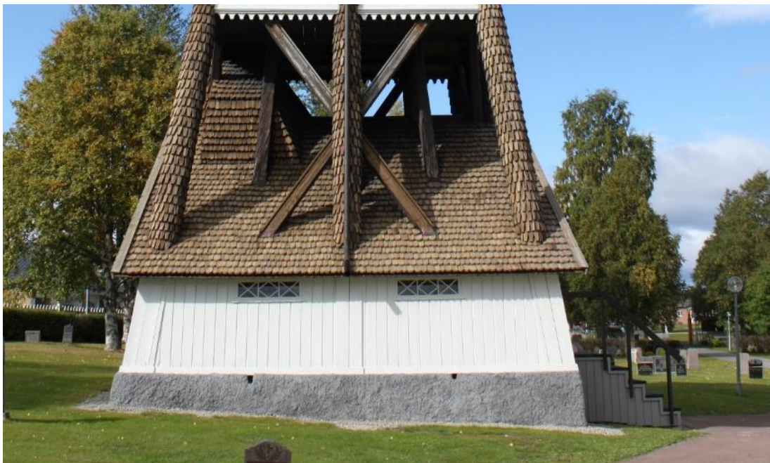
Figur 9 V ägg B efter åtg ärd 2020.