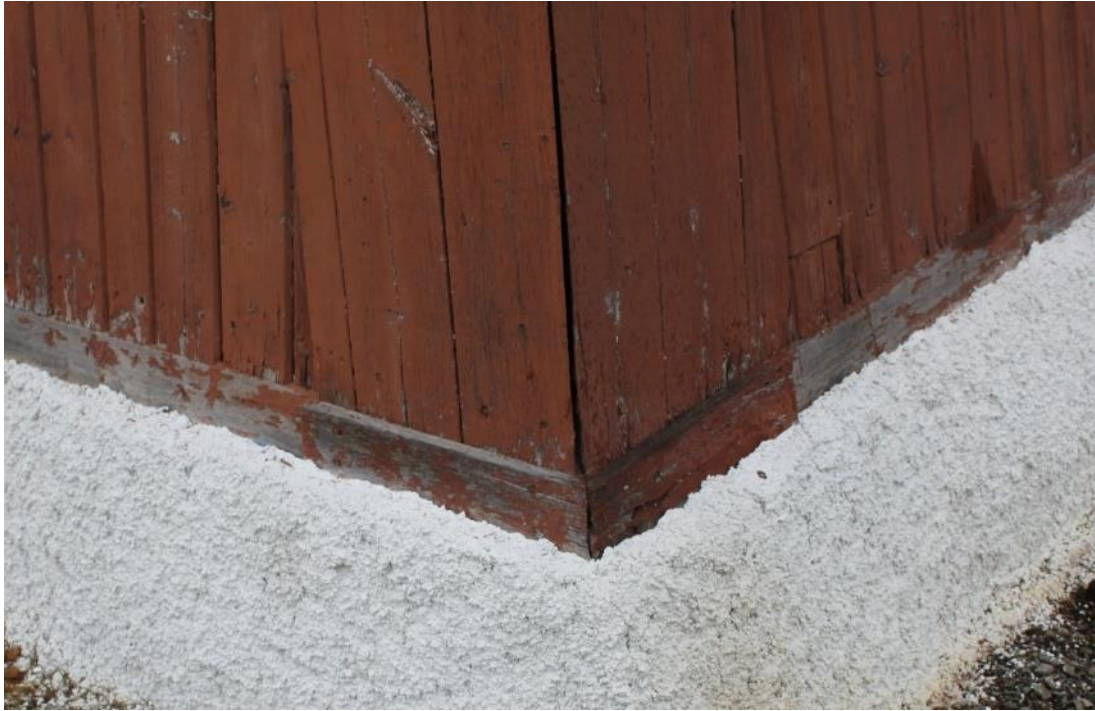
Figur 18 I BC-hörn var listen mot grunden medtagen/sprucken.