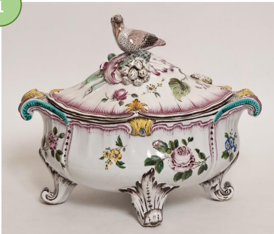
Mariebergs Fajansfabrik, Soppskål, 1760–1770