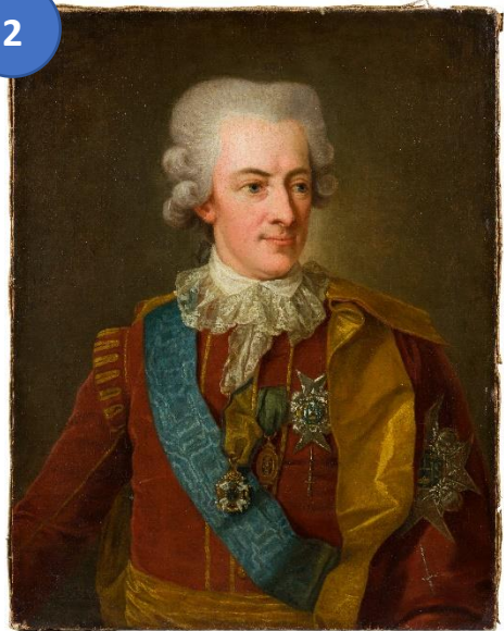
Per Krafft d.ä. (1724–1793) Gustav III (1746–1792) i Serafimerordens mindre dräkt , 1791,