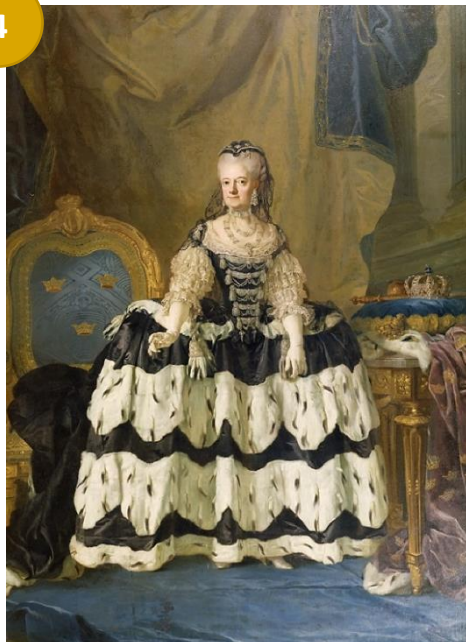
Lorens Pasch d.y. (1733–1805) Änkedrottning Lovisa Ulrika , 1775