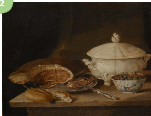
Pehr Hilleström (1732–1816) Stilleben med skinka på tennfat, fajansservis samt skål med krusbär och vinbär , 1780-tal