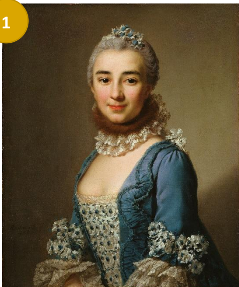
Alexander Roslin (1718–1793) Okänd kvinna, möjligen Madame Deshanges , 1753