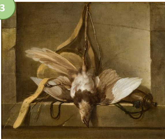
Guillaume Taraval (1701–1750) Stilleben med död fågel och jaktredskap , 1744