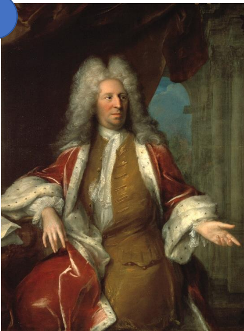
Georg Desmarées (1697–1776) Nicodemus Tessin d.y. (1654–1728) överintendent och kungligt råd , 1723