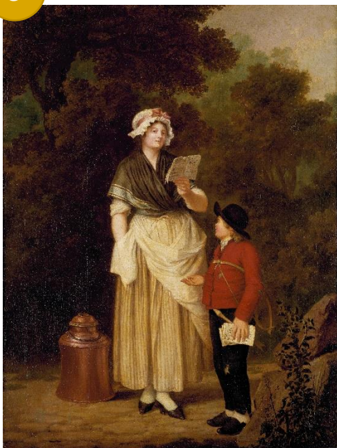
Pehr Hilleström (1732–1816) Jungfru köper en kärleksvisa , 1796