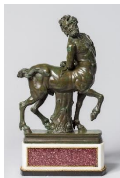
Johan Tobias Sergel har skulpterat en man som brottas med en stor fisk, i lera. Luigi Valadier har skulpterat en kejsarinna som hette Faustina, i brons. Giacomo Zoffoli har skulpterat en kentaur.

Porträtt – konstverk som föreställer en eller flera personer. Ibland ser man bara huvudet, ibland ser man hela kroppen. Ett porträtt kan göras på olika sätt – en målad tavla, en teckning, en skulptur eller ett fotografi. Om man målar av sig själv så kallas det självporträtt.