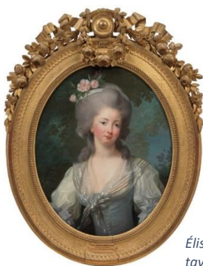
Élisabeth Vigée-Lebruns tavla har en pampig guldram

Tavla – en konstnärlig bild som hängs upp på väggen, som har en framsida och en baksida. Kan vara stora och kan var små, fyrkantiga och runda. Ofta har de en ram runt.