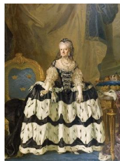
Gustaf Lundberg har målat Fredrik Axel von Fersen. Nicolas de Largillière har målat Erik Sparre. Lorens Pasch d.y. har målat Änkedrottning Lovisa Ulrika.