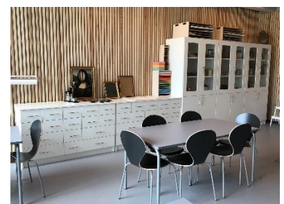
Konstateljén på Nationalmuseum Jamtli

Konstateljé – kallas det rum som konstnärer arbetar i. Här finns alla de saker som konstnären behöver, till exempel stafflier, kamera, penslar, lera, papper och färgburkar.