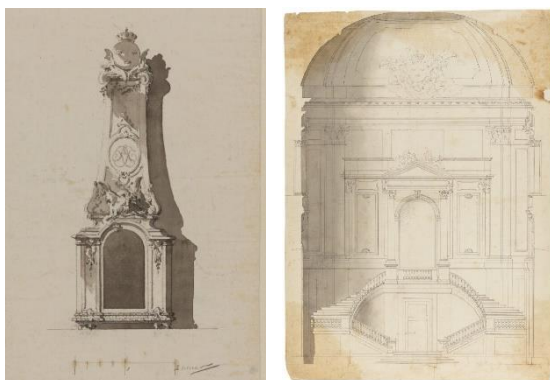
Carl Hårleman har gjort en ritning till en ny kakelugn och ritat en skiss på ett valv i det kungliga slottet.

Ritning – en teckning, skiss eller en plan över till exempel en sak, ett hus eller slott. Ritningen kan man använda sig av när man ska bygga. Ibland står det mått så att man vet hur stort eller litet det ska bli i verkligheten.