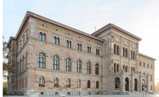
Nationalmuseum i Stockholm

Utställning – när man ordnar saker tillsammans på en viss plats. Sakerna hänger ihop på något sätt, kanske genom ett särskilt tema eller från en särskild tid.