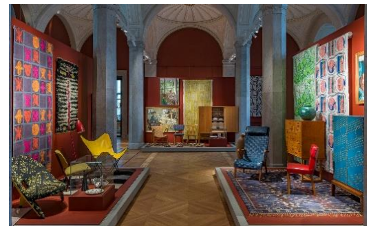
En del av Nationalmuseums utställning som handlar om design och konst från 1900-talet