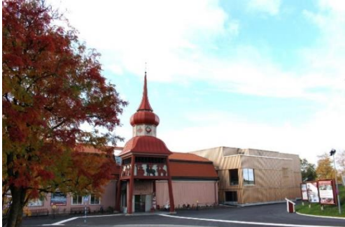
Jamtli och Nationalmuseum Jamtli i Östersund

Museum – Är i de allra flesta fall en byggnad där det finns samlingar av olika slag. Museer kan samla på konst, historiska saker, saker från naturen eller teknik. Museerna ska samla, ta hand om och visa upp sakerna för allmänheten.