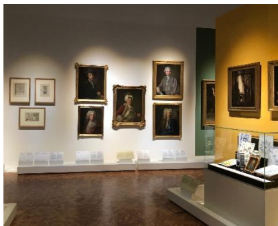
Utställningen 1700-tal – Sverige och Europa visar konst som gjordes för ca 300 år sedan.

Utställning – när man ordnar saker tillsammans på en viss plats. Sakerna hänger ihop på något sätt, kanske genom ett särskilt tema eller från en särskild tid.