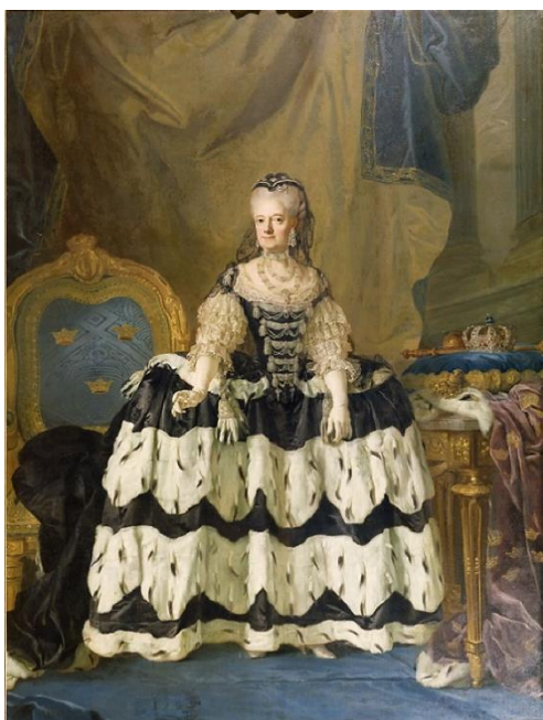
Änkedrottning Lovisa Ulrika, 1775, olja på duk, 242x178 cm, Nationalmuseum

Lorens Pasch den yngre reste vidare till Paris där han helst ville måla tavlor med historiska motiv. Men det var inte så många kunder som beställde den typen av konstverk. Många ville beställa ett porträtt på sig själva. Så