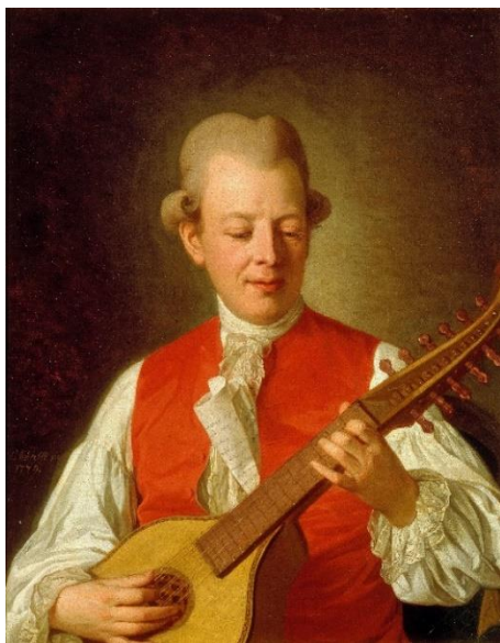
Carl Michael Bellman (1740–1795) skald, Per Krafft d.ä. (1724–1793) 1779, olja på duk, 82x66 cm, Nationalmuseum

Carl Michael Bellman föddes 1740. Han bodde i Stockholm och blev en populär person på 1700-talet eftersom han skrev roliga visor och dikter. Han var vän med kungen, spelade många instrument och hade nära till sina känslor. Han dog år 1795 men än idag sjunger vi sångerna han skrev för snart 300 år sedan.