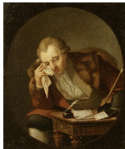
Carl Michael Bellman, Pehr Hilleström d.ä. (1732–1816) 1790, olja på duk, 40x34 cm, Nationalmuseum

En person som tyckte om Bellmans uppträdanden var kungen Gustav III. Ibland skrev Bellman om kungen i sina sånger och dikter, om hur bra kungen var. Han fick jobb hos Gustav III och blev så kallad hovskald. Skald är ett annat ord för poet. Bellman hade tyvärr lite svårt för att uppträda i de fina rummen på slotten framför den förnäma publiken, han var inte bekväm där. Han trivdes bättre på mysiga fik och krogar i stan. Men han tyckte om att få lön av kungen, eftersom han betalade bra.