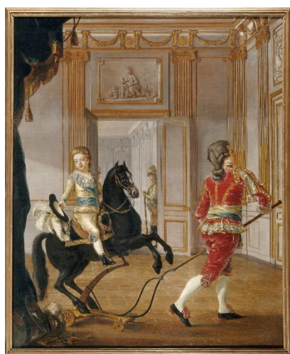
Gustav IV Adolf (1778–1837) 1784, olja på duk, 265x224 cm, Nationalmuseum.