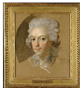
Gustav III (1746–1792) Kung av Sverige, 1787, olja på duk, 44x38 cm, Nationalmuseum