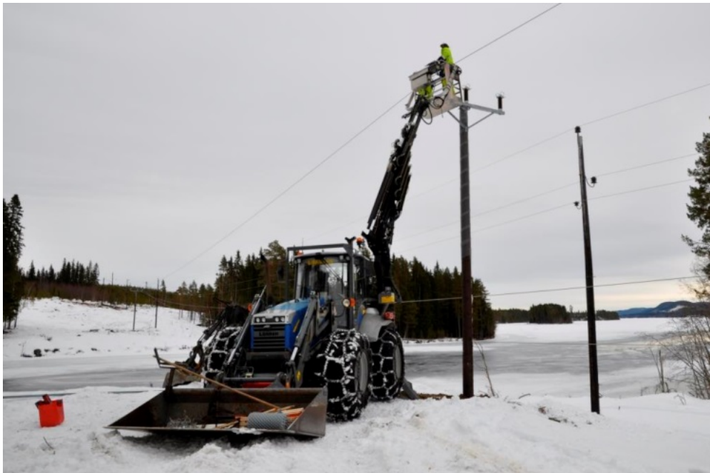
Figur 2. Stolpbyte på den V sidan av älven.

Den antikvariska kontrollen vid stolpbytena inom fastighet Rätansbyn 5:2 och Lillsved 3:1 kunde inte påvisa några fornlämningar eller kulturlager av äldre karaktär. Den typ av fynd som kan förekomma vid en stenåldersboplatser utgörs fr.a. av skörbränd sten, avslag och föremålsfynd i sten. Inga fynd påträffades dock, inte heller av sentida karaktär.