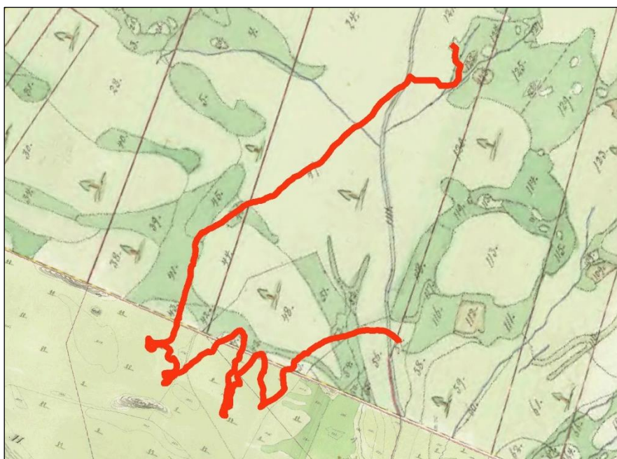
Fig. 3. Den planerade cykelledens sträckning utritad på laga skiftes kartan från 1857 (sammanläggning av två kartdelar). Kartakt Y60-3:3, Åre socken, Björnänge. Skala 1: 10 000.

Sammanfattningsvis framkom inget av antikvariskt intresse genom utredningen.