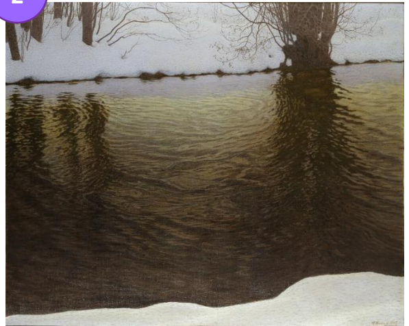
Gustaf Fjæstad (1868–1948) Vinterafton vid en älv , 1907