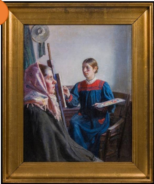
Michael Ancher (1849–1927) Anna Ancher målar efter modell , 1887