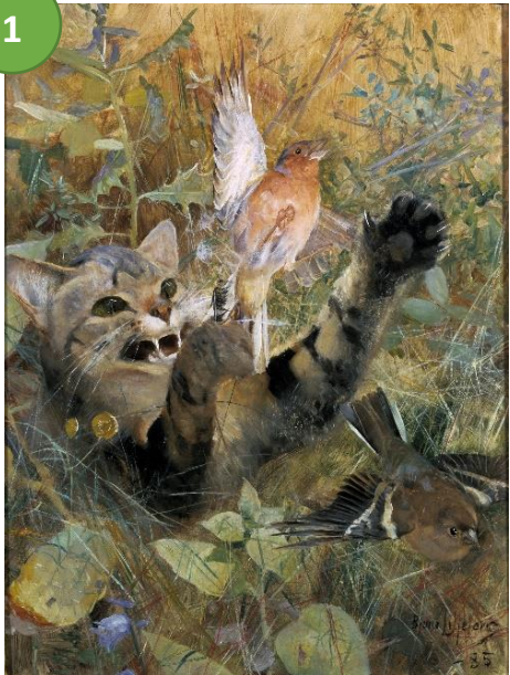
Bruno Liljefors (1860–1939) Katt och bofink , 1885