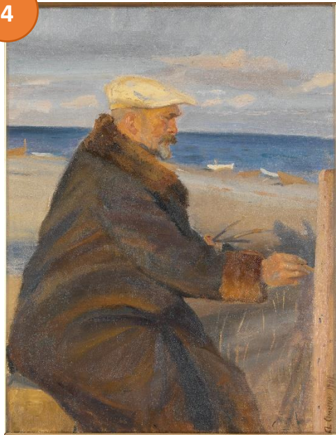
Anna Ancher (1859–1935) Michael Ancher målade på stranden , 1901