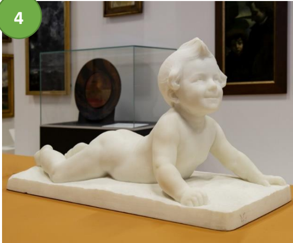
Hugo Elmqvist (1862–1930) Gryning, ett liggande barn, utan årtal