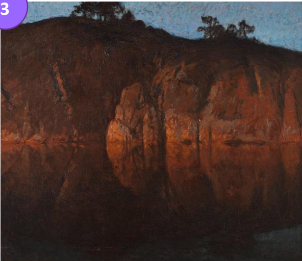
Gottfrid Kallstenius (1861–1943) Efter solnedgången. Motiv från Skärgården , 1907