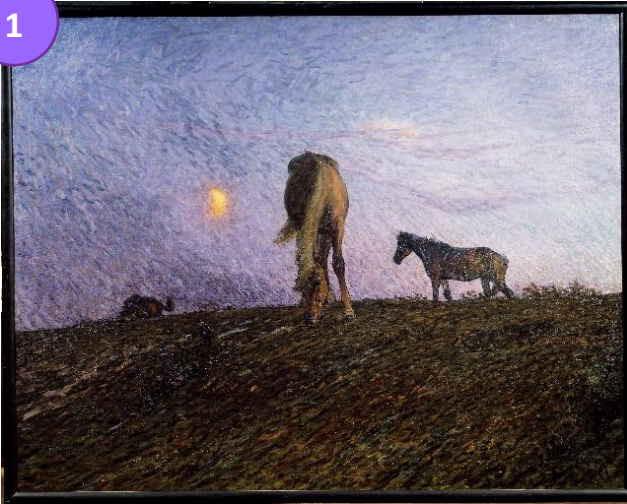
Nils Kreuger (1858–1930) Natten kommer , 1904