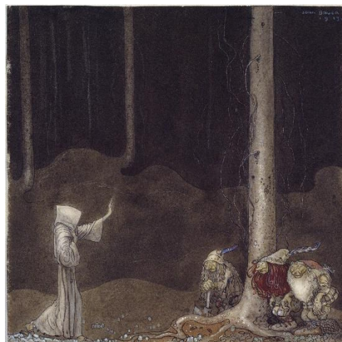
St. Martin och de tre trollen, 1913, akvarell, 25x25 cm, Nationalmuseum