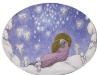
Prinsessan och trollen, 1913, akvarell, 25x25 cm, Nationalmuseum.