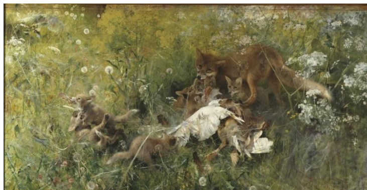
Rävfamilj, 1886, olja på duk, 112x218 cm, Nationalmuseum

Hemma i Sverige igen målade han allra helst fåglar. Det blev tjädtrar, ugglor, gäss och strandskator. Ofta är det ganska spännande motiv. Han ville måla naturen så som den var – vacker och lite hemsk på samma gång. I målningen Rävfamilj är det middagsdags, några ungar leker medan några börjar äta på en gräsand. Det var viktigt för Bruno att målningarna blev rätt – vilka blommor som blommor samtidigt och hur en storspovs fjäderdräkt exakt ser ut.