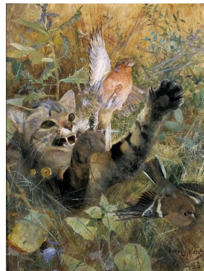
Katt och bofink, 1885, olja på trä, 35x26 cm, Nationalmuseum

Bruno Liljefors föddes 1860 i Uppsala. Han målade helst djur i naturen. Han var jägare och tyckte om friluftsliv. Han har blivit en av Sveriges mest berömda konstnärer, och många tycker om hans målningar som föreställer rävar, harar och fåglar. Han dog 1939.