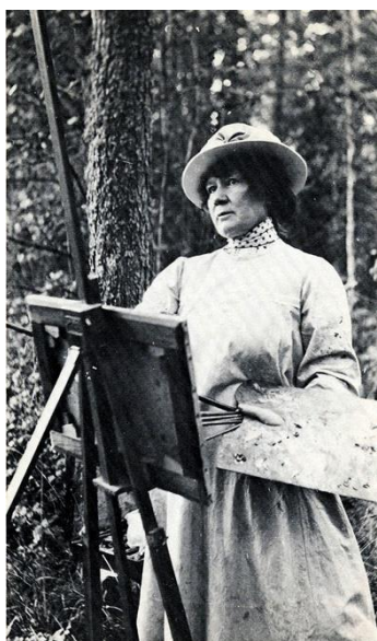
Fotografi föreställande Jenny Nyström vid staffliet

Jenny Nyström föddes 1854 i Kalmar. Hon utbildade sig till konstnär i Paris. Jenny var väldigt flitig och arbetade hårt. Hon målade, tecknade och gjorde illustrationer till tidningar. Många förknippar Jenny Nyström med tomtar. Hon målade många julmotiv som blev vykort och skickades till människor över hela världen. Hon dog 1946.