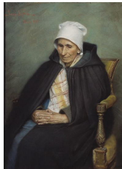
Fransk bondgumma, 1885, pastell, 77x57 cm, Nationalmuseum

När Jenny var i Paris så var det populärt att måla allt det vanliga som hände i livet. Vanliga människor som gjorde vanliga saker. Ibland var det lyckligt och fint och ibland sorgligt och hemskt. Man målade gärna naturen och morgonljuset. Stilen kallas för realism. Jenny har målat en fransk gumma från landet. Man ser att gumman är gammal och har arbetet hårt hela sitt liv. Här sitter hon i enkla men fina kläder, med knäppta händer i en stol i Jennys ateljé.