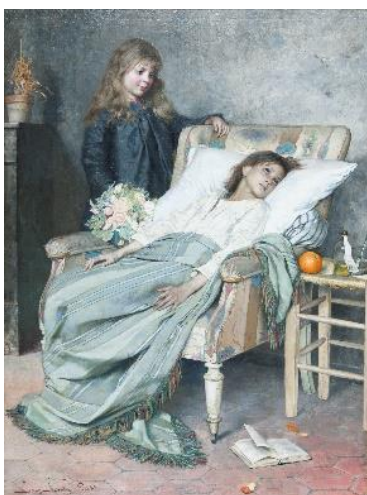
Konvalescenten, 1884, olja på duk, 154x115cm, Nationalmuseum