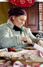
Julfrände anno 1895