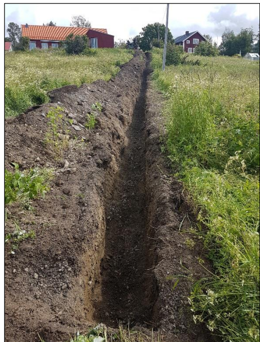
Fig. 3. Schaktet efter grävning. Foto mot nordöst av Kristina Jonsson.

Sammanfattningsvis framkom inget av antikvariskt intresse.