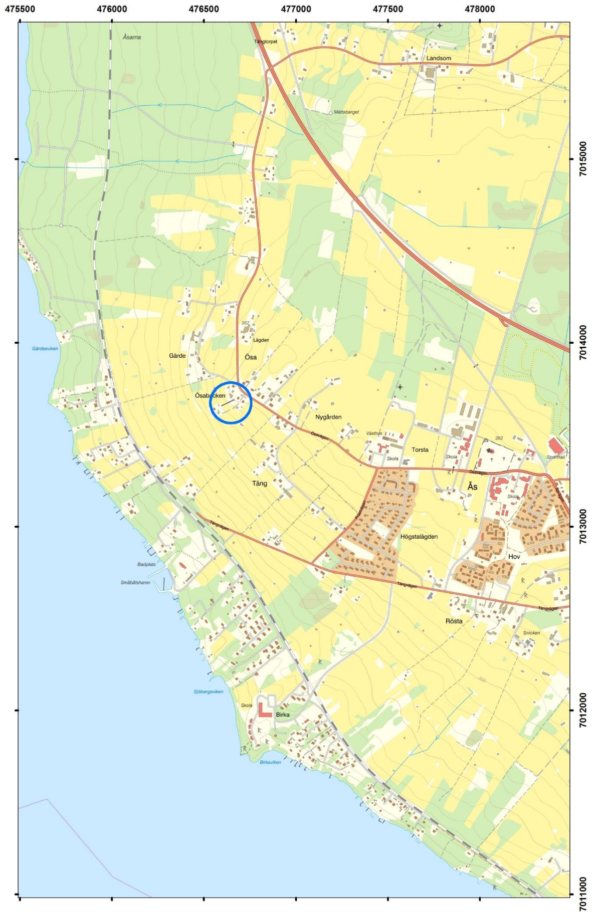
Fig. 1. Översiktskarta. Läget för schaktningen markerat med en blå cirkel. Skala 1:20 000.