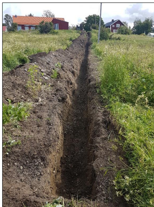
Fig. 3. Schaktet efter grävning. Foto mot nordöst av Kristina Jonsson.

Sammanfattningsvis framkom inget av antikvariskt intresse.