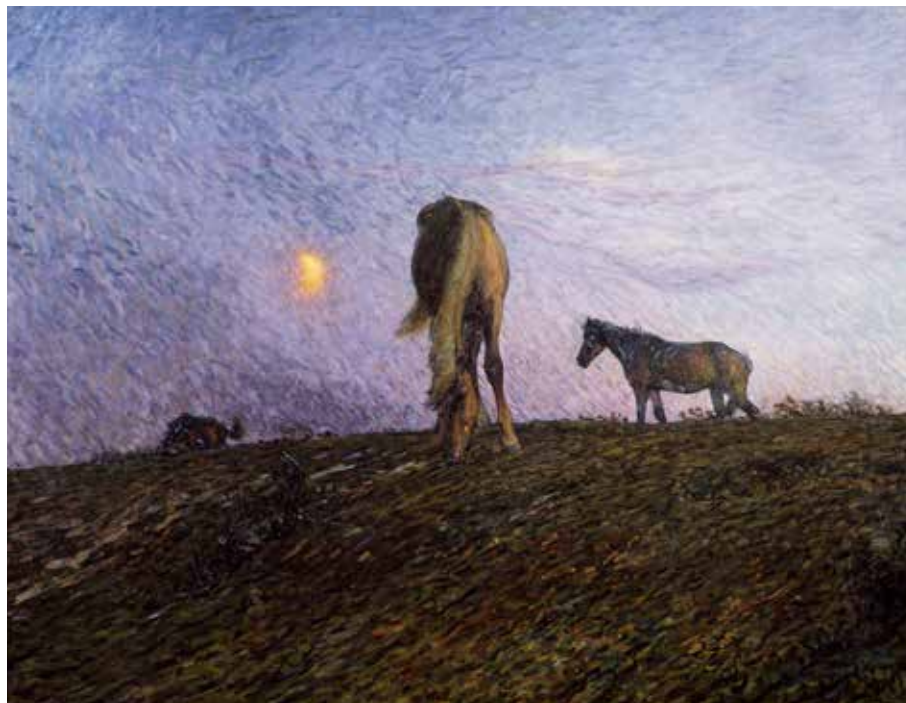
Nils Kreuger (1858–1930) Natten kommer. Nationalmuseum.

Utställningen visas 28 maj 2019–19 april 2020. Skolprogram kan bokas från september. Se detaljprogram på nästa uppslag.