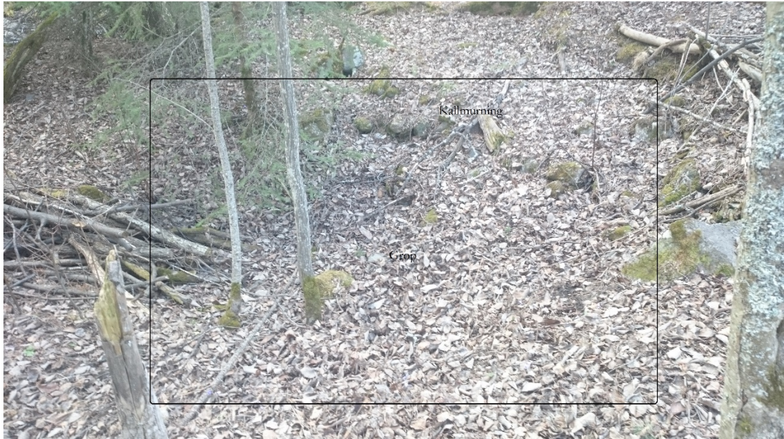
Bild 1 Husgrunden sedd från NÖ

På norra sidan av ån kommer inte arbete att företas och det påträffades heller inga rester av de kvarnar som finns på storskifteskartan. Däremot ligger det en husgrund (-1) på åns norra sida strax innan för mynningen ut i Storsjön. Den har inget med kvarnarna att göra utan det är mer troligt en husgrund efter en mindre byggnad av typen lada eller uthus.