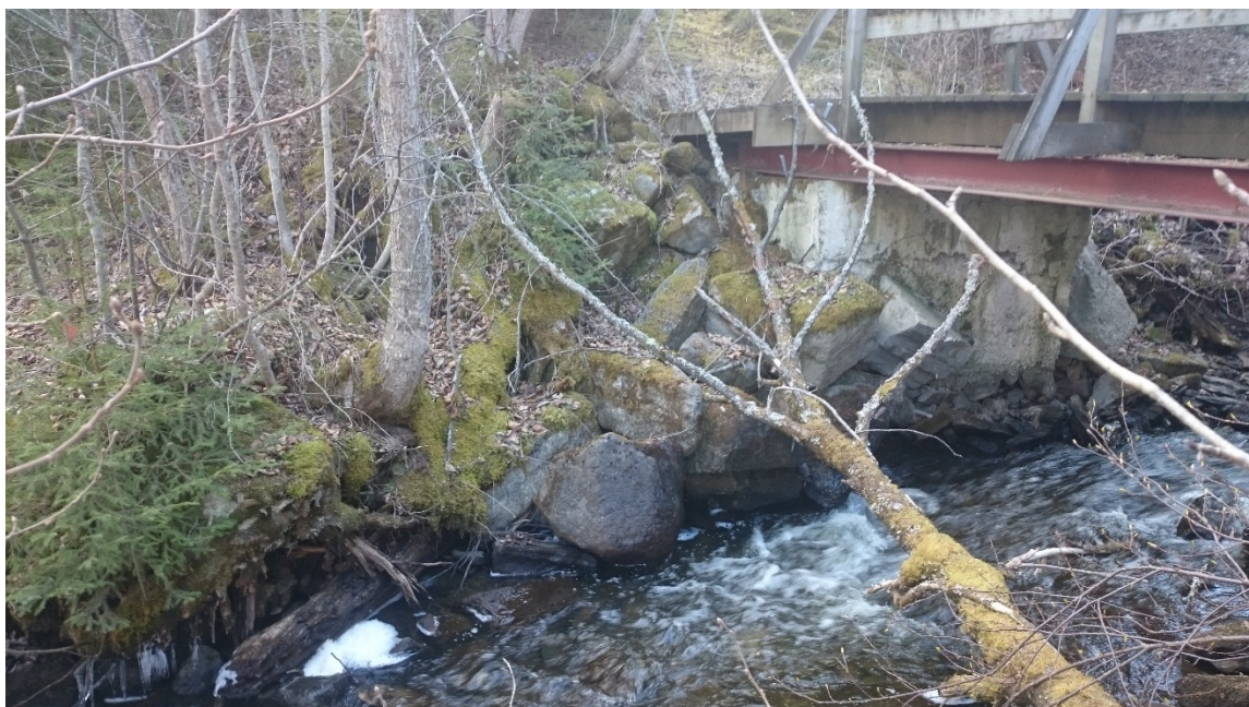
Bild 2 Dammvallen sedd från NV. Trärester syns i nedre vänstra hörnet.

Dammvallen (-2) är 10 m l (NV-SÖ), intill 5 m br och intill 0,5 m h. Den består av sten och jord. I botten av dammvallen finns rester av en träkonstruktion, bestående av enstaka stockar som går in under stenarna.