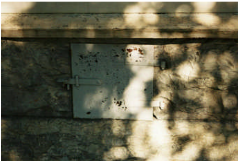
Ventilationslucka i kalkstenssockeln (bild nr 08m028/16).