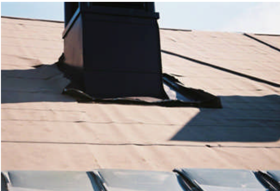
Ny underlagspapp har lagts (bild nr 08m029/32).