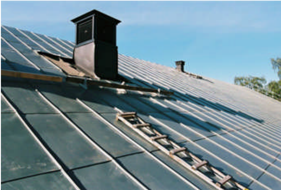
På det norra takfallet var plåttaket skivfalsat (08m031/18).