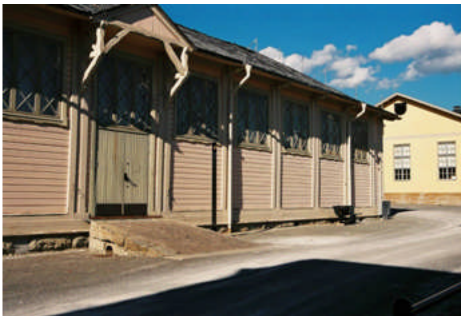
Huvudentrén på den södra sidan (bild nr 08m028/11).