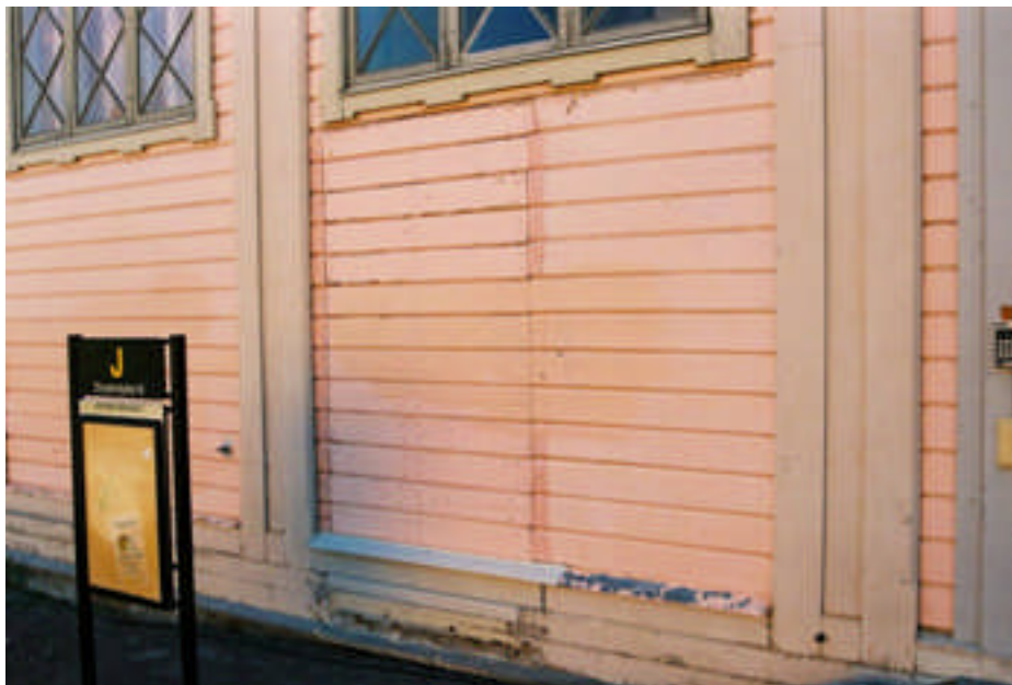
En dörr sattes igen vid renoveringen 2002 vilket syns tydligt genom generalskarven och fotplåten (bild nr 08m028/05).