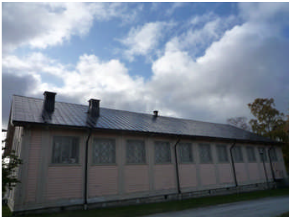
Det norra takfallet efter åtgärd (digital bild nr 1020547).