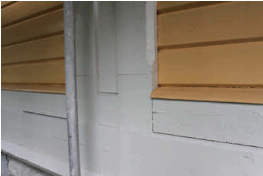
Samma parti av listverket efter att fasaden målats.