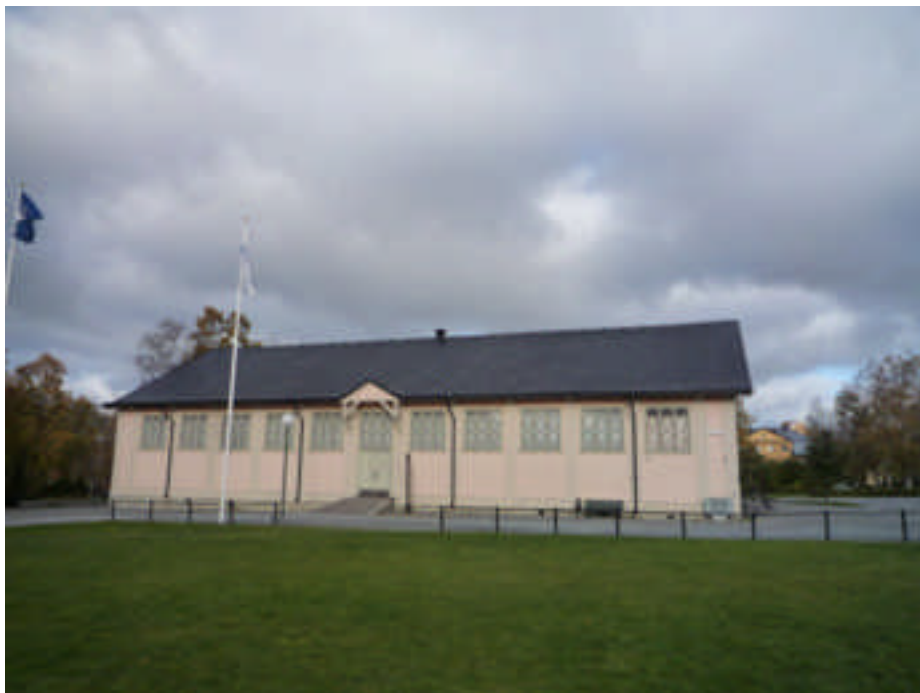
Det södra takfallet efter åtgärd (digital bild nr 1020553).