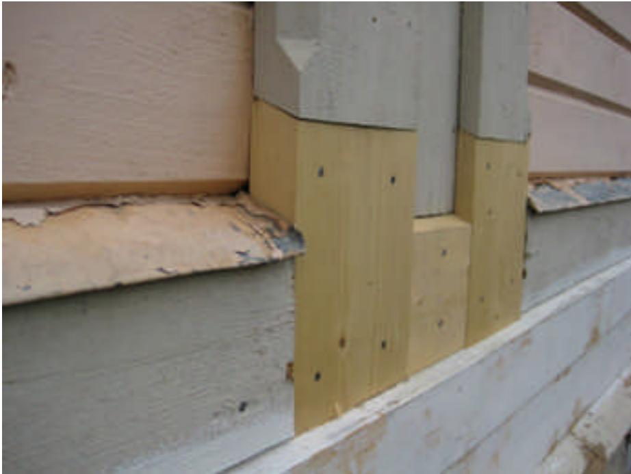
Delar av det ilagade listverket på västra gaveln ovanför sockelbrädan som också byttes.