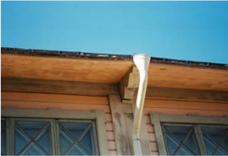
Takfot med stuprännor innan åtgärd (bild nr 08m028/12).