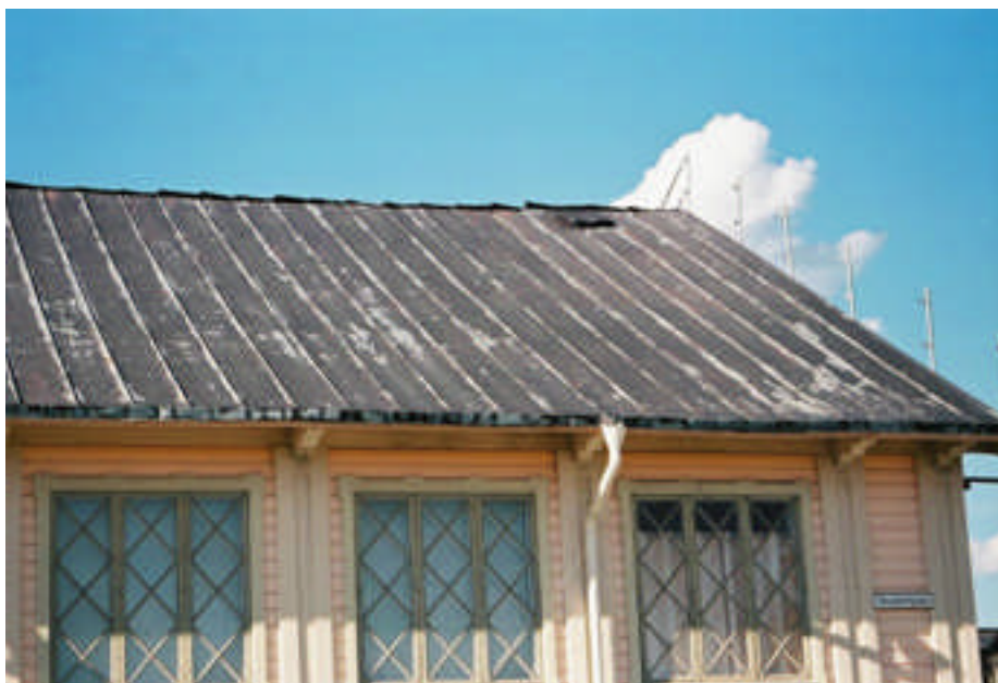
Plåttaket på den södra sidan innan omläggningen (bild nr 08m028/08).