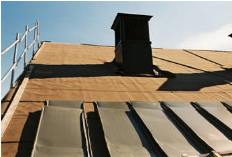
Den nya plåten håller på att läggas (bild nr 08m029/27).