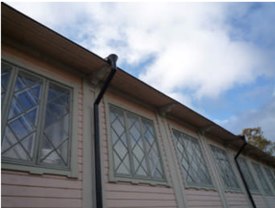
Nya stuprännor (digital bild nr 1020548).