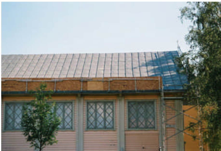
Delar av det nya plåttaket har lagts klart (bild nr 08m028/22).