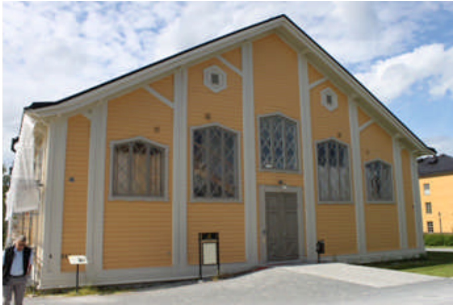
Östra gaveln vid slutbesiktningen.