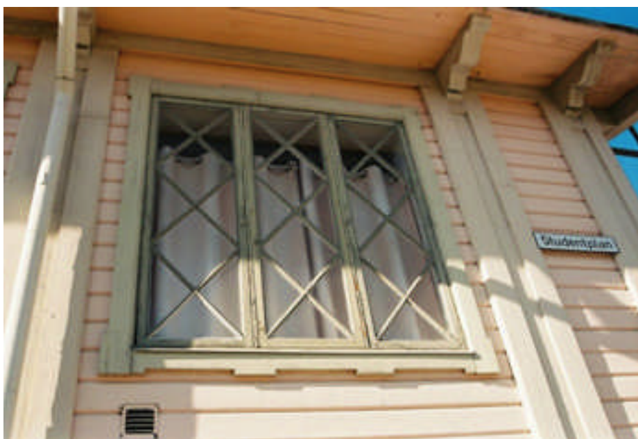
Ett av fönstren vid den södra sidan (bild nr 08m028/06).