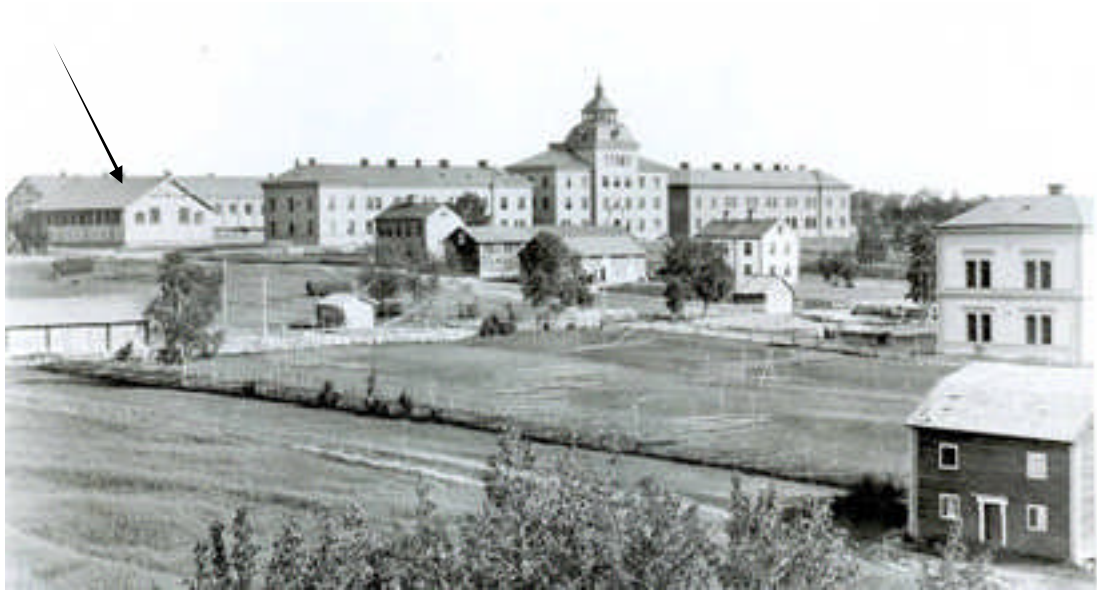
Pilen visar byggnad 16, Exercishuset. Foto från 1890-talet. (Reproneg 85 X-193/9, Jamtlis Arkiv)