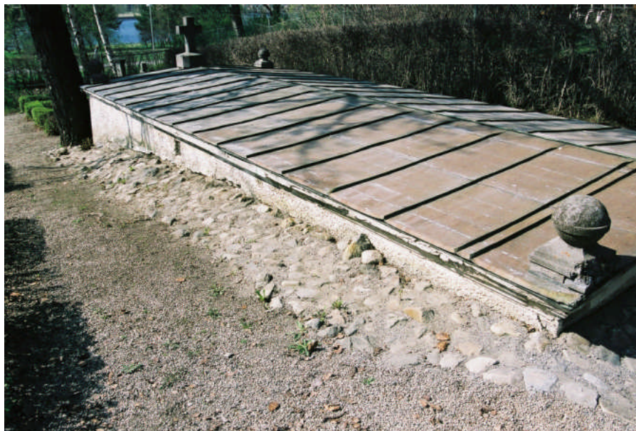
Bild 2. Gravkorets väggar och tak före åtgärd. De gjutna konststenarna var delvis skadade (bild 04M96/18).

frostsprängningar i marken) och bomytor.