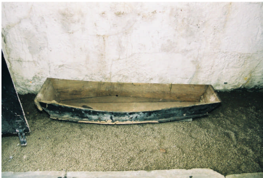
Bild 7. Den gamla innerkistan för Sara Helldahls kvarlevor bevaras i gravkoret (bild 05m11(15)).

Den yttre sarkofagen har fått nya lejonassur av björk, de ursprungliga tassarna var även de av lövträ, osäkert vilket träslag. Tassarna har pluggats fast samt limmats. Ett nytt bakstycke har tillverkats av delar från långsidorna och spikats ihop och långsidorna är nytillverkade. Sarkofagen har sedan målats med en gråvit oljegrundfärg och fått en marmorering med mörka inslag. Nya delar har behandlats med Ljunga oljelasyr med pigment av grönumbra, bensvart och kromoxidgrönt.