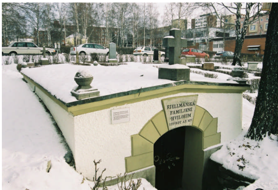
Bild 4. Gravkorets entré efter åtgärd. Putsen har utvändigt avfärgats (bild 05M11/22)

Väggarna med yta av spritputs har liksom listverk vid takfot och kvaderristning runt porten lagats med hydrauliskt kalkbruk där det behövts och sedan avfärgats i en ljus kul kulör. Informationsskylten har rengjorts och satts tillbaka på ursprunglig plats vid ingångens vänstra sida.