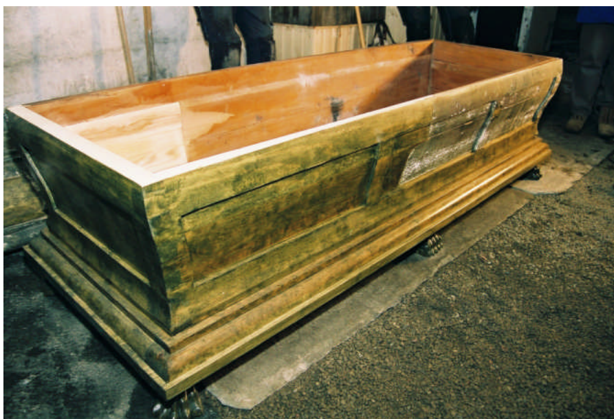
Bild 8. Sara Helldals sarkofag lagades i med nytt trä som målades lika det befintliga måleriet.

Lagningarna är laserade och gör det möjligt för träets struktur att träda fram samt att man kan se vilka delar som är nya på sarkofagerna. Lasyren på sarkofagerna har sedan behandlats med en oljebaserad lack.