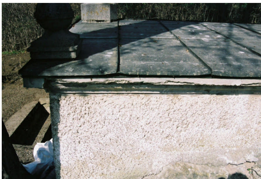
Bild 3. Närbild av den skadade putsen längs takfoten (bild 04M96/20).

Tre sarkofager står inne i gravkoret. De står ojämnt p.g.a. sättningar i underlaget. Sarkofagerna är samtliga tillverkade av ek. Innerkistorna till A P Fjellman och Brita Fjellman är av plåt, möjligen zink. Sara Helldahls innerkista är av trä. Sarkofagerna står uppställda på ett fundament av skifferplattor.