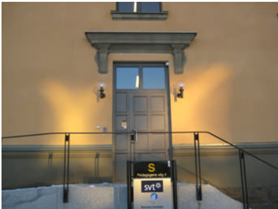
Den färdiga dörren med kornisch (digital bild nr 2046).