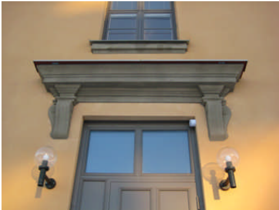
Kornischen ovan den nya dörren (digital bild nr 2047).