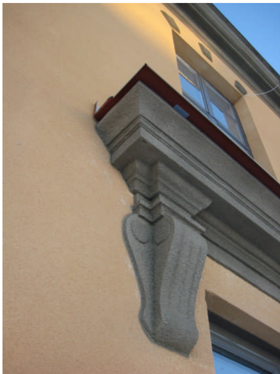
Detalj av kornischen (digital bild nr 2056).