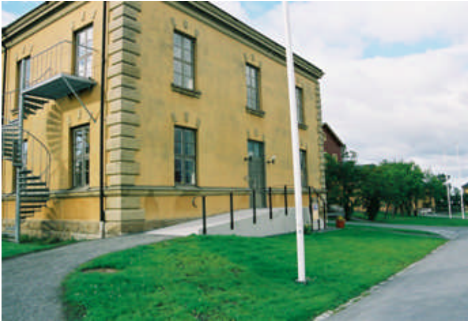
Den färdigbyggda rampen (bild nr 05m140/31).

Handikapprampen har utformats i likhet med övriga handikappramper på A4 Campus. Rampen byggdes upp av granithällar med en trappa på ena sidan. Körytan täcktes med mindre granitplattor. Längs kanten mot fasaden lades en rad med gatsten. Räcket tillverkades av smide som har målats svart.