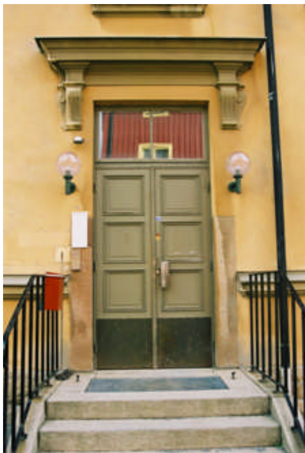
Den befintliga västra entrén (bild nr 05m140/35).

Kornischen ovan dörren har utformats lika den befintliga som finns ovan entrén i väster. Arbetet utfördes i samband med fasadrenoveringen 2007.