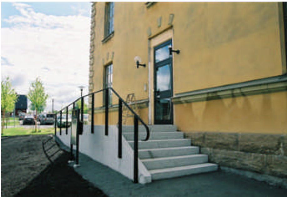
Rampens trappa (bild nr 05m076/32).