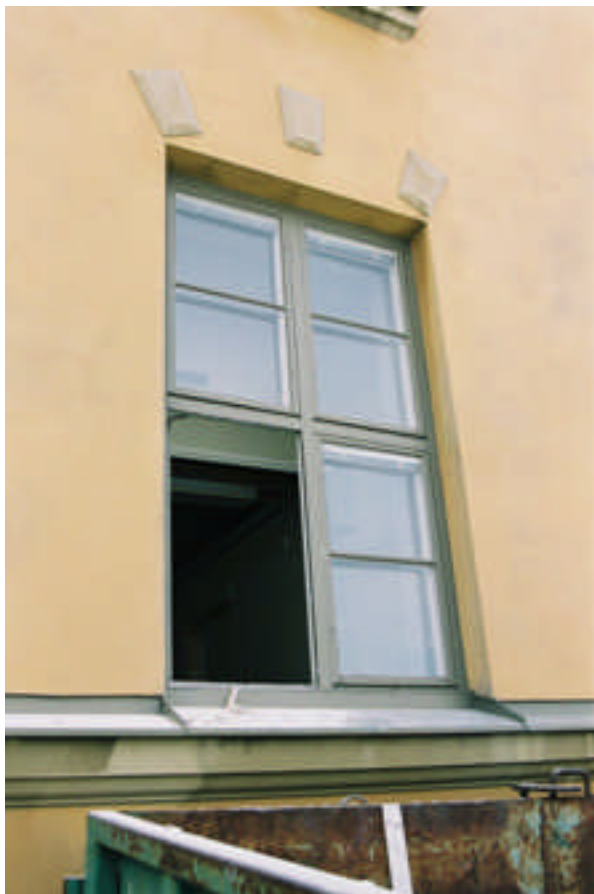
Fönstret där dörren senare togs upp (bild nr 05m011/28).

Byggnadens enda entré fanns på den västra fasaden. I och med en interiör ombyggnad av Byggnad 38 för kontor uppkom en diskussion om att öppna upp en ny entré på den norra gaveln. Detta för att möjliggöra för en hiss och handikappentré. Enligt äldre fotografier har det funnits en entré som senare murats igen och ersatts med ett fönster. När gaveln undersöktes visade det sig även att en tidigare öppning funnits på platsen.