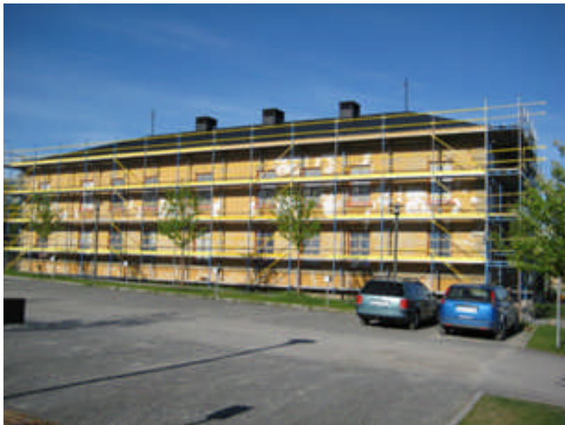
Den östra fasaden under fasadrenovering 2007 (digital bild nr 0099).

Regementet har byggts till i olika omgångar under årens lopp, senast 1972 då en militärrestaurang byggdes. 1974 övergick A4 till att bli en ren utbildningsmyndighet. De sista värnpliktiga blev klara med sin utbildning under våren 1997. A4 fanns kvar som regemente fram till 31 december 1997.