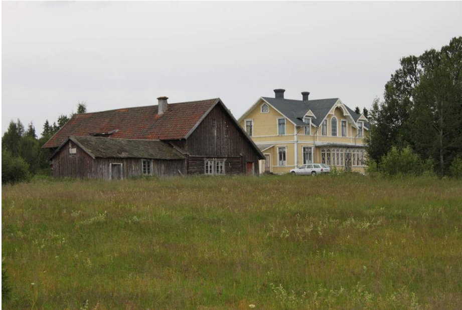
Enafors turisthotell med ladugården till vänster. Norra och östra fasaderna. IMG_1914 Foto: Hampus Benckert 2009