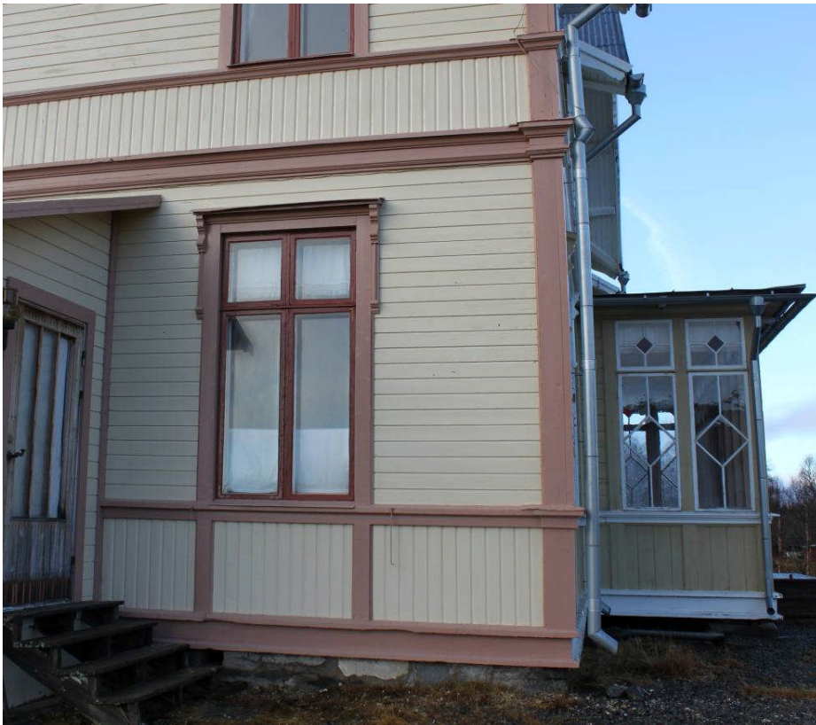
Fönstrens ytterbågar kittades med linoljekitt och målades med linoljefärg i en roströd kulör. IMG_6581