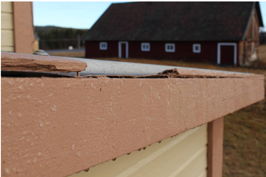
Skadat virke på den lägre utbyggnadens taklist. IMG_6601