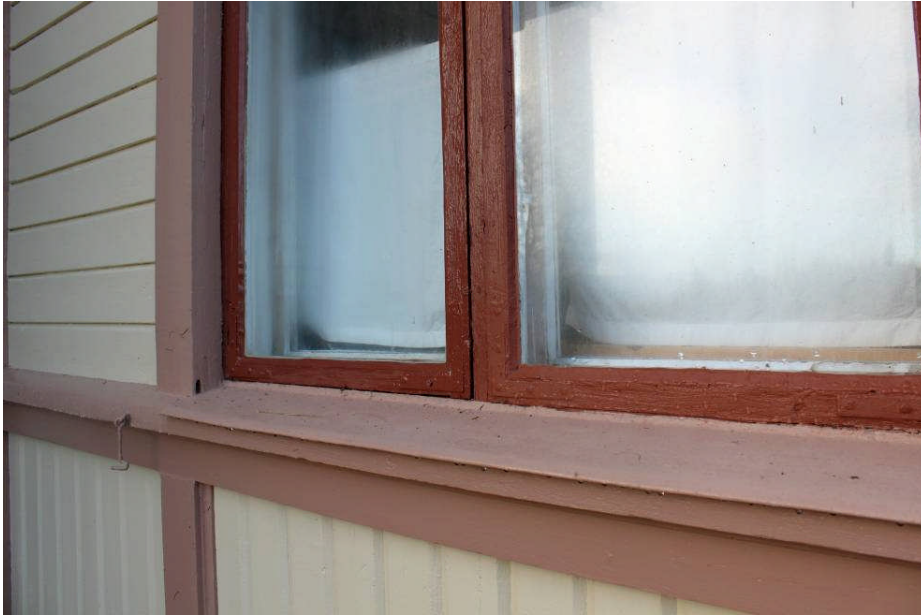
Del av östra fasaden, efter målning. Fönster- och listbleck har rengjorts och målats med rostskyddsfärg för att sedan målas in i samma kulörer som listverk och foder. IMG_6582