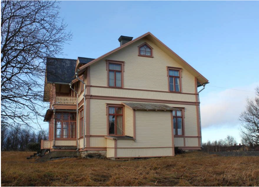
Enafors turisthotell, efter målning av östra fasaden. IMG_6606