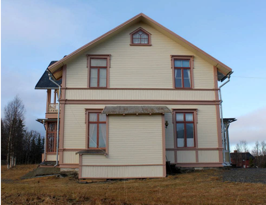
Östra fasaden, efter målning. All akrylatfärg inklusive äldre färglager på fasaden har tagits bort innan ommålning. Fönstrens ytterbågar transporterades till Söderbergs glas och snickerier AB i Järpen för glasarbeten. IMG_6605