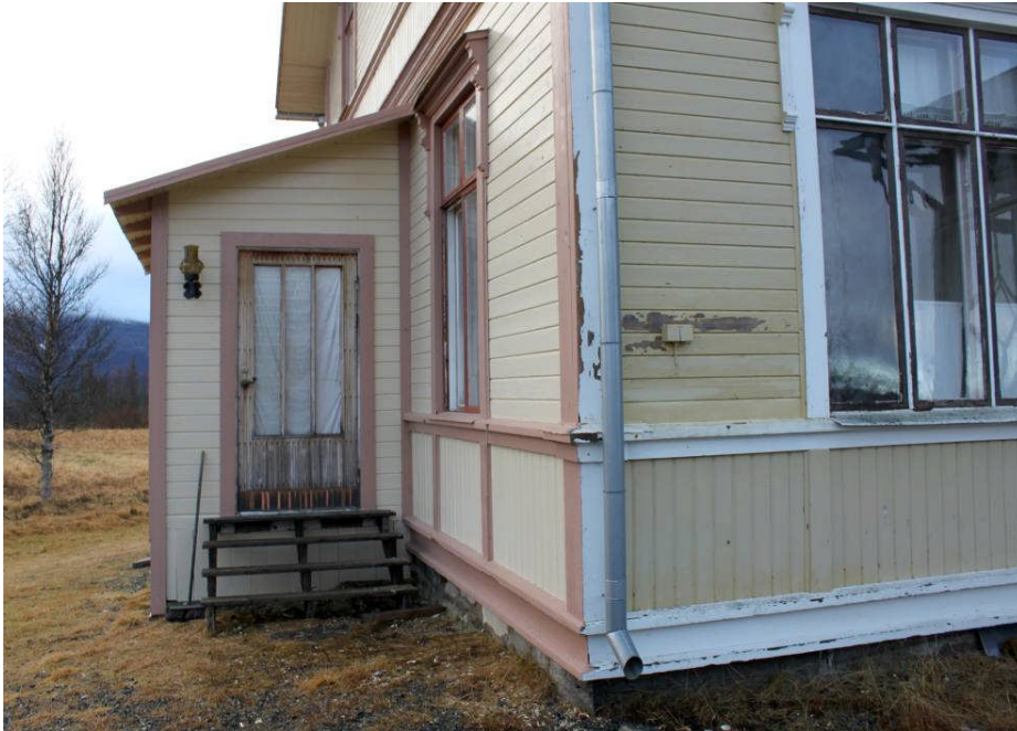
Den östra fasadens utbyggnad, efter målning samt delar av den ej ännu åtgärdade norra fasaden. Fasaderna och brädorna i taksprånget har målats i ljusgul kulör. Listverk och foder har målats i brunrosa kulör. IMG_6573