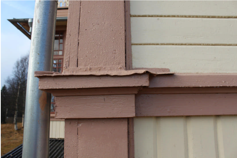
Detaljbild på bleck ovan bröstlist. IMG_6588