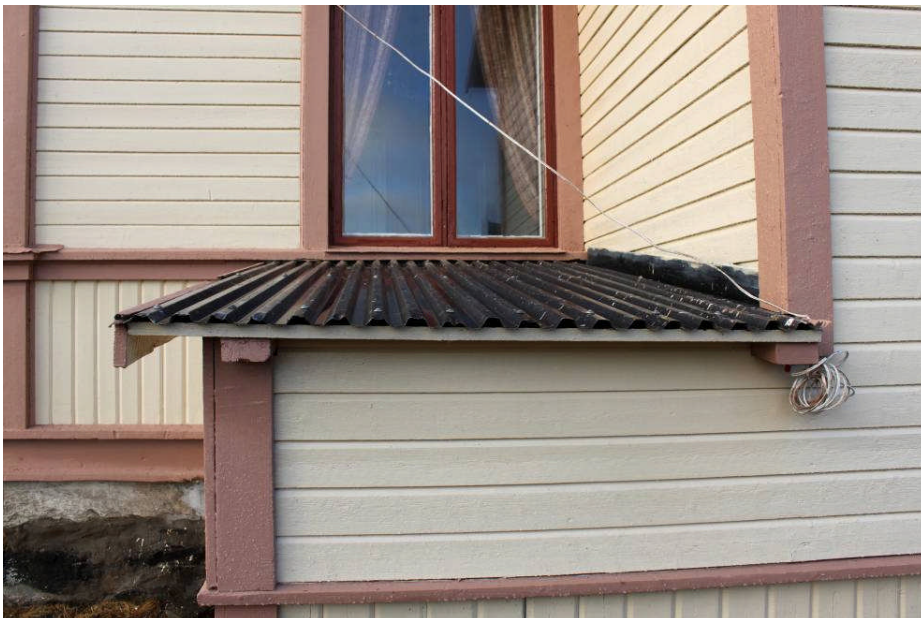
Del av östra fasaden med utbyggnad, efter målning. Samtliga målade ytor på trä har grundats och målats två gånger med linoljefärg. IMG_6603