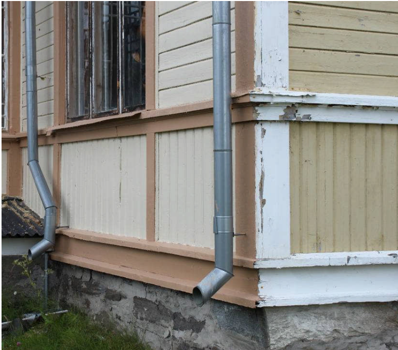
Del av södra fasaden, efter målning och östra fasaden innan målning. IMG_1903