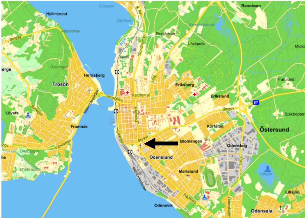
Ur allmänt kartmaterial, © Lantmäteriverket. Ärende nr MS2006/02204