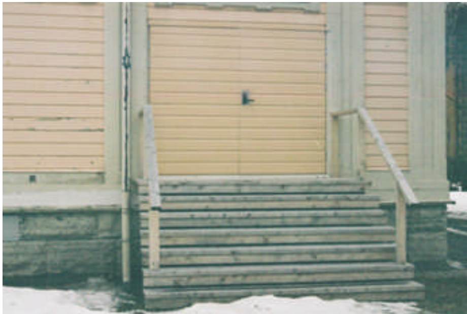
Utrymningstrappan från norr (bild nr 04m021/31).