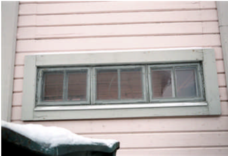
Den östra gaveln. Ett av två fönster före igensättning (bild nr 02m136/01).