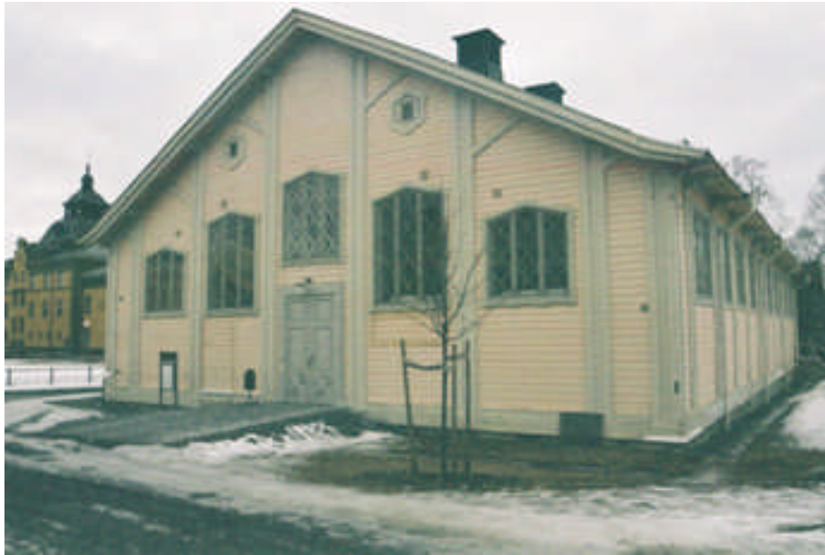
Den östra gaveln efter åtgärd (bild nr 04m021/29).