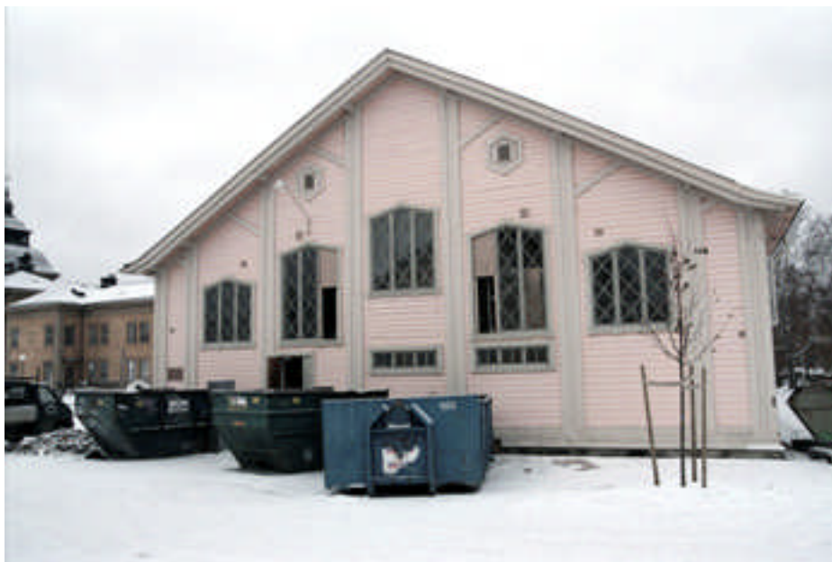
Den östra gaveln före åtgärd (bild nr 02m125/25).