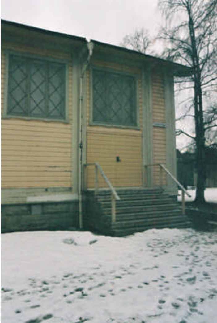
Utrymningstrappan på den norra långsidan (bild nr 04m021/32).

övrig fotplåt. En renovering planeras av hela byggnaden. Avsikten är då att få en enhetlig kulör på fasaden och åtgärda bristerna.