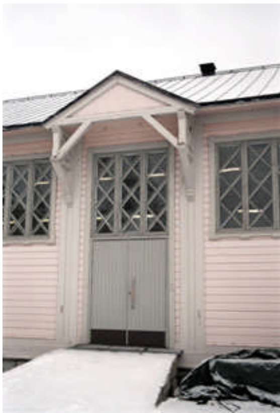
Den södra långväggen med befintlig entré (bild nr 02m125/28).

Byggnad 16, tidigare exercishus, färdigställdes 1893. Gavelfasaden åt öster har någon gång under 1950-talet byggts om i samband med tillkomsten av omklädningsrum och en mindre övervåning i Exercishuset. Vid det tillfället flyttades entrépartiet söderut samtidigt som två liggande fönster togs upp. Det stora fönstret i mitten kortades av nedtill av hänsyn till det nya våningsplanet.