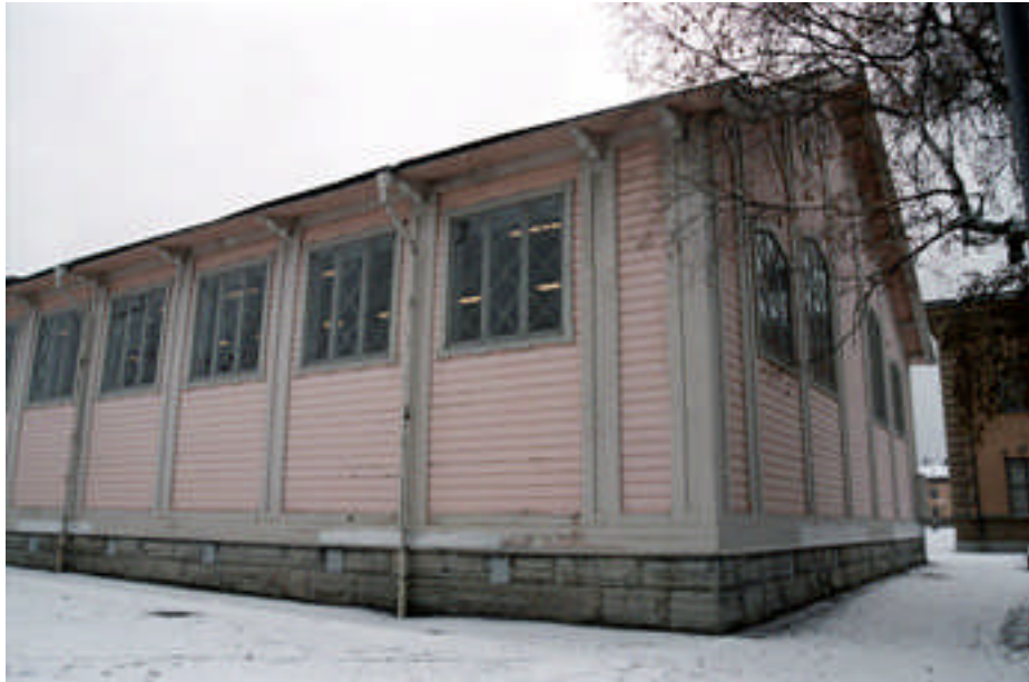
Den norra långväggen före åtgärd (bild nr 02m125/22).