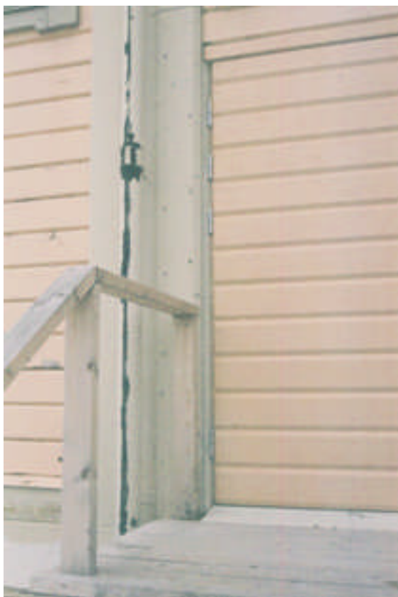
Detalj av räcke och gångjärn vid utrymningsvägen (bild nr 4m021/34).