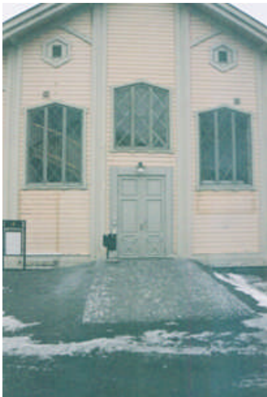
Den östra gaveln efter åtgärd. Spår av den igensatta dörren samt ett av fönstren syns tydligt på fasaden (bild nr 04m021/25).