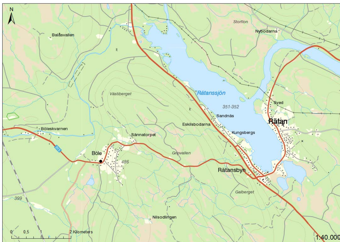
Översiktskarta med utredningsplatsen markerad med svart prick.

De vatten- och avloppsledningar som ska dras fram kommer att beröra de delar av blästplatsen som inte undersöktes för breddningen av vägen och eventuellt kan rester av rostplatsen och kolupplägget/kolningsanläggningen att beröras av ingreppet.