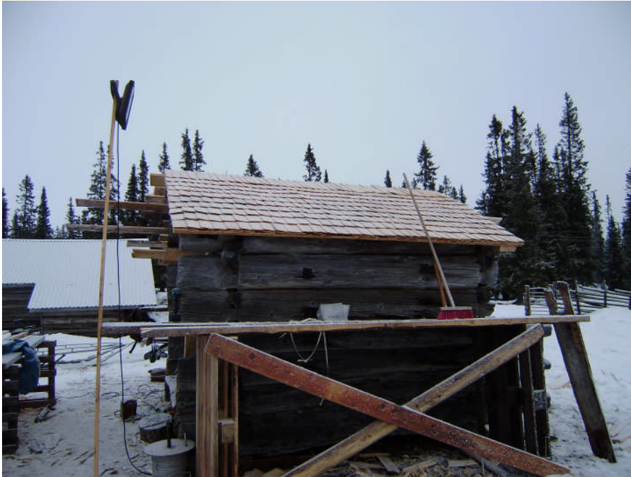
Taket under restaurering (digital bild nr 30290).