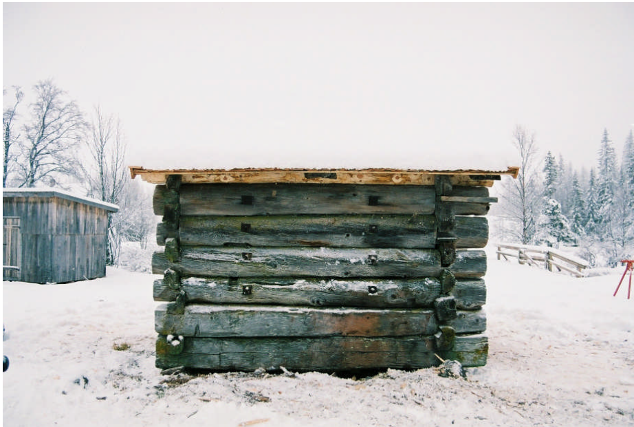
B-vägg efter restaurering (bild nr 09M043/29).