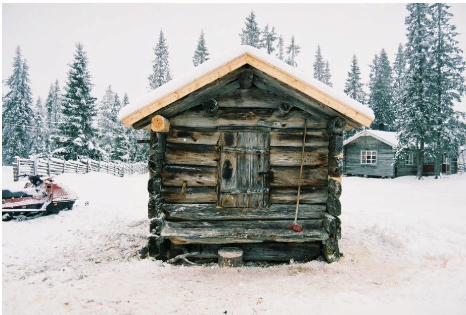
A-vägg efter restaurering (bild nr 09M043/28).