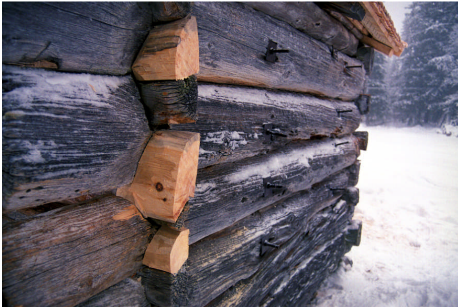
Lagningar vid A-D-hörn (bild nr 09m046/06).