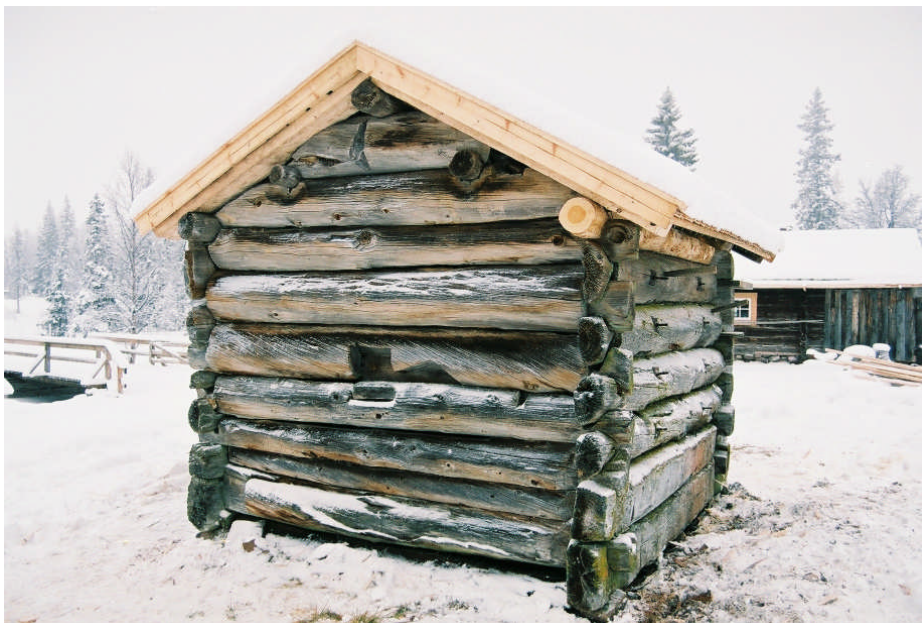
C-vägg efter restaurering (bild nr 09M043/30).