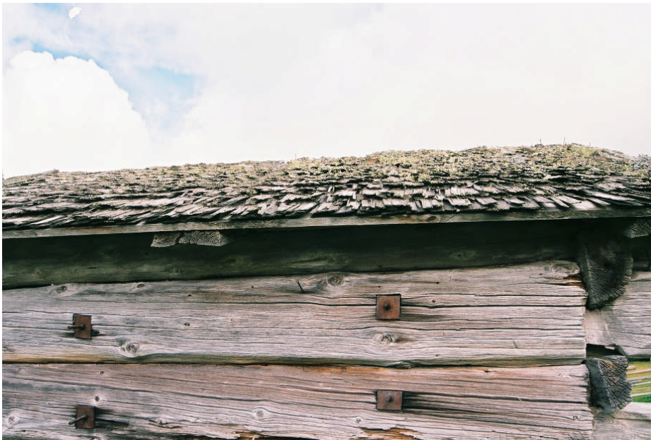
Spåntaket innan omläggningen (bild nr 08M036/05).