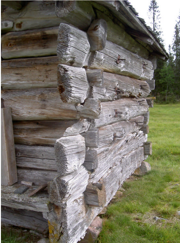
Lösa och trasiga knutskallar vid A- och D-vägg (digital bild nr 7143).