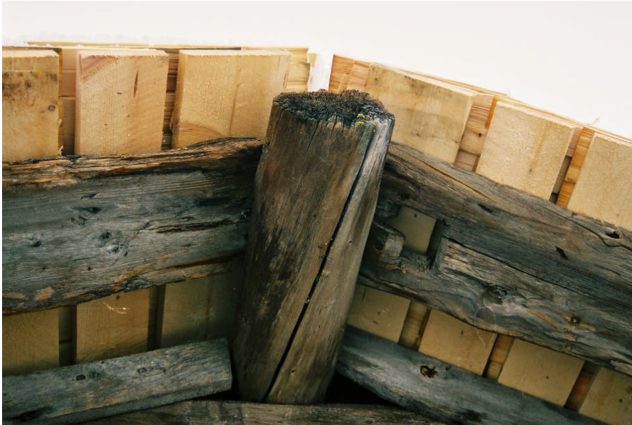
Spår av benladans tidigare planktak (bild nr 09M043/15).