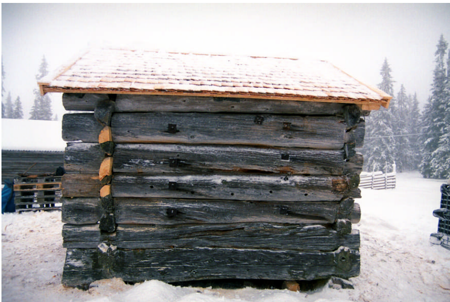
Det färdigrestaurerade spåntaket (bild nr 09m046/02).