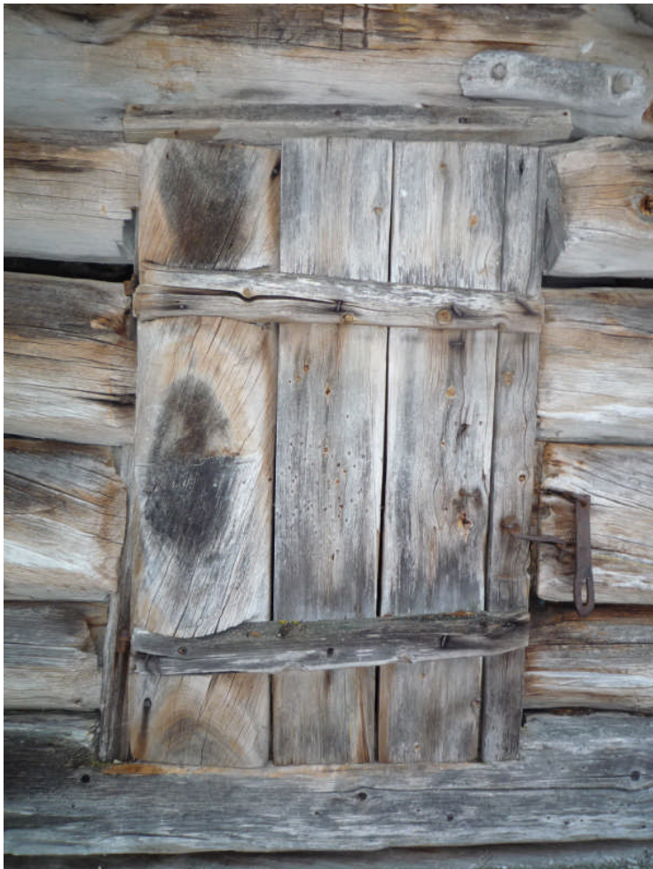
Dörren innan justering (digital bild nr 1020847).

Dörrens gåt har lagats, gångjärnen har justerats och dörren har riktats.