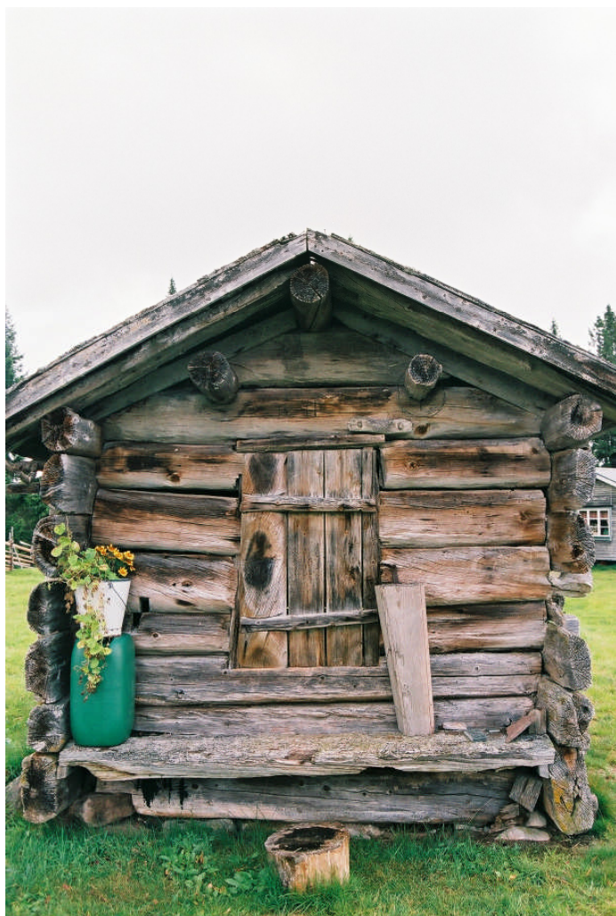
Benladan i augusti -08 (bild nr 08M036/01).