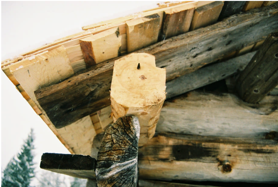
Det bytta hammarbandet på B-vägg (bild nr 09m043/19).