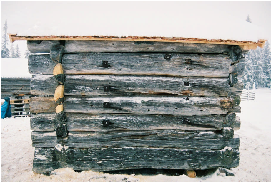
D-vägg efter restaurering (bild nr 09M043/34).