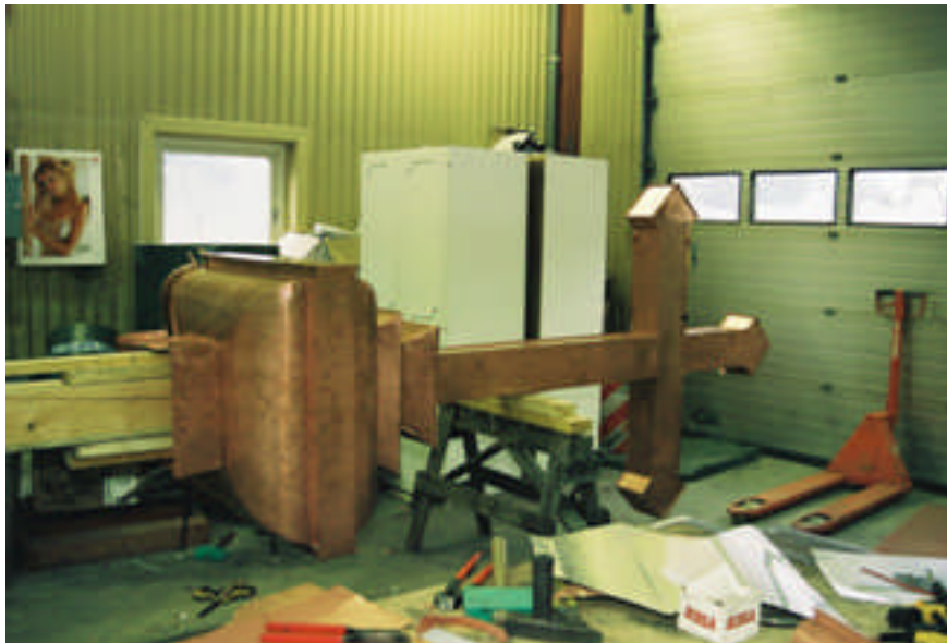
Bild8: Korsgloben efter restaurering.