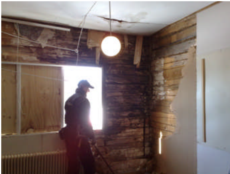
Väggen och taket i skolsalen var mycket rötskadade.

Stomme Stora rötskador hade uppstått i hörnet mellan kapell- och skoldel. Väggen är där dubbelt timrad och skador fanns både på övervåningen i en av skolsalarna och i slöjdsalen i kapelldelen. Skador fanns på yttervägg och insida, från takbrytringen och ner till kapellets innertak. Skadorna syntes främst genom att timret i slöjdsalen hade spruckit och på utsidan hade knutlådan öppnats.