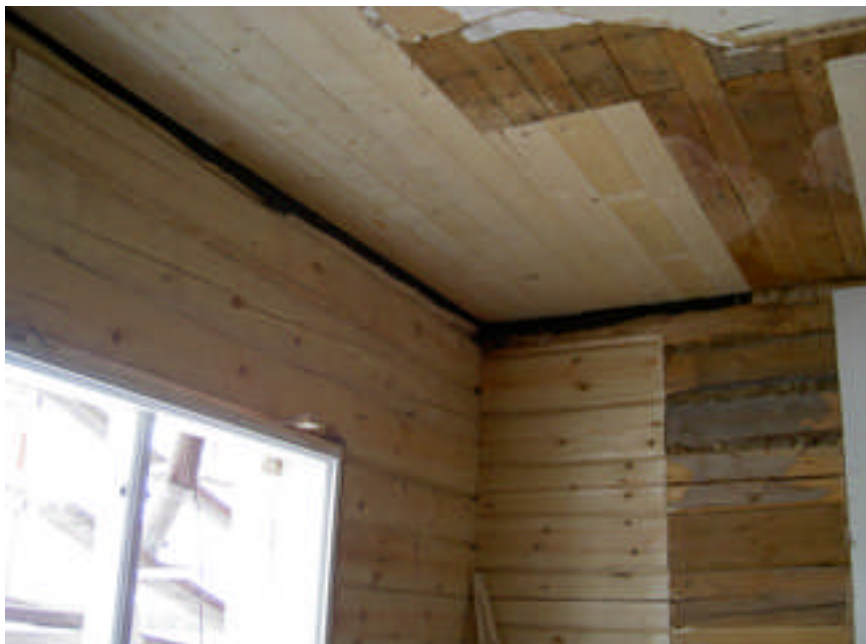
Lagningar i väggar och taket i skolsalen. Här har också fönsterkarmen satts tillbaka (digital bild nr 8185).