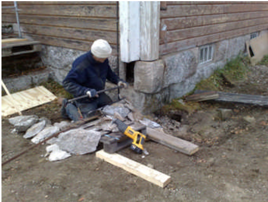
Det sydvästra hörnet demonterades och riktades.