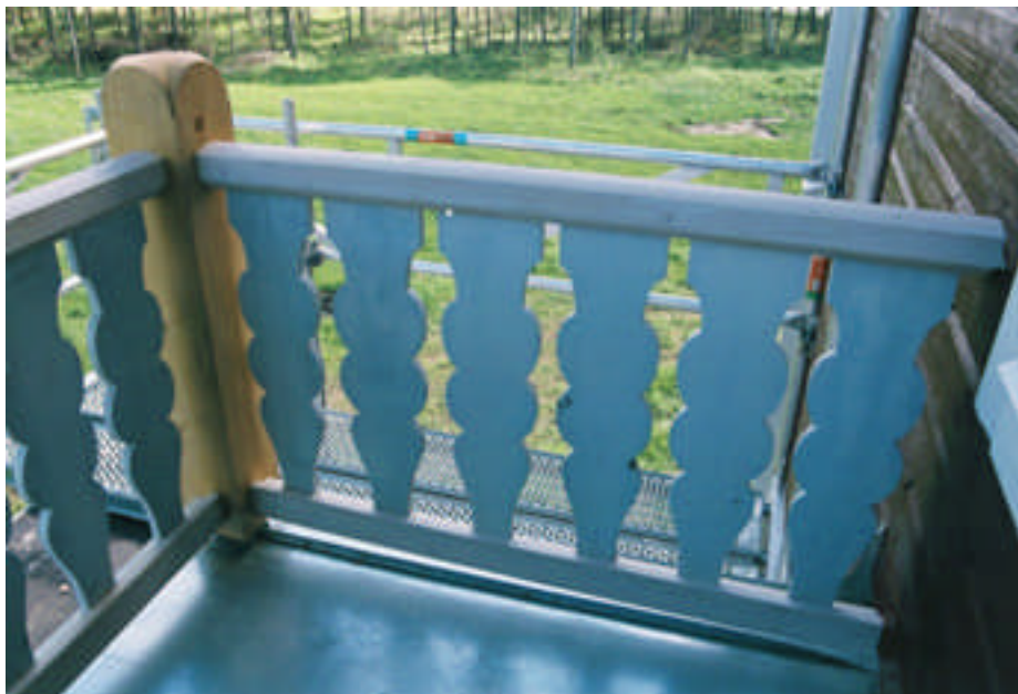
Nyttillverkade stolpar, under- och överliggare samt ny plåt. Pinnarna kunde återanvändas (bild nr 09m015/11).