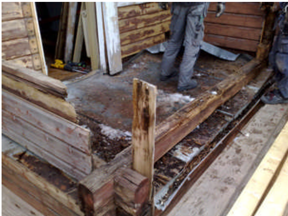
Stora rötskador fanns i hela balkongen.