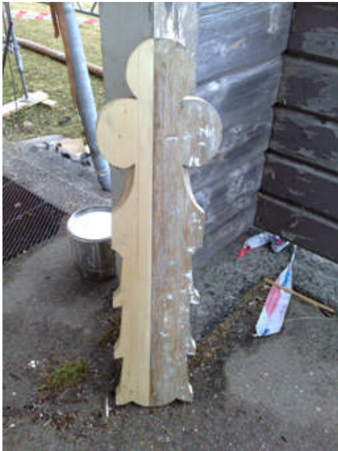
Entrétaketets dekoration under lagning.

Fönster Från början var alla fönster på Hunge kapell blyinfattade. I samband med en renovering på 1950-talet byttes dock flera av skoldelens fönster ut till ospröjsade, medan kapellet behöll de gamla.