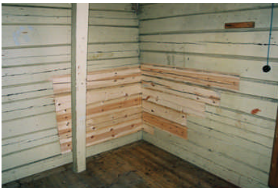
Lagningen i slöjdsalens vägg (bild nr 09m022/05).