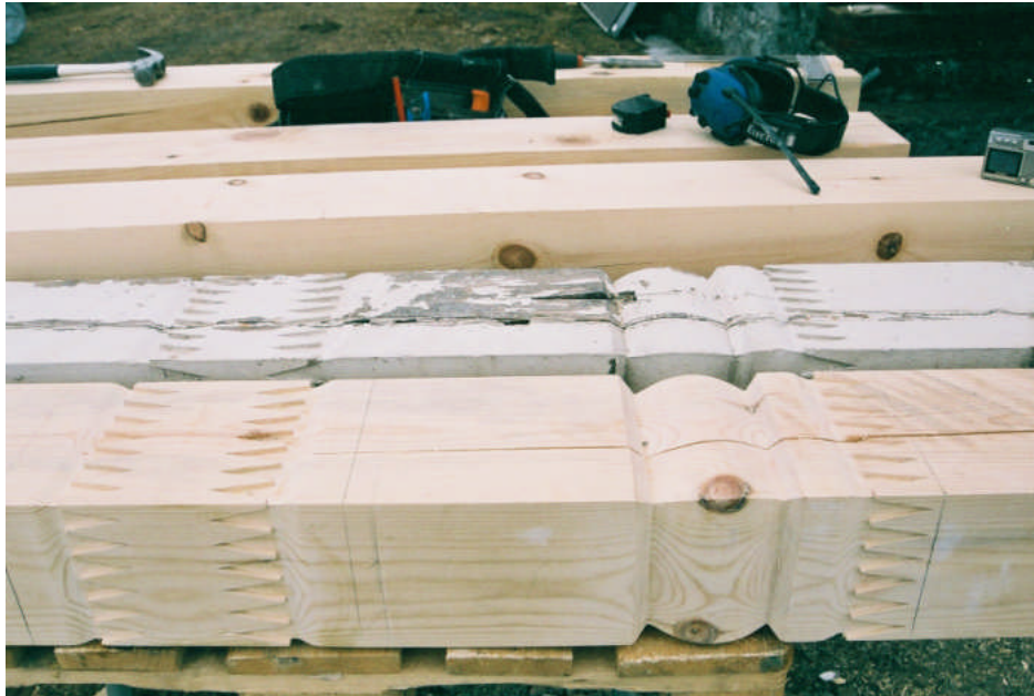
TVå av snedsträvorna nyttillverkades (bild nr 09m06/19).