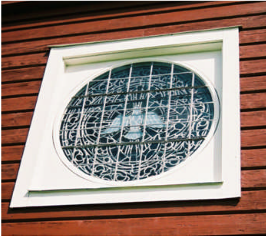
Korfönstret efter restaureringen (bild nr 09m22/17).

Inne i karmen har en tätningslist satts fast. Två stycken extra hakar har satts fast på korfönstrets insida, nu finns där sex stycken. Stormjärn har monterats både på in- och utsidan.