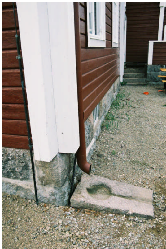
Det sydvästra hörnet efter åtgärd (bild nr 09m022/15).