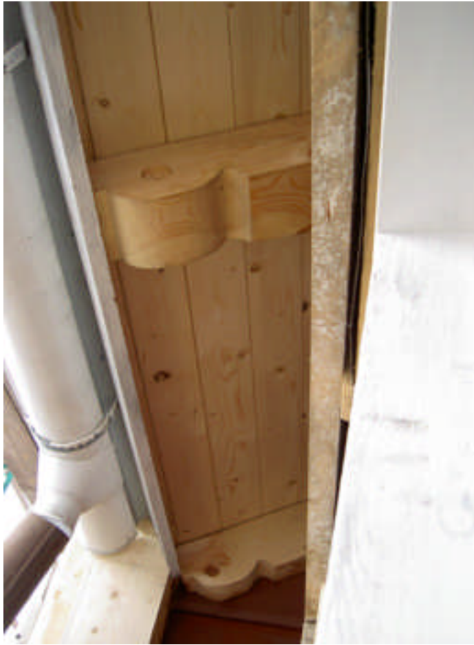
Bytta taktassar och rotbrädor vid mötet mellan skol- och kapelldel (digital bild nr 8187).

Entrébalkong Balkongen ovan skolentrén hade stora rötskador framför allt i räcket av timmer och i golv. Tre åsar kopierades och byttes ut ända in i korridoren innanför.