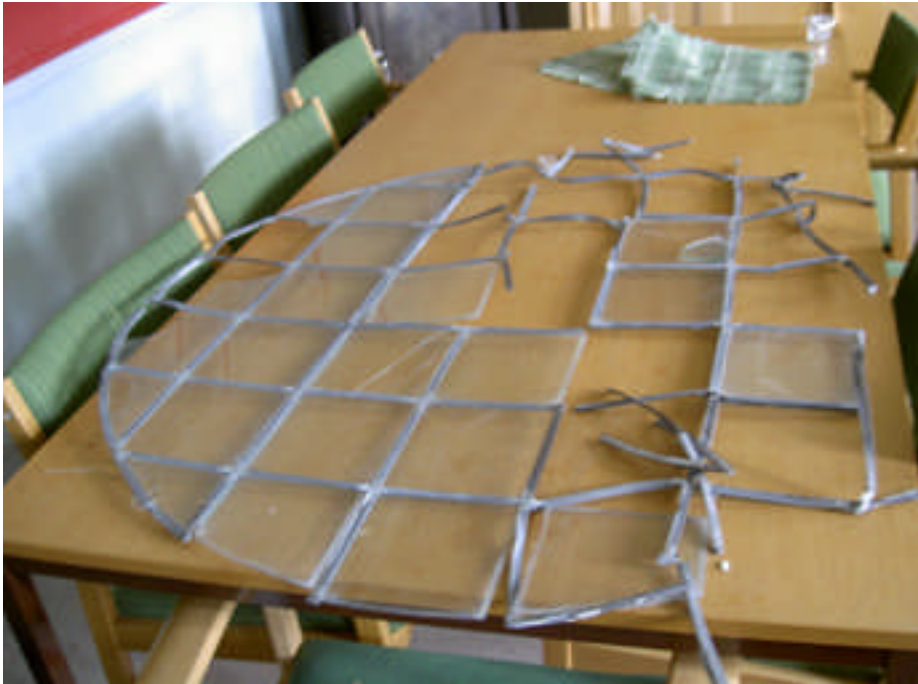
Glas och blyspröjs i korfönstrets ytterbåge var mycket trasigt (digital bild nr 080813 003).

Korfönster Det runda korfönstrets blyinfattade ytterfönster hade fallit ned under hösten och var i stort behov av renovering. Ytterbågen fick ny förstärkt blyspröjsning. Den förstärkta spröjsen är ca 1 mm bredare på vardera sida och gjorde därför att originalglaset fick skäras om. Den inre bågen med färgade glas lagades, förstärktes och rengjordes.