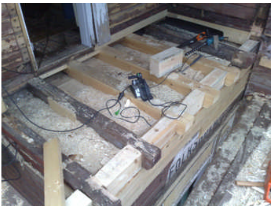
Flera golvåsar i balkongen byttes ut och även tre timmerstockar under räcket.