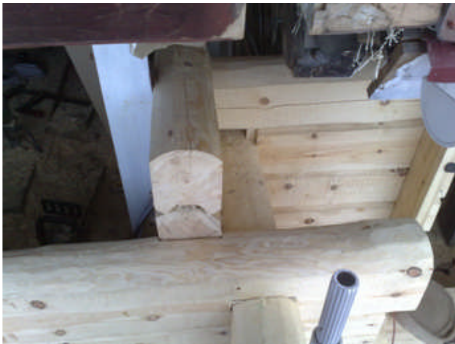
Väggen mellan skol- och kapelldel är dubbelt timrad.