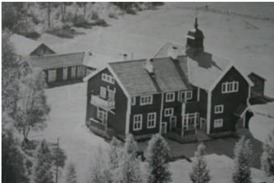
Hunge kapell på ett flygfoto taget på 1950-talet. Fotografiet hänger nu i samlingslokalen (digital bild nr 0928).

Enligt uppgift målades kapellet om utvändigt någon gång under 1950-60-talet med en plastbaserad färg i brun kulör. Under 1980-talet lades yttertaket om efter att det gamla tegeltaket p g a bristande underhåll hade börjat läcka. Taket täcktes med röd trapetskorrugerad plåt.