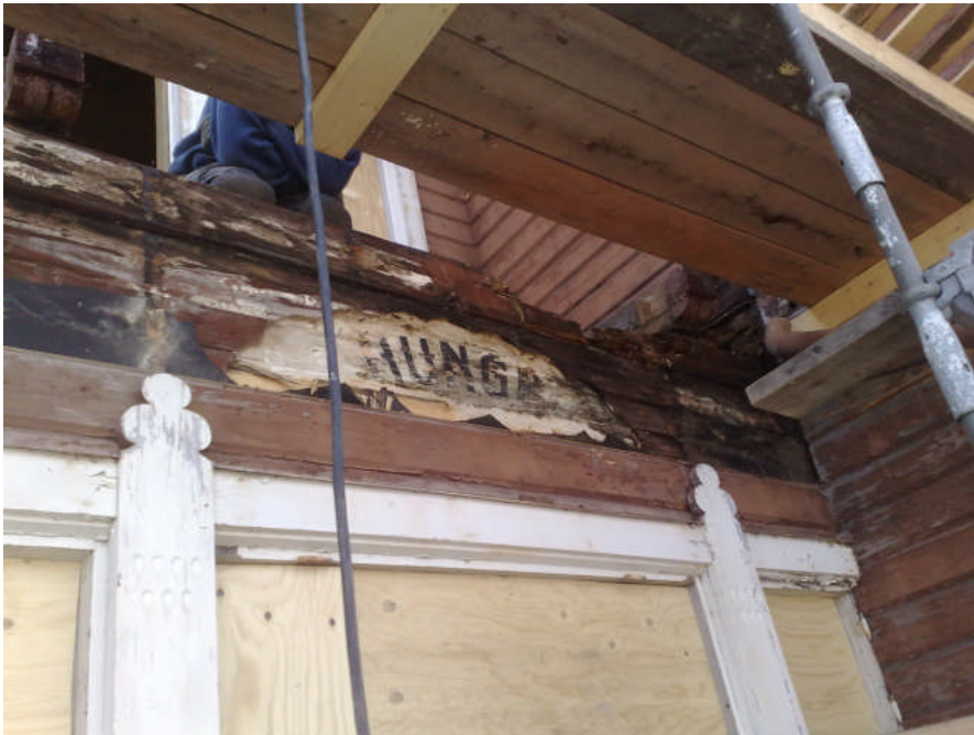
När panelen ovan dörren demonterades kom den gamla skylten fram.

Då den utanpåliggande panelen på räcket och ovan dörren tagits bort upptäcktes att en vit skylt med texten ”Hunge folkskola” i svart fanns inprästat i timret som tidigare varit synligt. Eftersom timret var så rötat gick skylten inte att rädda, men den dokumenterades och en kopia har tillverkats som en lös skylt som kommer att sättas upp ovanför skolans port.