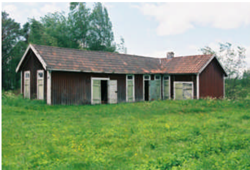
Uthuslängan (bild nr 09m014/16).

Hunge kapell ligger vid Hungsjöns strand. På tomten finns också en lada och en uthuslänga med dass som tillhör kapellet.