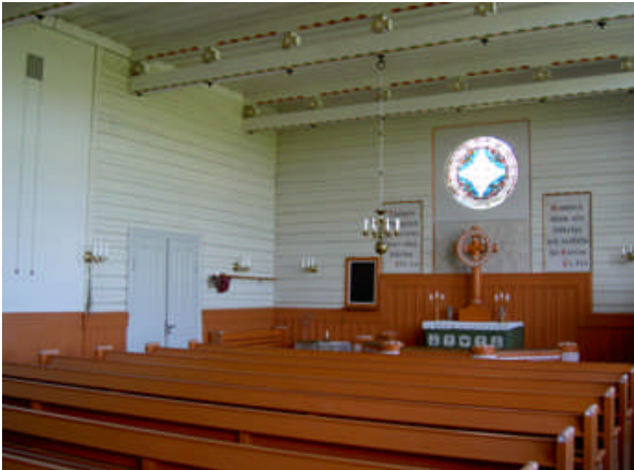
Väggen till vänster och bröstningspanelen i hörnet har bättringsmålats (digital bild nr 8648).

Bröstningspanelen i kapellsalens södra hörn hade en annan orange kulör än resten av panelen. Denna har bättringsmålats i samma kulör som övrig panel.