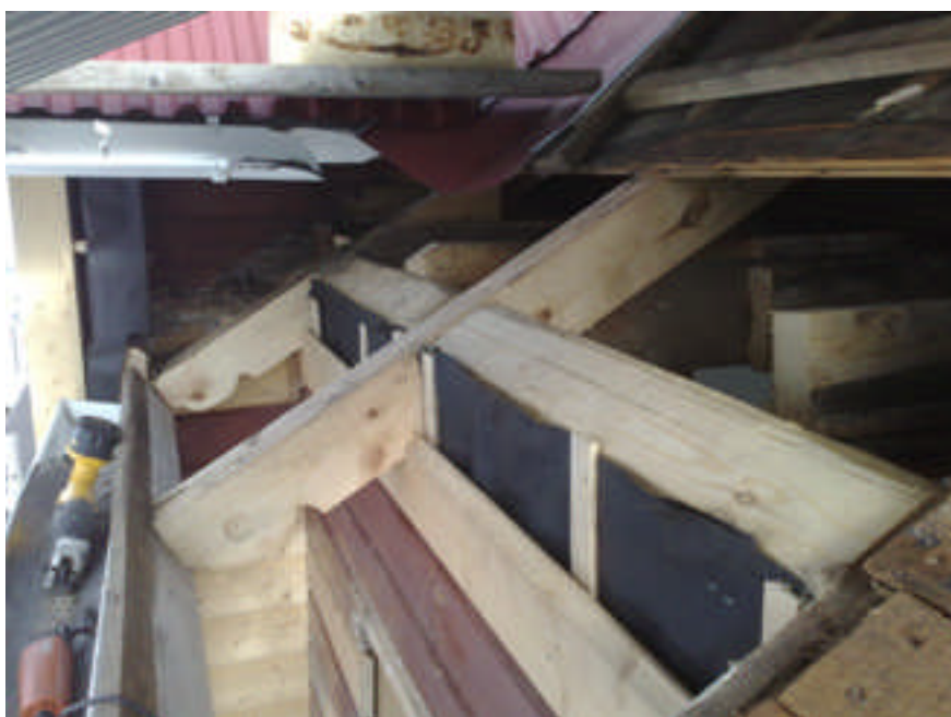
Lagade takstolar, även utbytt panel syns på bilden.