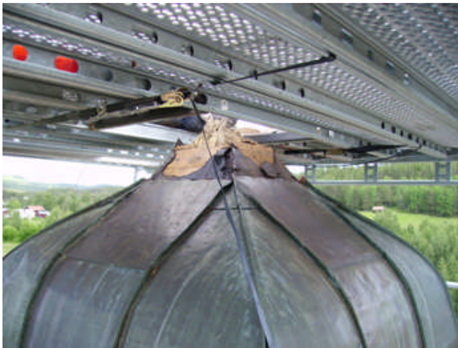
Trästommen under tornspirans kopparplåt var mycket rötad.

En ny stomme i trä tillverkades därför och ny kopparplåt lades kring den.