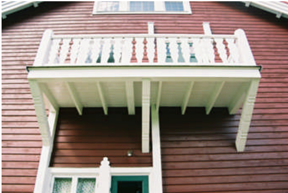
Den västra balkongen efter restaurering (bild nr 09m022/16).