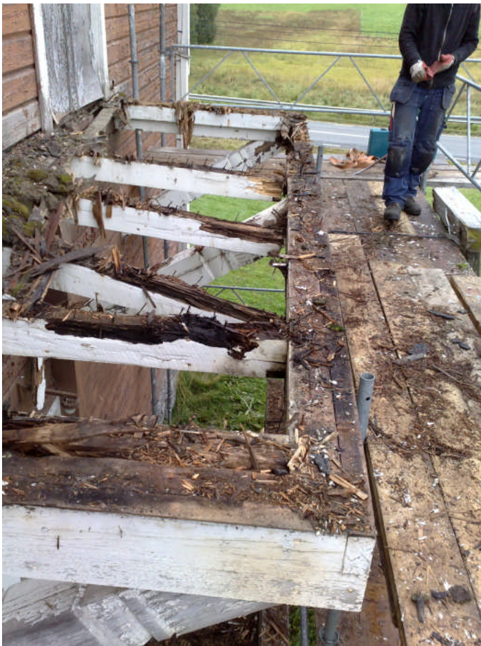
Den västra balkongen hade stora rötskador.

Hela balkongens underrede har bytts ut mot nytt virke och täckts med plåt på ovansidan. Över- och underliggare i räcket samt de två hömstolporna har nyttillverkats medan pinnarna har återanvänts.